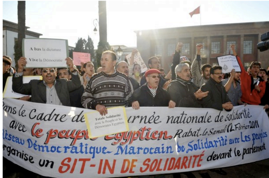
Les événements de Tunisie et d'Egypte ont relancé au Maroc, dans la classe politique et les milieux intellectuels, le débat institutionnel.

Imprimer Envoyer par e-mail Partager Voter (86) Commenter (44)