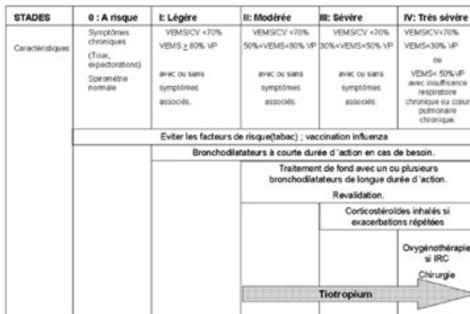
TABLEAU I : RECOMMANDATIONS INTERNATIONALES DANS LA BPCO (GOLD 2003).

proche de ce modèle, en effet si son affinité (nettement supérieure à l'ipratropium) de liaison est identique vis-à-vis des trois sous-types de récepteurs muscariniques, sa dissociation des récepteurs M1 et M3 est nettement plus lente que sa dissociation des récepteurs M2 avec consécutivement une action plus prolongée (4,5).