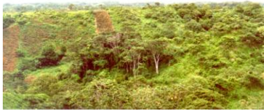
Domaine de Los Ríos