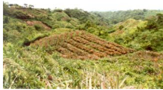
Domaine de La Francia II