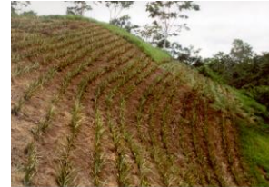
Domaine de La Francia I