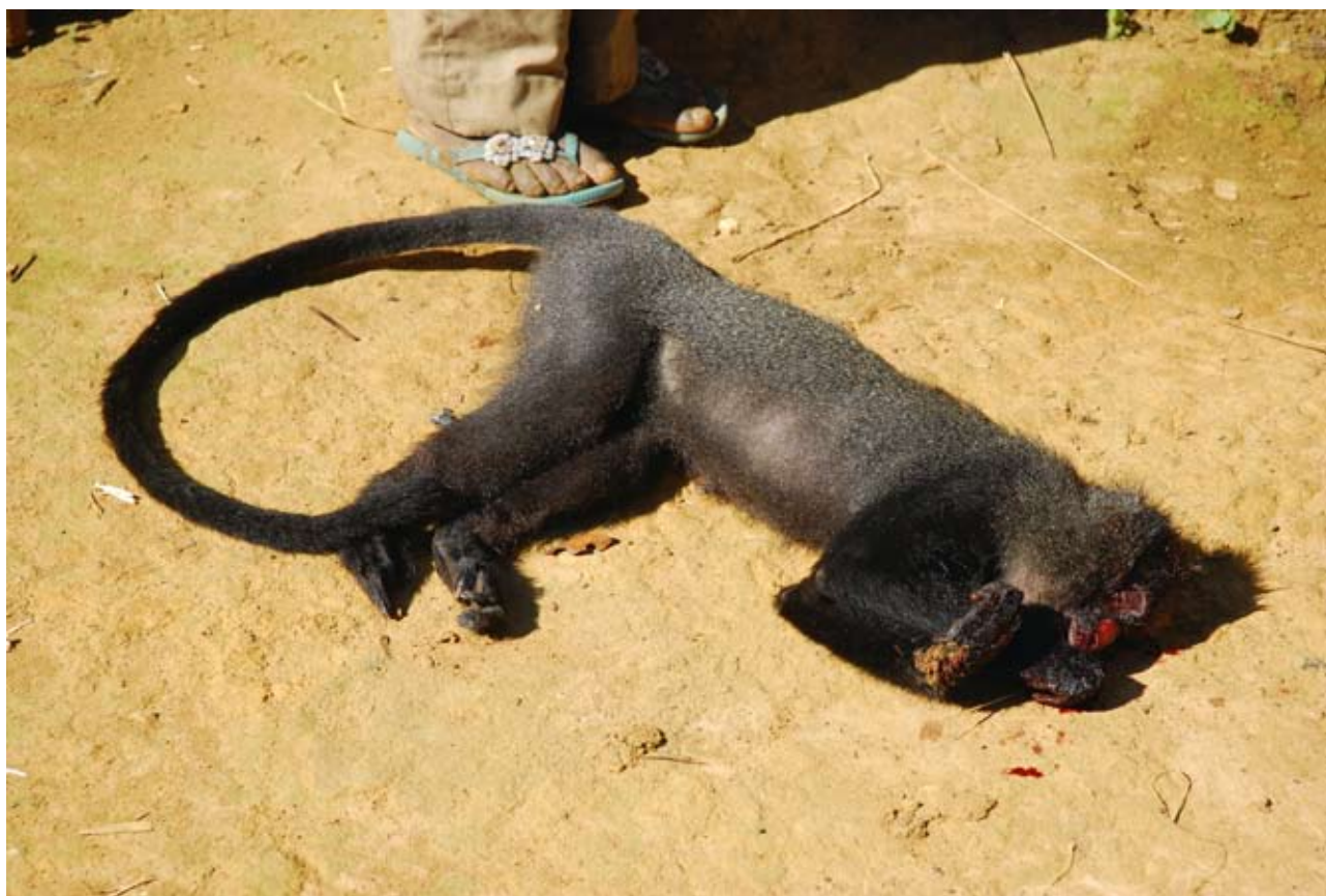
Exploiter du bois ou braconner? Les alternatives sont peu nombreuses pour scolariser les enfants.

du domaine forestier rural. Il est important de prendre des décisions dans un futur très proche. Légaliser et réguler l'exploitation communautaire de la forêt devraient permettre aux populations de gérer leurs propres ressources à travers une démarche raisonnée et intégrée. Les communautés contribueront ainsi, à une échelle locale, à la gestion durable des ressources forestières.