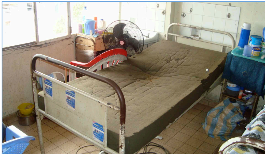
Unité d'hospitalisation en chirurgie des CUK, exemple des conditions d'hospitalisation

Mme Denise Sakombi a pu être confrontée aux problèmes des salles d'hospitalisation, de leur manque de moyens ainsi que des difficultés rencontrées par les infirmières responsables des soins postopératoires.