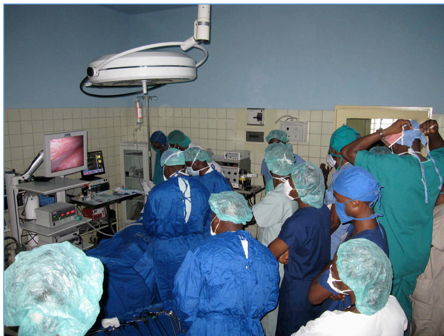
Intervention laparoscopique réalisée en novembre 2010 par l'équipe des CUK