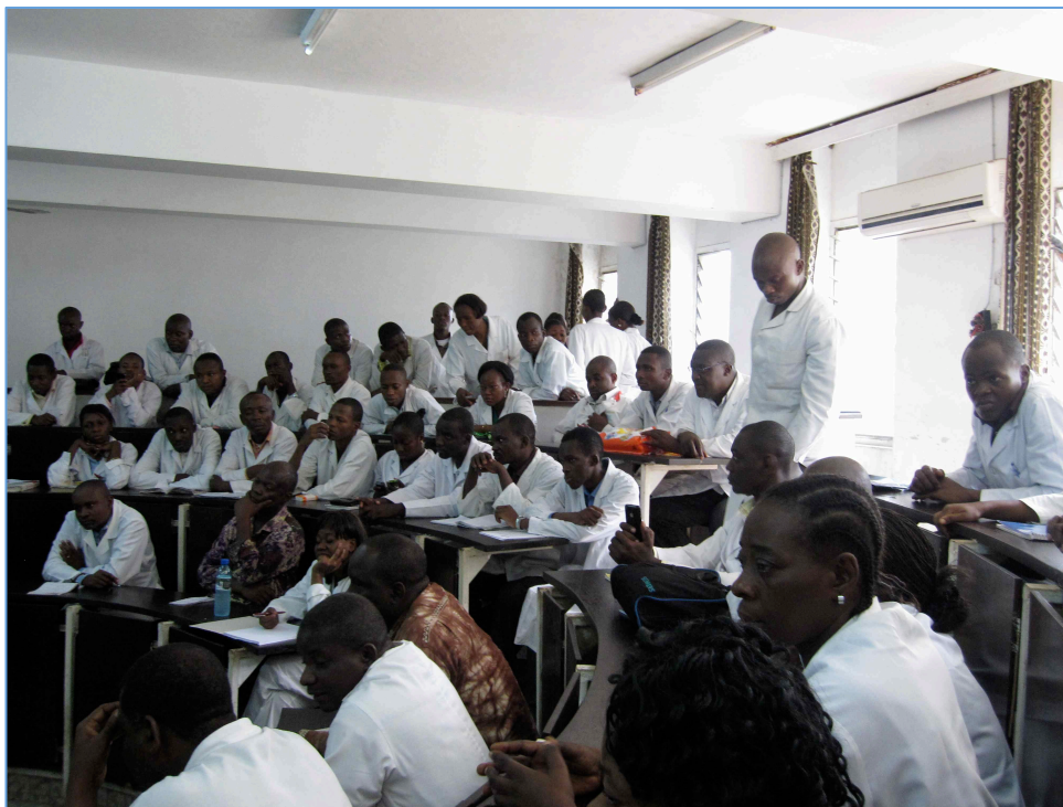
Assistance à une des présentations dispensées lors du séjour de juin 2010

Monitoring de l'anesthésie générale Dr Kaba