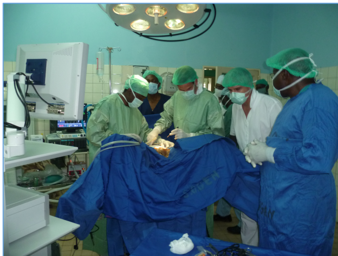
Intervention de cure de cystocoele laparoscopique réalisée par le Dr Vian et Nsadi le 7/10/2010

En plus de ces résultats cliniques spécifiques, l'activité de laparoscopie développée par ce projet a permis des interventions urologiques laparoscopiques par une équipe d'urologues français, mené par le Dr E. Vian, lors d'un séjour en octobre 2010. Ces médecins se sont déclarés surpris et enchantés de la qualité du matériel et de sa maintenance.