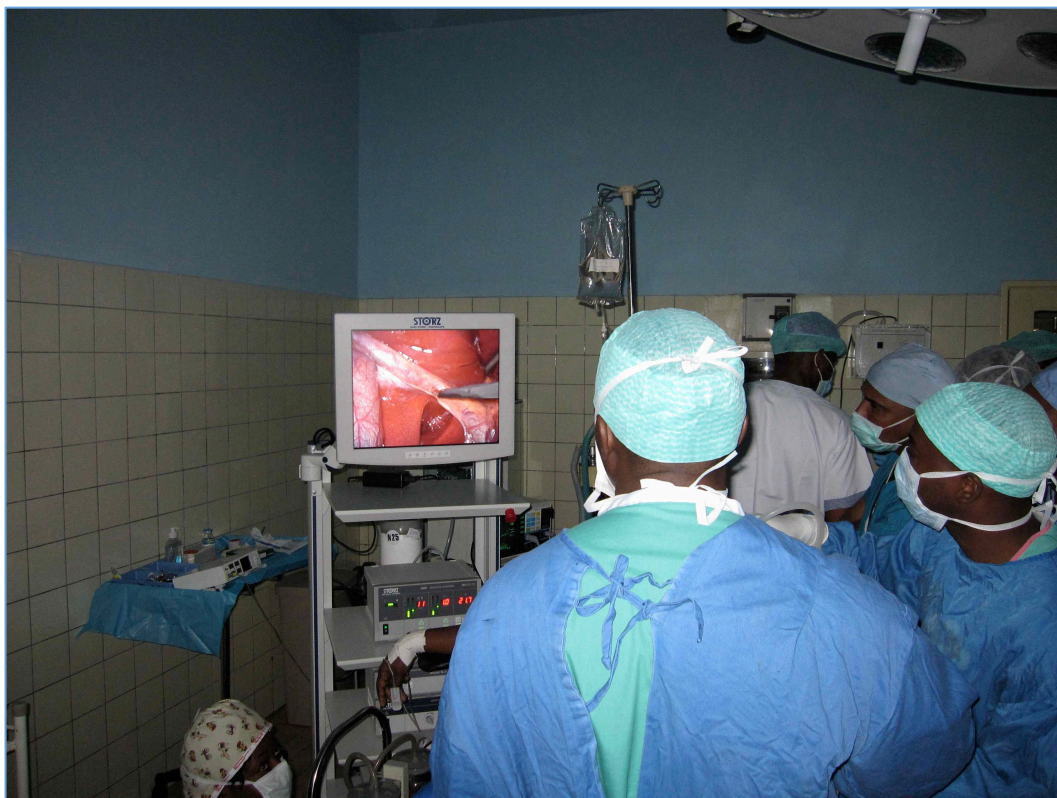
Intervention de cholécystectomie réalisée par l'équipe CUK en juin 2010