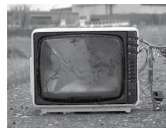
L'information a toujours été un outil de contrôle, une marchandise et un instrument de pouvoir

L'information — ce lubrifiant du capital, selon le mot de Marx — a toujours été sous contrôle et a toujours été une marchandise autant qu'un instrument de pouvoir. Dans nos démocraties libérales, ce contrôle paraît moins politique désormais qu'économique, encore que la disjonction de fait entre économie et politique soit elle-même une construction politique et sociale très discutable. Le fait que la grande presse soit, notamment et par excellence en France, imbriquée dans de grands groupes industriels ne fait pas seulement d'elle une industrie visant au profit. Cette imbrication produit aussi des effets politiques et contribue à l'imposition générale, et d'abord auprès des éditorialistes vedettes, d'un sens politique commun acquis aux vertus du libre échange et de l'utilitarisme. Rien en effet de plus efficace dans l'imposition d'une pensée de marché qu'une presse de marché. Le cas français montre presque caricaturalement aujourd'hui que ce mécanisme propice à des effets d'inculcation idéologique générale est comme redoublé, à