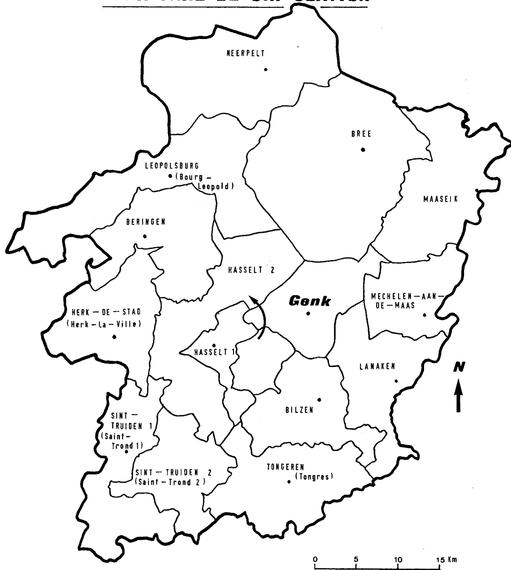
FIG. 2. — Circonscriptions limbourgeoises chargées de la taxe de circulation.