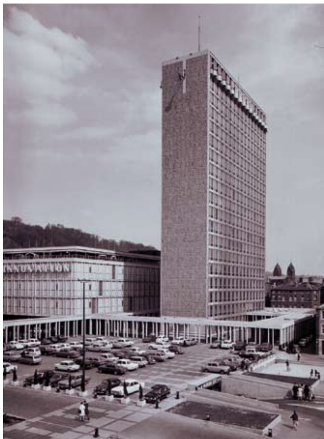
Photo 4 : Pignon sud-ouest et esplanade de la Cité administrative, s.d.