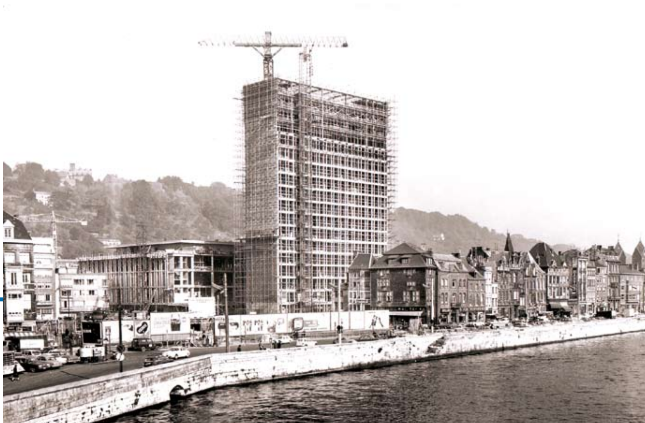
La Cité administrative en construction, s.d., © Centre d'Archives et de Documentation de la C.R.M.S.F., Liège – Fonds de la Ville de Liège.