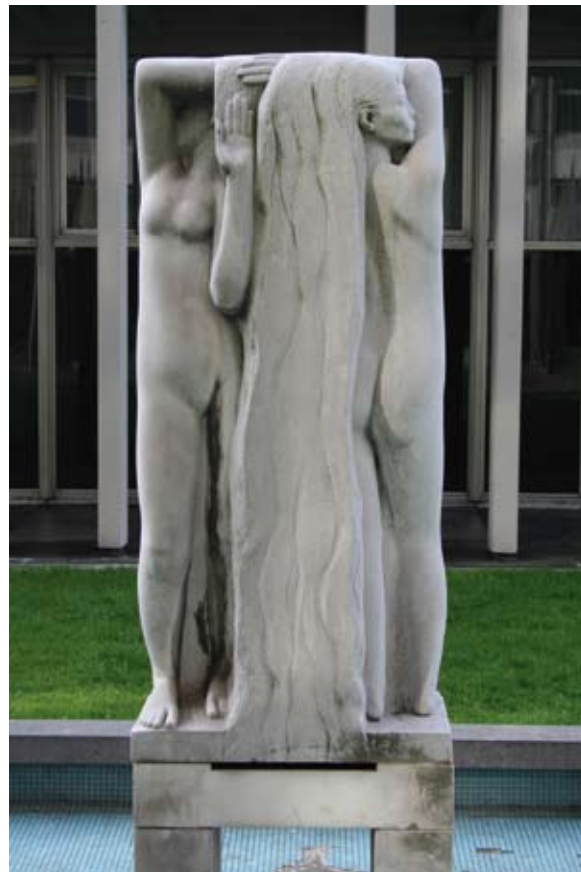
Idel Ianchelevici, Confluence , 1967, © Sébastien Charlier.

le premier étage. Le confort des employés constitue, à l'époque, une préoccupation majeure dans l'organisation des espaces. Ce sont près de 11000 mètres carrés de bureaux avec une vue exceptionnelle sur les méandres de la Meuse et les coteaux de la citadelle qui sont offerts aux fonctionnaires communaux. Au deux derniers étages, un mess, une cafétéria et de vastes locaux de réception servaient de lieux de détente et de repos. Le dernier étage est entouré de balconnets de plan triangulaire permettant aux fonctionnaires de s'aérer à près de 70 mètres de haut.