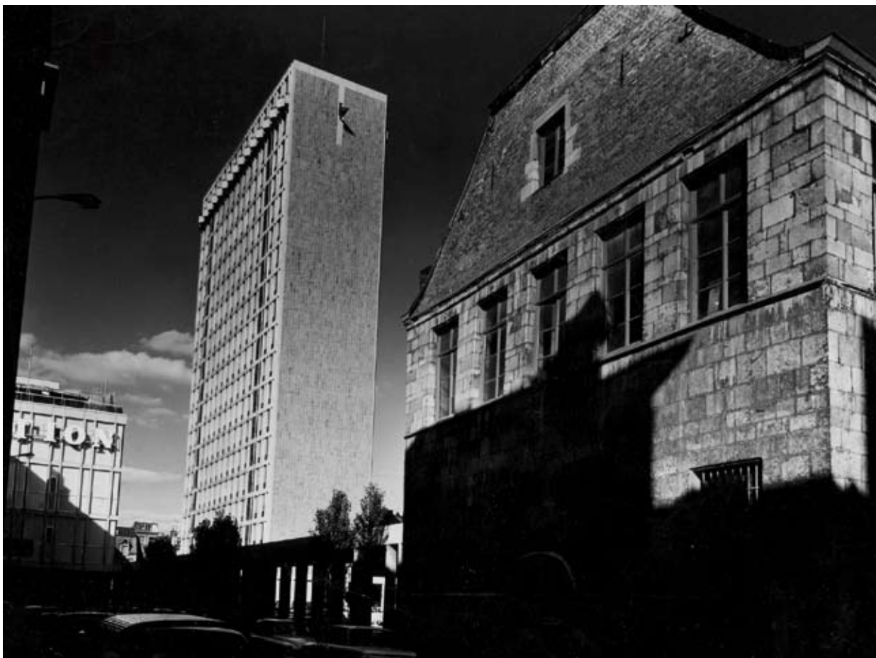
La Cité administrative et la halle aux viandes, s.d.