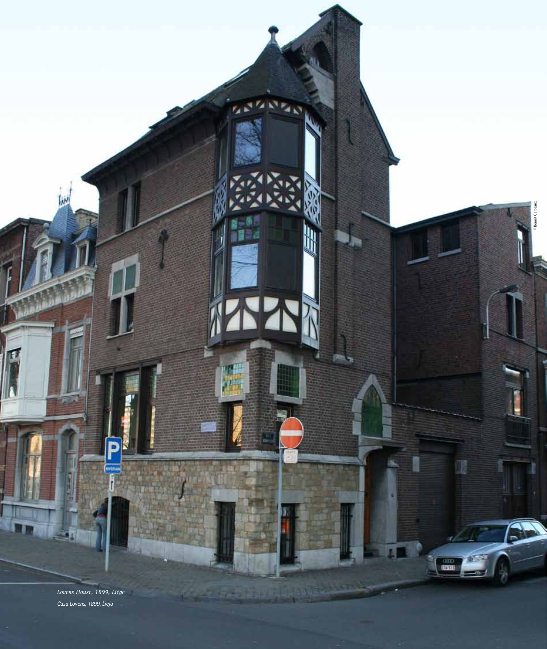
Lovens House, 1899, Liège Casa Lovens, 1899, Lieja