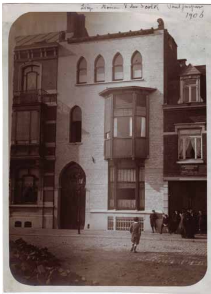
Van der Schrick House, 1906, Liège. Period photograph Casa Van der Schrick, 1906, Lieja. Fotografia d'època