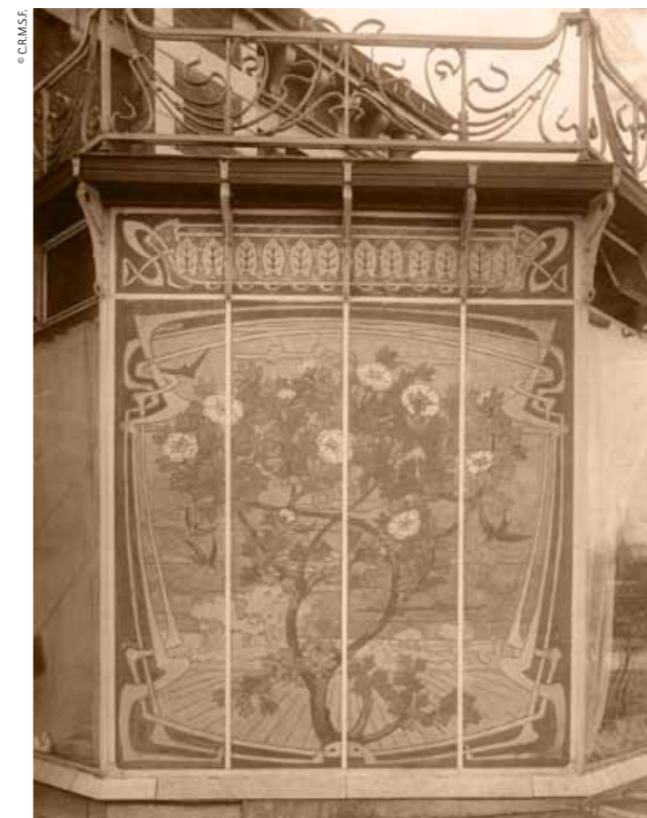
Paul and Émile Jaspar. Société la Métallurgique, Prayon. Detail of the greenhouse. Liège

Back in Liège, Jaspar created some of the most beautiful Art Nouveau houses. Starting in 1902, he designed the Janssens-Lycops and Van der Schrick houses. The arrangement of space and the use of glass partition walls show how the architect approached the issue of natural light in internal spaces. On a formal level, the façades were a first in Liège, tending to a reduction in forms. Jaspar dropped regionalist precepts and chose to use materials hitherto little used in Liège, like glazed brick. The employment of less decorative sculpture and elimination of the moulding lend the whole a highly modern air. Structurally, the buildings hold further surprises. The floors of the top storey and roof terrace are made of reinforced concrete, a material little used in private houses in early 20th-century Liège.