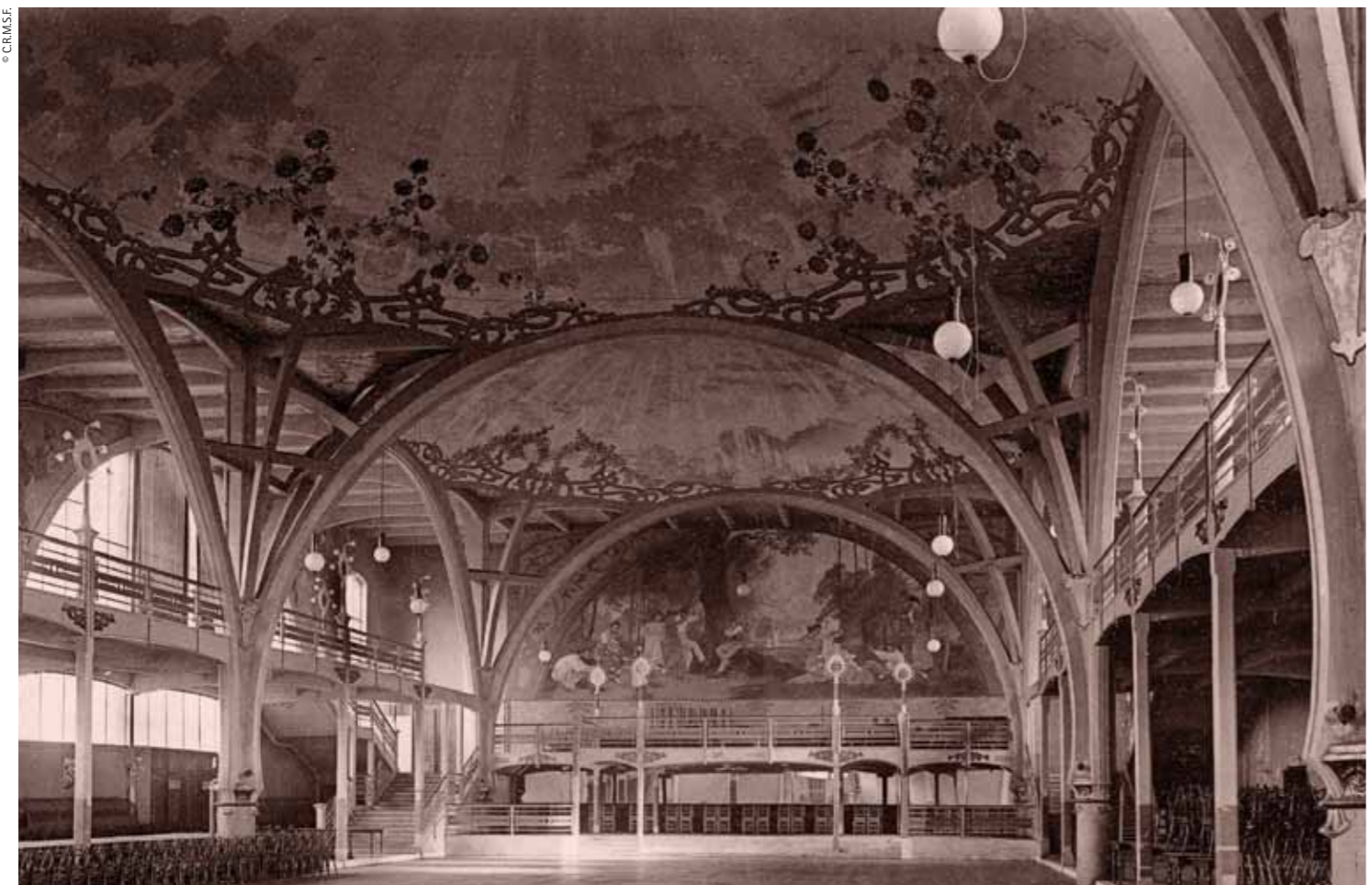
Paul Jaspar, La Renommée hall, Liège. Photograph from the magazine L'Émulation, 1906 / Paul Jaspar, La Renommée, Lieja. Imatge de l'interior, extreta de la revista L'Émulation, 1906

This predilection for using modern materials finds further expression in one of Jaspar's masterpieces, the Renommée theatre and dance hall. Built in 1903, the Renommée was raised on the ashes of another building destroyed by fire. Jaspar probably chose to build it entirely of cement to make it fireproof. The building has three parts: the dance hall, theatre and foyer. It is the dance hall that most inspires admiration. Enormous bay windows allow natural light into the hall, which is crowned by three monumental