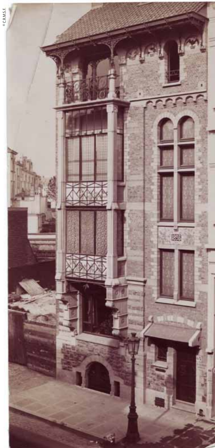
Paul Hankar, 1893. The architect's own home, Brussels Paul Hankar, 1893. Hôtel Hankar, Brussel-les