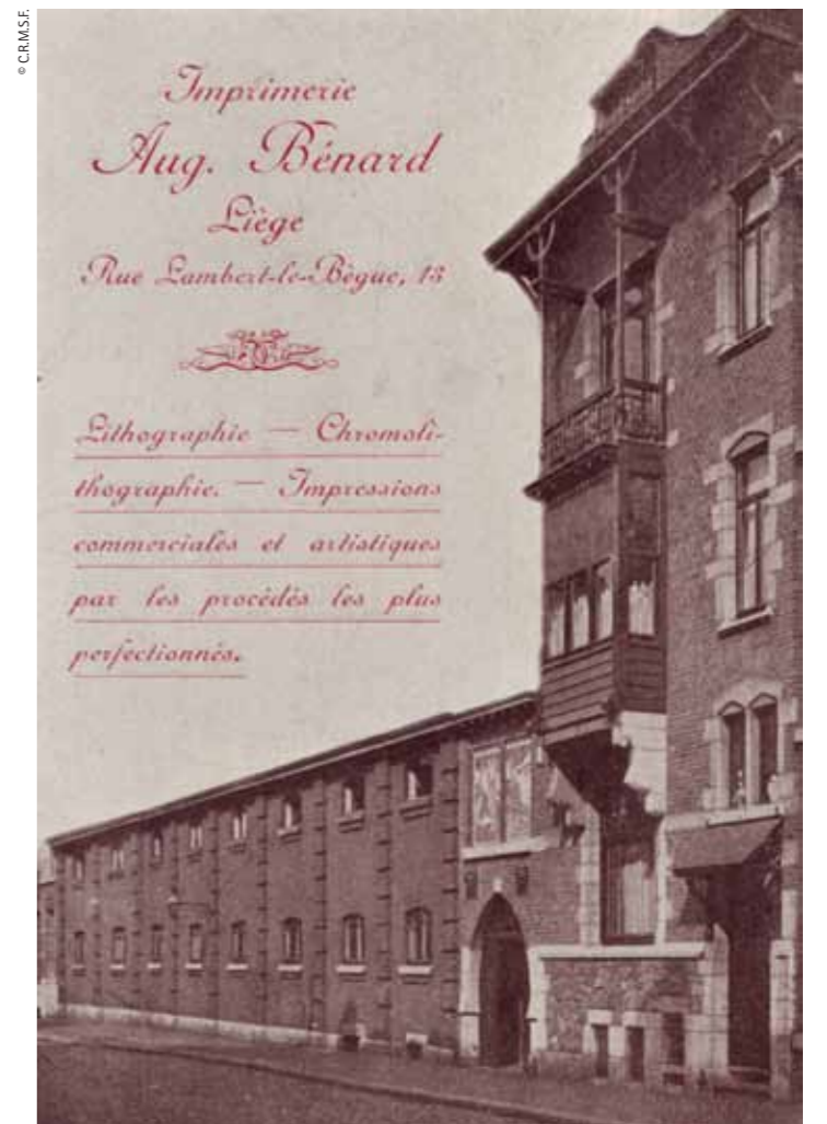
Print shop of A. Bénard, 1895, Liège Imprenta d'Aug. Bénard, 1895, Lieja