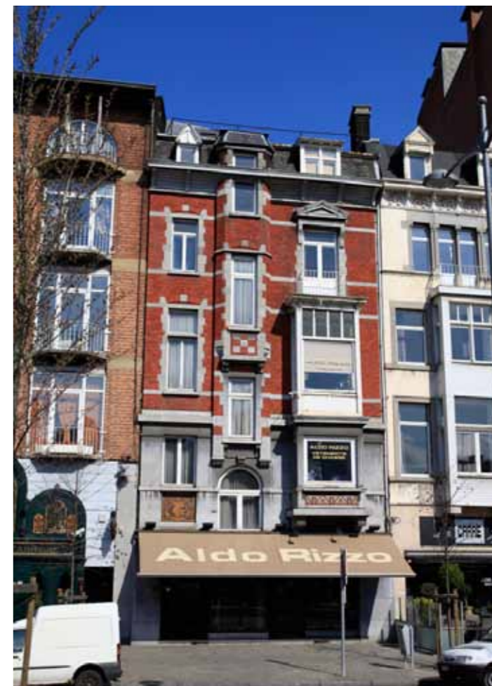
Jaspar House, 1889, Liège Casa Jaspar, 1889, Lieja