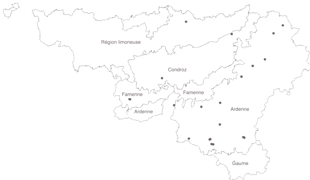
Figure 1. Localisation géographique des peuplements d'aune glutineux étudiés — Geographical location of black alder stands.

lors d'études similaires réalisées pour une douzaine d'essences feuillues et résineuses (Palm, 1981 ; Palm, 1982 ; Dagnelie et al. , 1985).