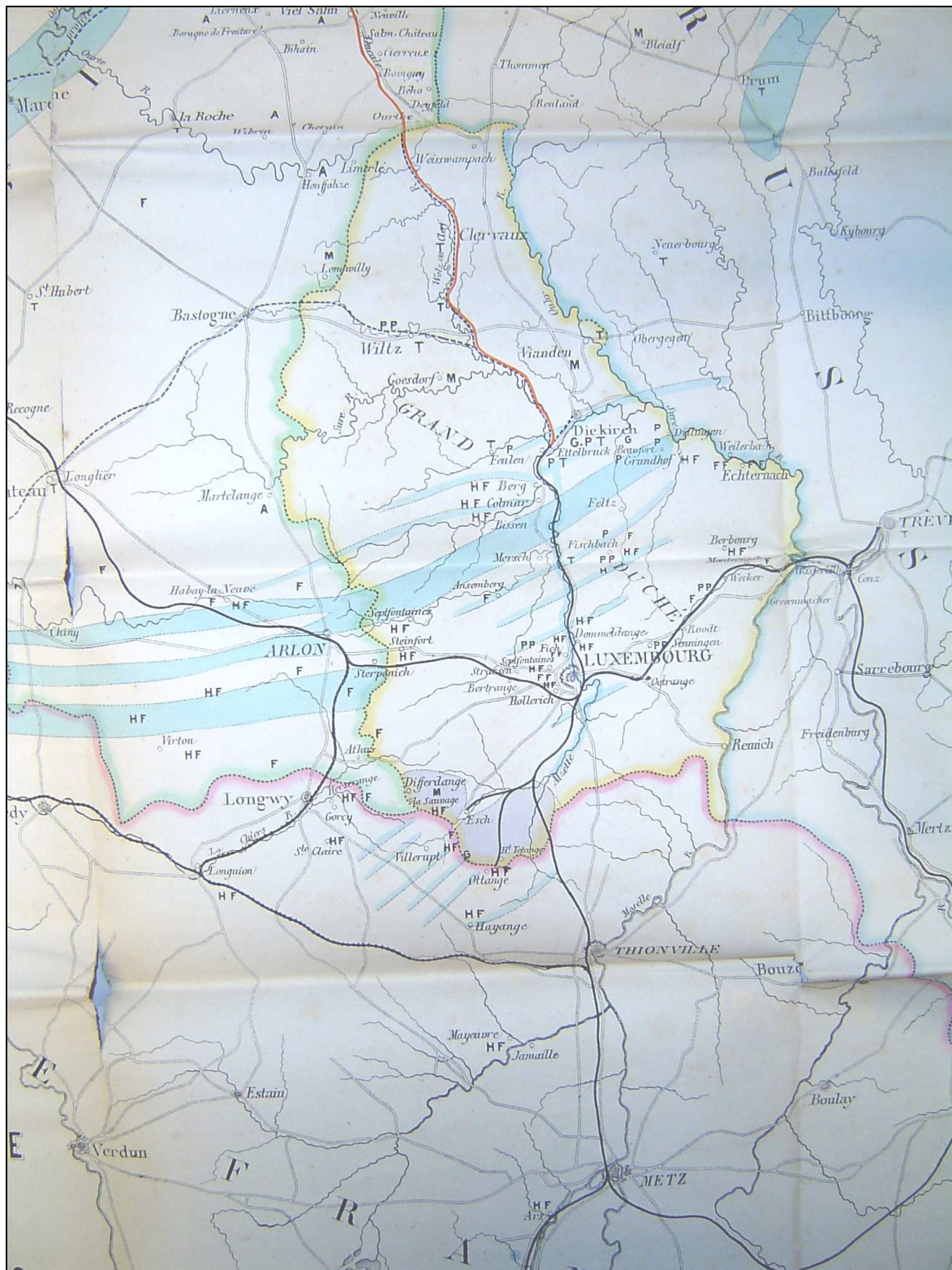
Extrait de la Carte du Grand-Duché de Luxembourg avec l'indication des principales usines . - Bruxelles, Etablissement géographique fondé par Ph. Vandermaelen, 1862, routes, chemins de fer, usines.