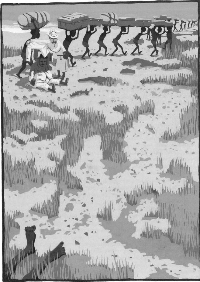
« ...une excursion de deux cents milles. Inutile de vous en dire long là-dessus. »