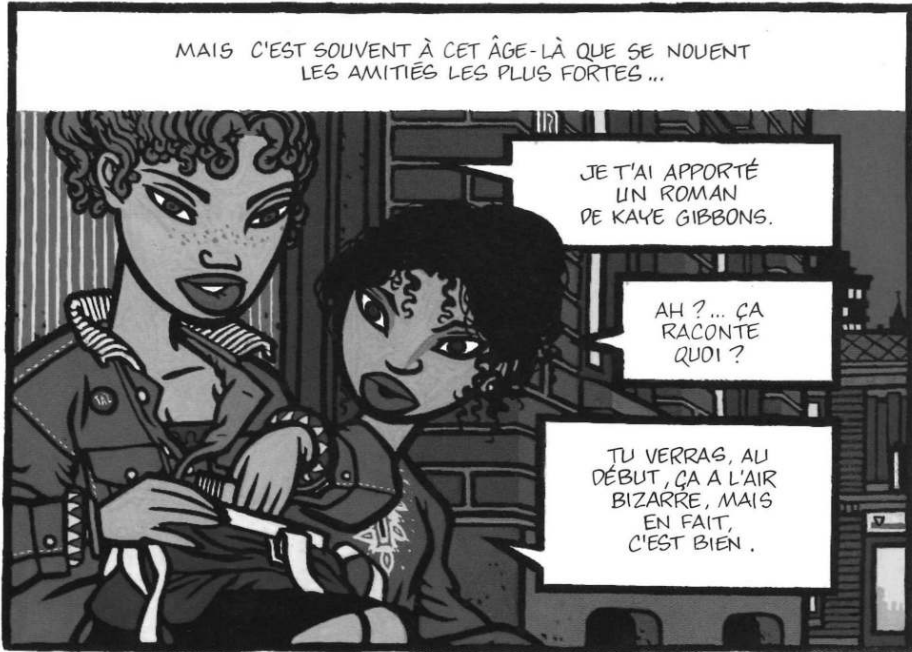
STASSEN (Jean-Philippe) et Lapière (Denis), Le Bar du vieux Français , édition intégrale, Marcinelle, Dupuis, 1999, p. 21

Ajoutons la présence, dans un coin de la première case de Louis le Portugais (la première bédé scénarisée par Stassen lui-même), d'une édition des Poésies de Rimbaud. De façon significative, cette case initiale est reproduite en quatrième de couverture.