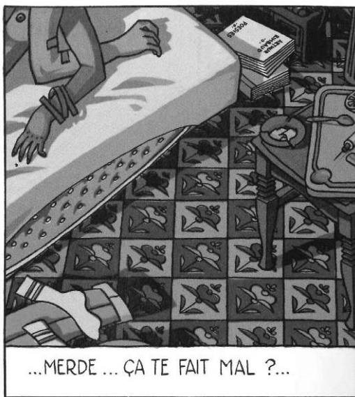
STASSEN (Jean-Philippe), Louis le Portugais , Marcinelle, Dupuis, coll. Aire Libre, 1996, p. 5 © Stassen – Dupuis

Dans les bédés de Stassen, il arrive que la littérature occupe une petite place. Ainsi, dans Le Bar du vieux Français , un personnage secondaire apporte à Leila, l'héroïne, un roman de Kaye Gibbons 4 , qui jouera un rôle plus tard dans le récit : Leila en apprendra des passages par cœur 5 puis, en manque de papier, écrira dedans 6 . Plus loin, on voit Leila, entourée de bouquins : on distingue un volume de la Pléiade (serait-ce Proust ?), un autre de Poésie/Gallimard, un troisième estampillé NRF, collection « Du Monde entier » 7 . En outre, dans le texte introductif qui ouvre la réédition en un tome de 1999, un dessin au lavis de Stassen illustre un vers de Cendrars : « Bon voyage ! Que je t'emporte, toi qui ris du vermillon. » 8