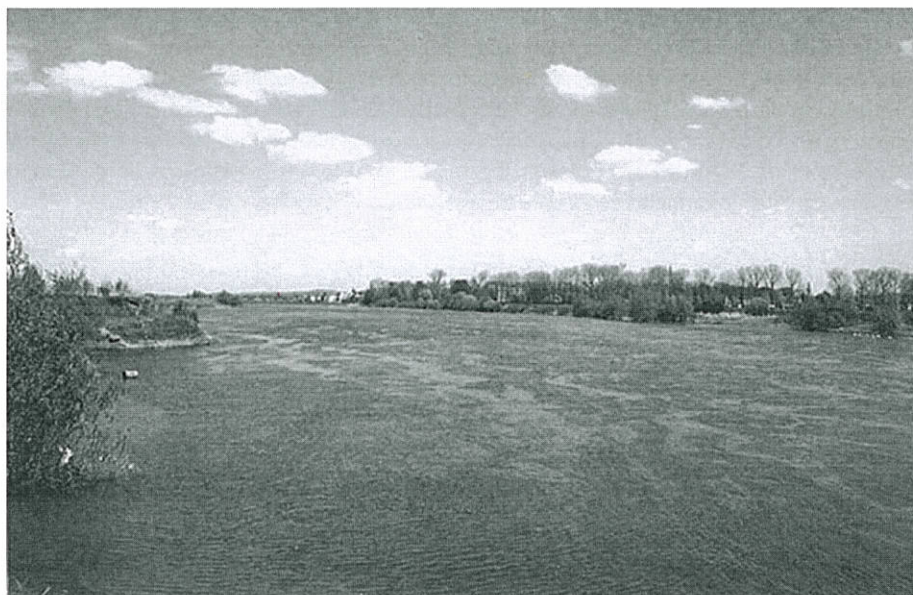
Photo 1 : la Meuse en amont de Liège (Belgique) The river Meuse before Liège (Belgium)

Ces déplacements amènent inéluctablement ces poissons au pied de barrages qu'ils franchissent en empruntant les échelles à poissons. En baissant le niveau d'eau dans ces ouvrages, on peut y observer de nombreuses espèces comme ce gros brochet ou ce groupe de brèmes, piégés par la baisse de niveau. On y observe aussi des migrateurs au long cours comme ces anguilles, nées dans l'océan. C'est l'occasion de vérifier l'état des populations par des contrôles scientifiques. Les mensurations effectuées sur les poissons révèlent que les plus nombreux sont âgés de trois à quatre ans, comme ce jeune individu manipulé sous anesthésie par le Docteur Philippart. Ils viennent rejoindre leurs aînés, remontés quelques années auparavant. Cette grosse anguille, d'environ 45 centimètres est probablement une femelle car les mâles, de plus petite taille, restent préférentiellement dans les estuaires. Après dix à quinze années passées en rivière, les individus adultes, comme cette grosse femelle de 80 centimètres, vont retourner vers la mer pour s'y reproduire.