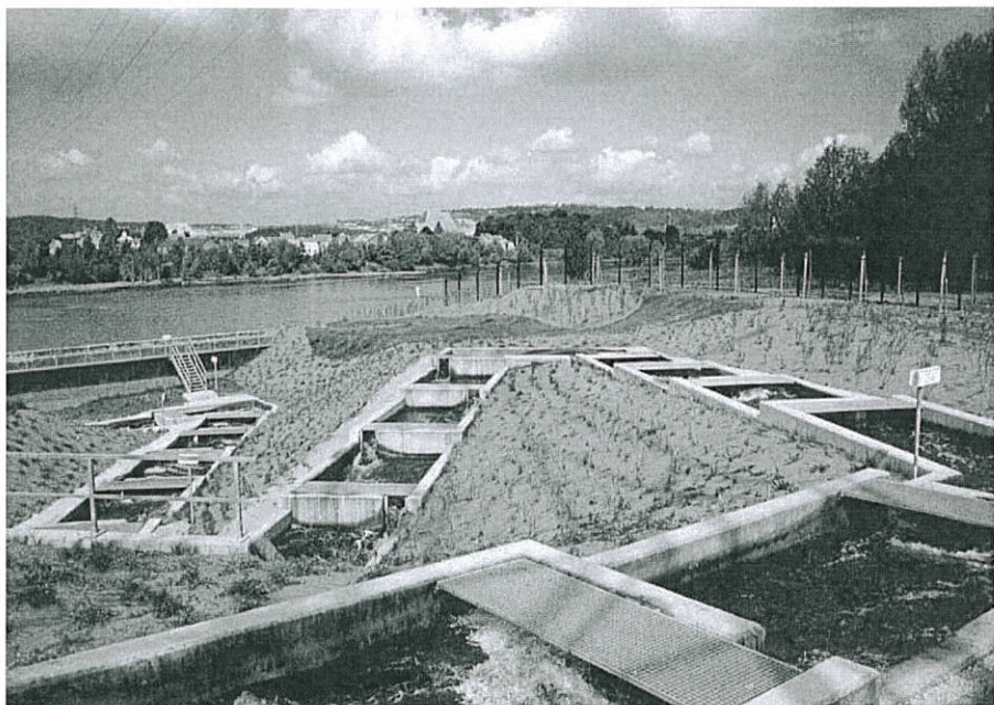
Photo 4 : vue de la récente échelle à poissons migrateurs de Lixhe-Visé View of the new migratory fish pass in Lixhe-Visé

Il s'agit d'une véritable petite rivière contournant un barrage imposant. Pour contourner le barrage de Lixhe-Visé, haut de 8 mètres, une nouvelle échelle à poissons a été construite en 1998 par le Ministère wallon de l'Équipement et des Transports (photo 4). Son débit est de 4 à 5 m 3 d'eau par seconde et elle comprend 26 bassins répartis sur 305 mètres. Des passes à poissons ont aussi été construites par la Région Wallonne, Division de l'Eau, sur les petits barrages des affluents de la Meuse, comme ici à Berneau sur la Berwinne, premier affluent du fleuve en Wallonie. Celle-ci est équipée d'un système de capture permettant le contrôle scientifique des remontées de poissons et spécialement des saumons et des truites de mer.