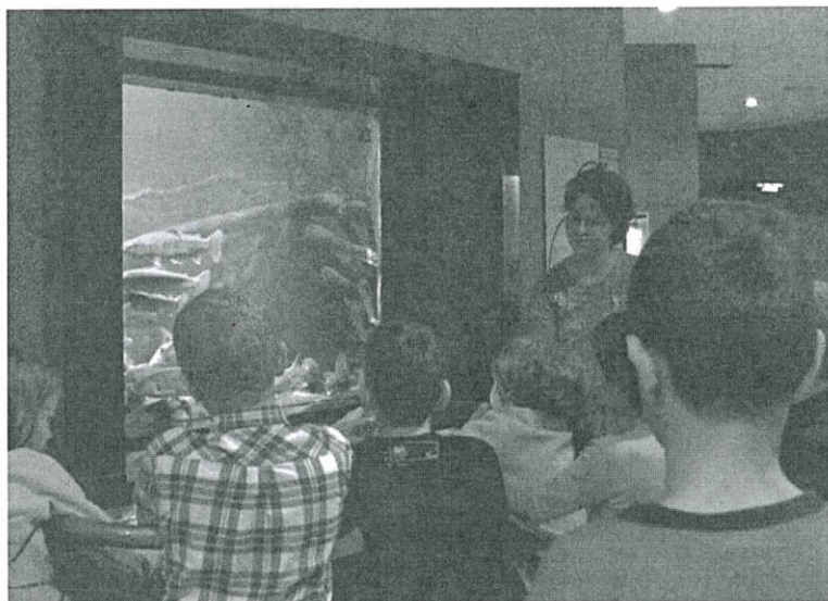
Aquarium de l'Université de Liège Aquarium of The University of Liège