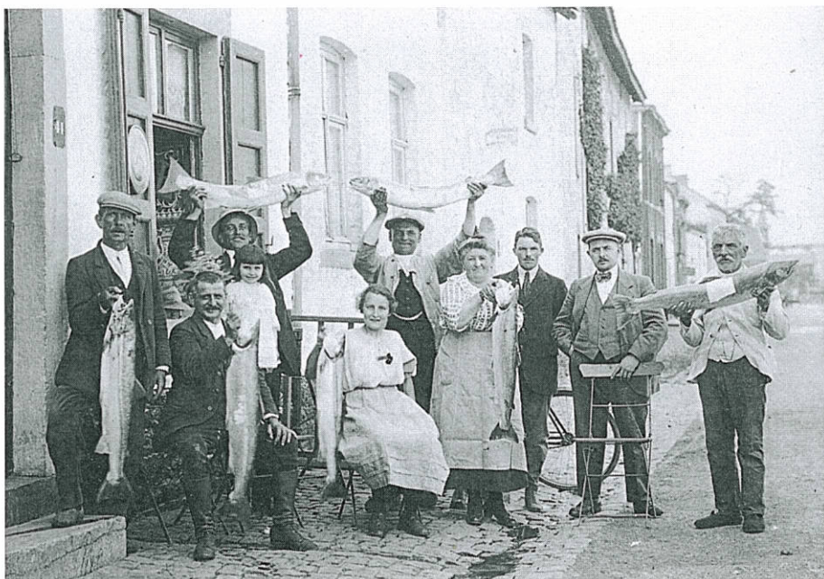
Photo 2 : quelques pêcheurs exhibent avec fierté leur prise de saumons en 1908 à Visé Some fishermen proudly exhibiting their catch of salmon in 1908 in Visé

occidentale. Son abondance était légendaire ainsi qu'en témoignent ces clichés de belles captures dans la Meuse à Visé ( photo 2 ). La pêche à la ligne était très pratiquée ainsi que la pêche commerciale en bateau et au filet. Les saumons étaient capturés au moment de la remontée de la mer vers les frayères. Des documents plus anciens attestent de l'importance de la pêche au saumon dans les nombreux bras de la Meuse liégeoise et de l'Ourthe. Ce poisson légendaire se retrouve encore sur de nombreux blasons, en particulier celui de la ville de Vielsalm.