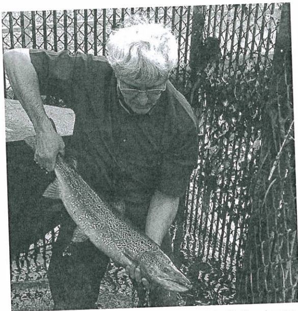
Photo 3 : saumon adulte d'origine belge capturé dans l'échelle à poissons de Lixhe-Visé One of the adult salmon caught in the fish pass of Lixhe-Visé

En janvier 2003, deux saumons mâles sont capturés cette fois dans le piège de la nouvelle échelle à poissons du barrage de Berneau, sur la basse Berwinne. La capture de ces 15 saumons adultes établit de manière indiscutable le retour assisté du saumon dans la Meuse liégeoise, à plus de 300 km de la mer et 70 ans après son extinction.