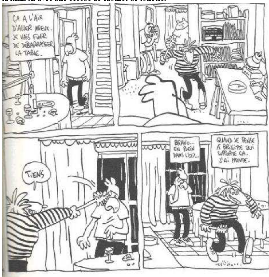
6 – Lewis Trondheim, Approximativement , Paris, Éditions Cornélius, 2004, p. 71

26 Une scène importante du livre évoque une réunion de L'Association, la maison d'édition fondée par Trondheim et cinq autres auteurs pour publier sans souci de rentabilité immédiate 24 . Lors de cette réunion, Jean-Christophe Menu boit beaucoup et, sous l'effet de l'alcool, va jusqu'à poursuivre les participants dans toute la maison avec une brosse de cabinet de toilette.