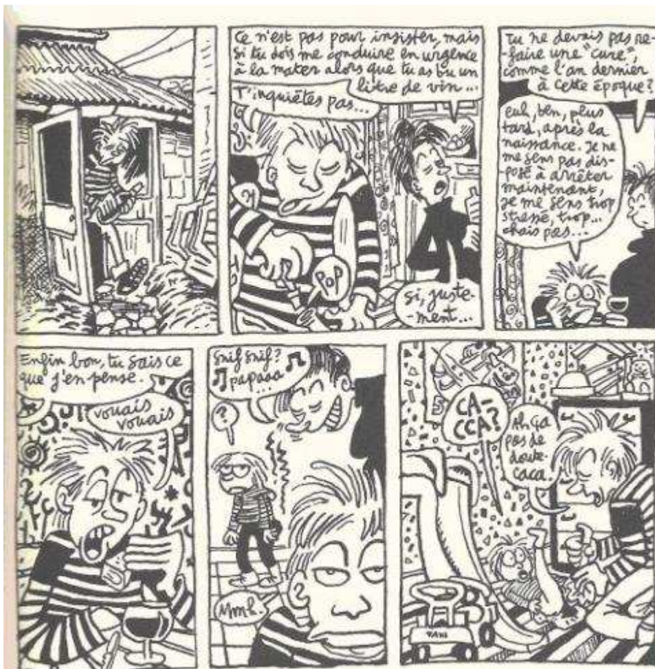
4 – Jean-Christophe Menu, « Agglutinines irrégulières », Livret de Phamille , Paris, L'Association, 2003, s. p.