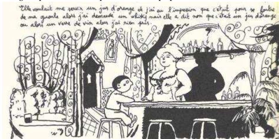
2 – Joann Sfar, Pascin , Paris, L'Association, 2005, p. 90