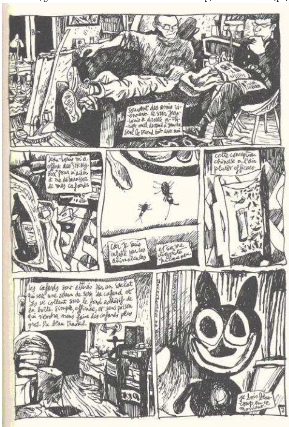
5 – Jean-Christophe Menu, « Mélo Mimolette blues », Livret de Phamille , Paris, L'Association, 2003, p. 7

medium lui-même, car les bandes dessinées ne sont finalement, pour leurs détracteurs, que des « petits mickeys ». Elle est commentée par une remarque désabusée, griffonnée en bas de case : « Je bois beaucoup, en ce moment » (p. 7).