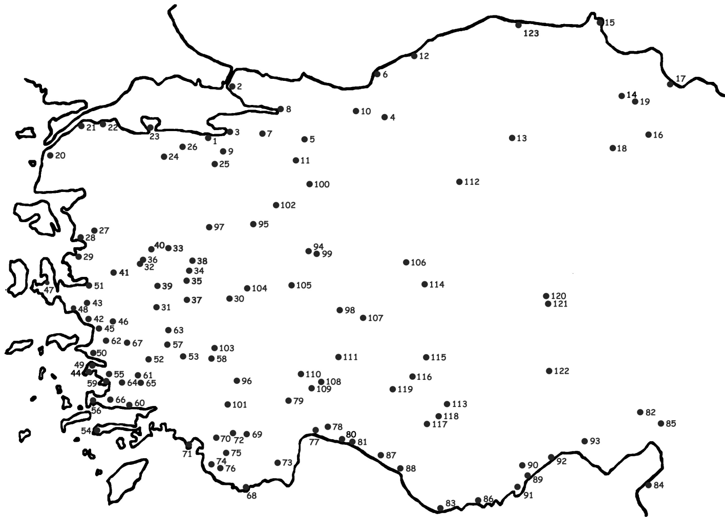
Carte 3. Carte de l'Asie Mineure : les cités en rapport avec des médecins.