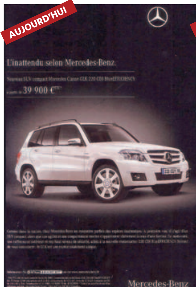
LA PUB AUJOURD'HUI ET DEMAIN ? En vertu de la nouvelle loi. Les mentions occupent un cinquième de l'espace.