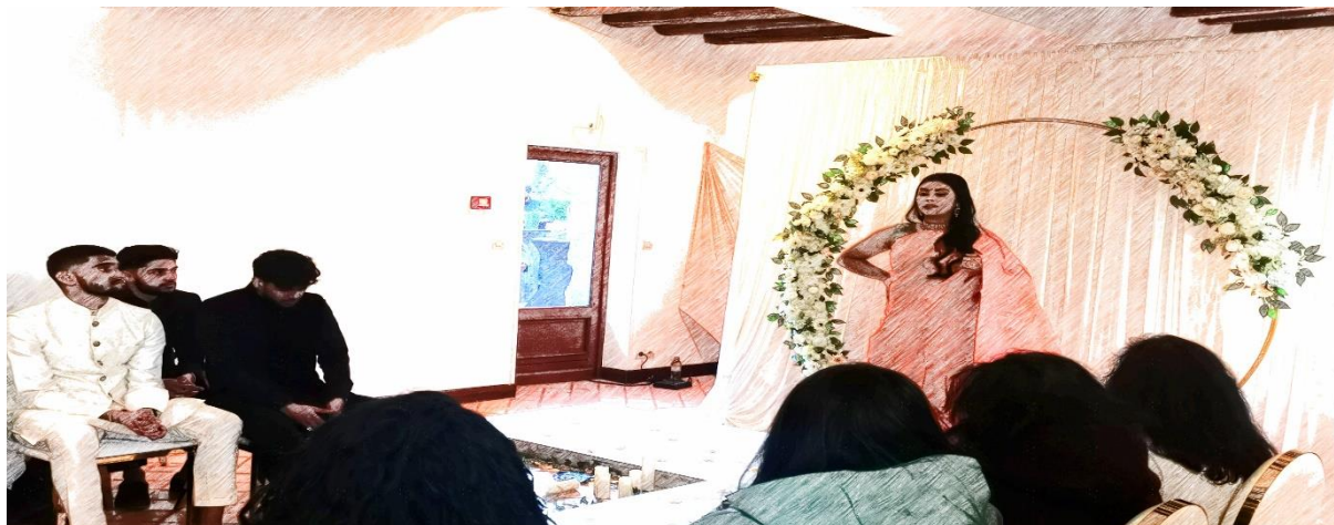
Figure 1 Salle du défilé. Photo avec effet dessin prise lors du salon du mariage le 26 février 2022.

de personne, principalement de jeunes tamouls (moins de 30 ans), et le choix du mariage en guise de thème, nous le verrons, n'est pas anodin.