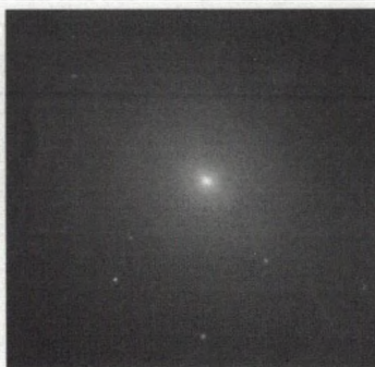
Ground View of Galaxy