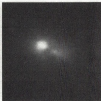
Ground View of Galaxy Core