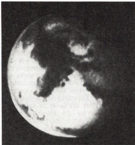
Mars, fin 1990, par le HST. Cliché composite en rouge, vert et bleu.

Le HST (Hubble Space Telescope) a scruté Mars lui aussi, à la même époque. La résolution de ses clichés est très bonne, à peu près équivalente à celle obtenue au Pic. Pour arriver à ce résultat malgré les gros défauts du miroir, il faut de nombreuses heures de traitement sur ordinateur. Le HST a l'avantage de pouvoir travailler dans l'ultraviolet où les observateurs terrestres sont aveugles. Le cliché que nous présentons est la combinaison d'images obtenues dans les couleurs bleue, verte et rouge. La « péninsule » sombre qui se détache sur le fond plus clair est Syrtis Major. Cette structure n'est guère visible sur le cliché rouge correspondant pris au sol.