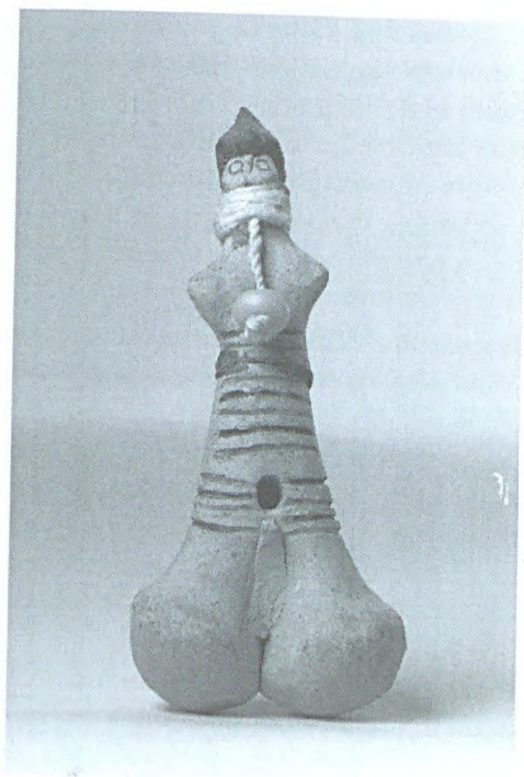
Figura 1. Ritzoko da coleção formada por Fritz Krause em 1908 (Sam 3183) em barro cru, com cabelo de cera, incisões, pinturas corporais e adornos em fios de algodão e miçanga (frente). Grassi Museum für Völkerkunde – Leipzig.

– transformar o patrimônio em herança para que esta contribua com a construção das identidades (Bruno, 2004). Porém, como a mesma autora salienta, é também pertinente contar com a reversibilidade desses olhares, ou seja, sua forma de pensar a Museologia pressupõe esta reflexividade que não admite caminhos singulares no tratamento do destino das coisas (Bruno, 2009). A Museologia contemporânea acolhe e realça a existência de muitas maneiras de lidar com o patrimônio musealizado, busca construir esses percursos de maneira colaborativa com as comunidades interessadas (notadamente as comunidades de origem) e