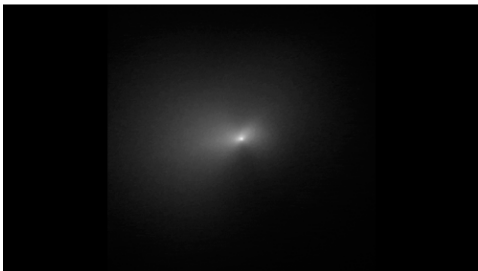
La rotation de la comète C/2020 F3 (NEOWISE) est mise en évidence sur ces images prises à trois heures d'intervalle, le 8 août 2020, par le télescope spatial Hubble. On y distingue deux jets émergeant du noyau.