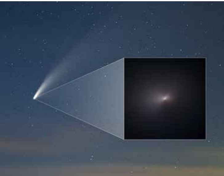
La comète C/2020 F3 (NEOWISE) photographiée depuis le sol le 16 juillet 2020. En médaillon, l'image prise par le télescope spatial Hubble le 8 août 2020 révèle un gros plan de la comète après son passage au périhélie. (NASA, ESA, STScI, Q. Zhang/Caltech ; Zoltan G. Levay).

Le cœur de la comète, son noyau glacé, est trop petit pour être vu par Hubble. La boule de glace ne doit pas dépasser 4,8 kilomètres de diamètre. La coma, ce vaste nuage de gaz et de poussière qui enveloppe le noyau, mesure environ 18 000 kilomètres de diamètre sur cette photo. Hubble résout une paire de jets du noyau qui s'élancent dans des directions opposées. Ils émergent du noyau sous la forme de cônes de poussière et de gaz, puis ils se courbent en éventail sous l'effet de la rotation du noyau. Les jets sont le résultat de la sublimation de la glace sous la surface, la poussière et le gaz qui en résultent étant expulsés à grande vitesse.