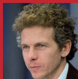
Gilles BABINET Digital Champion des enjeux de l'économie numérique, pour la France auprès de la Commission européenne