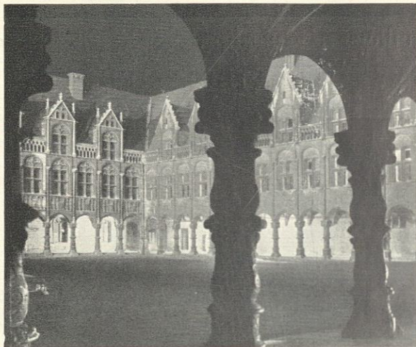
Première cour, état actuel.