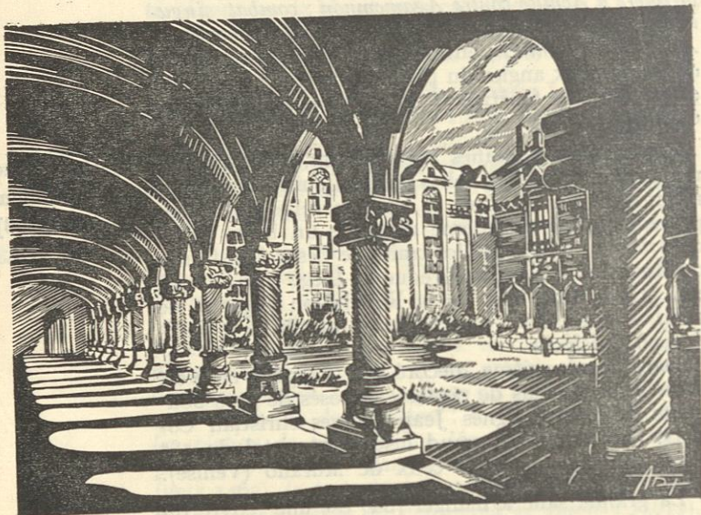
Seconde cour