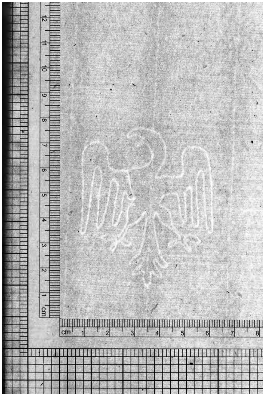
Tav. 2. CFG XIV, ins. 4, f. [21], dettaglio filigrana.