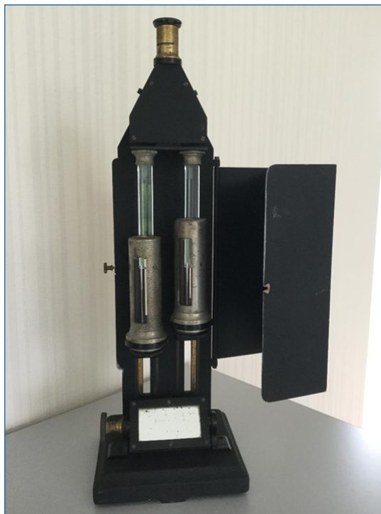
Figure 2 • Colorimètre de Dubosq (collection privée du Professeur Étienne Cavalier).

où : h(\text{étalon}) est la hauteur de la colonne de l'étalon, C(\text{étalon}) est la concentration connue de l'étalon, h(\text{échantillon}) est la hauteur ajustée de l'échantillon et C(\text{échantillon}) la concentration inconnue de l'échantillon.