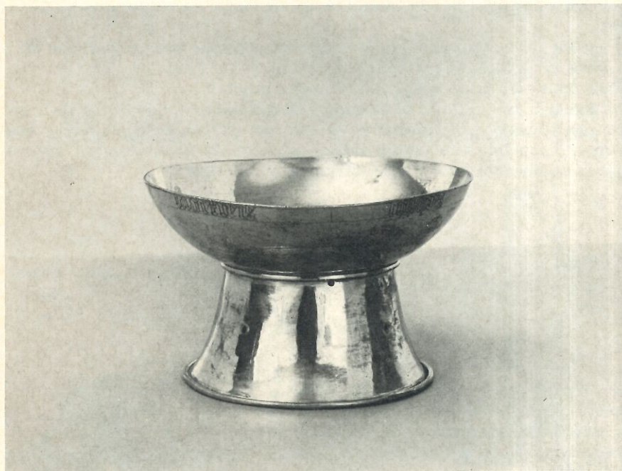
La coupe de saint Lambert.

L'abbaye de Muri (Argovie) conservait jadis la coupe de saint Ulrich et le monastère de Werden (près d'Essen), celle de saint Ludger. Parfois on y conservait des reliques.