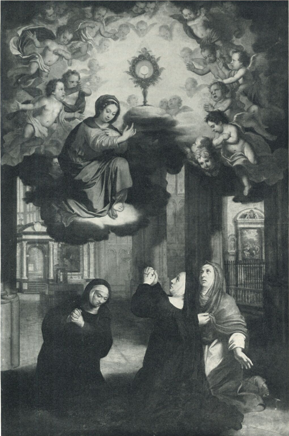
FIG. 1. — Fisen : Les trois saintes promotrices de la Fête-Dieu en extase dans la collégiale (1690). Liège, Église Saint-Martin.