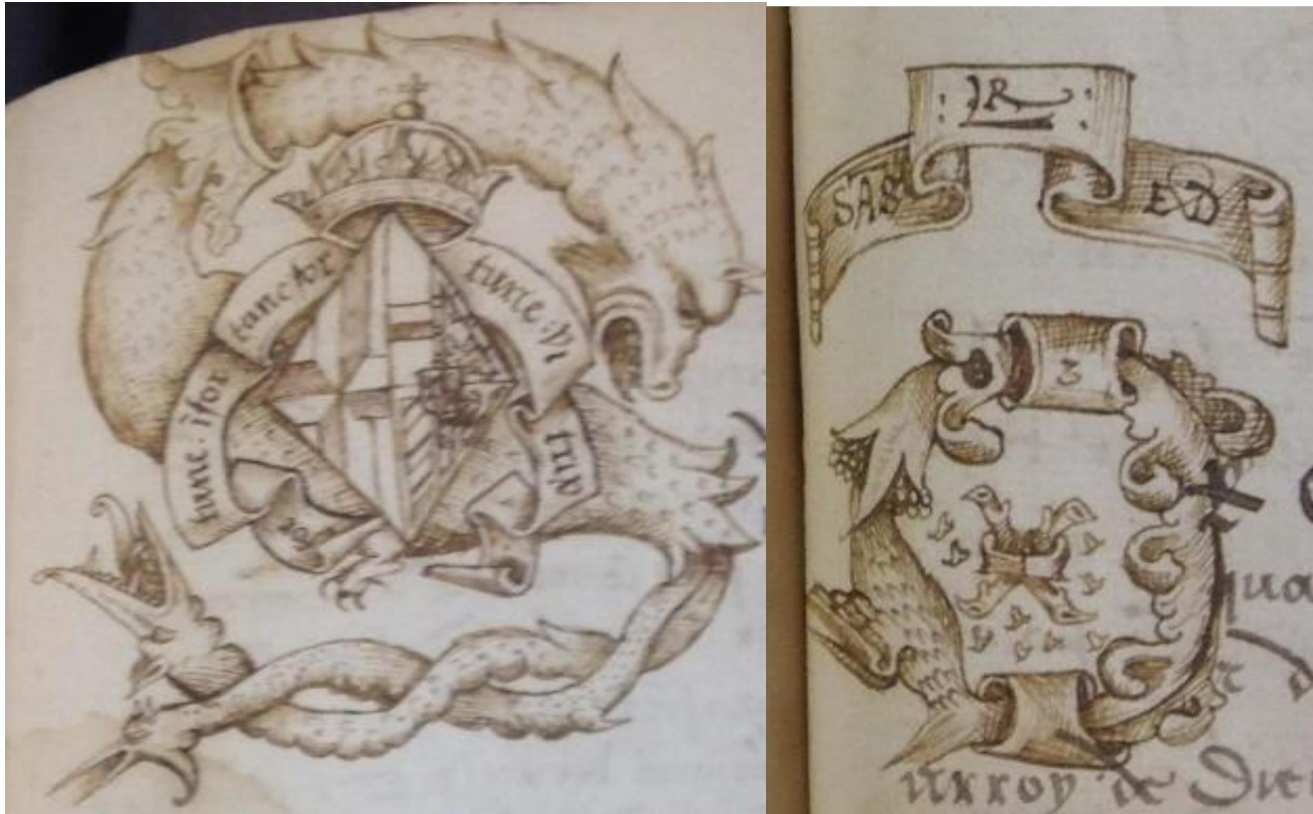
Brussels, KBR, MS 10487-90, ff. 53 r and 54 r (details)