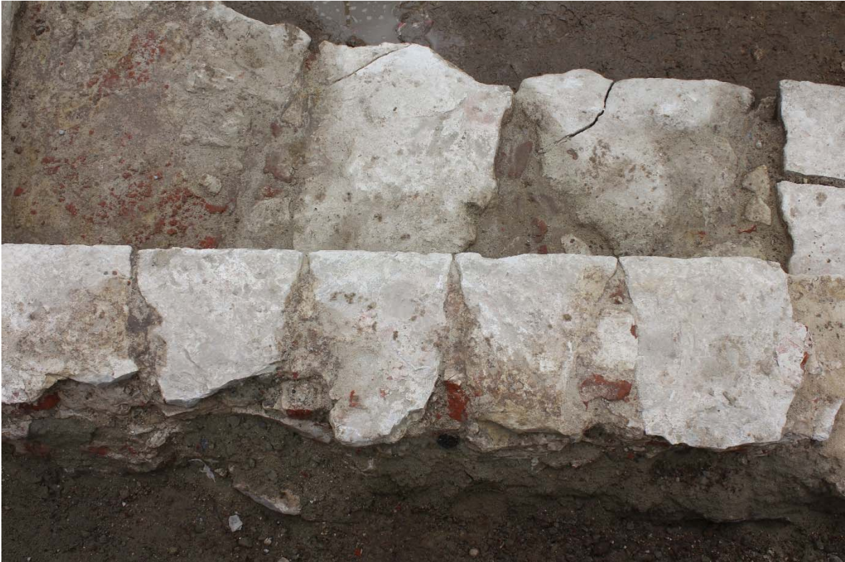
Fig. 9 : mur-gouttereau oriental de l'Aula Magna. Photo prise depuis la fourrure du mur (déblayée, en bas). On y aperçoit les queues démaigries des moellons à têtes dressées. Photo : A. Baudry, 23 mai 2024. © urban.brussels-ULiège.