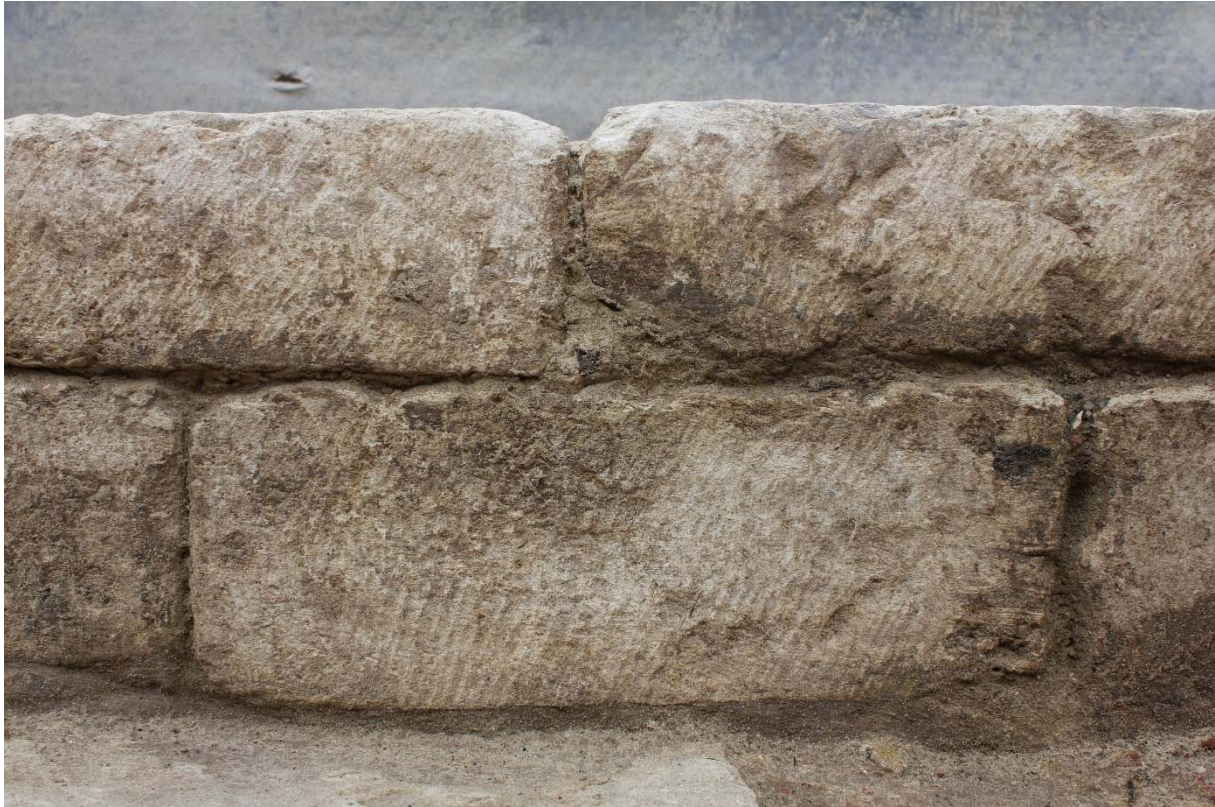
Fig. 7 : parement taillé au ciseau oblique, sans ciselure. Photo : A. Baudry, 23 mai 2024. © urban.brussels-ULiège.