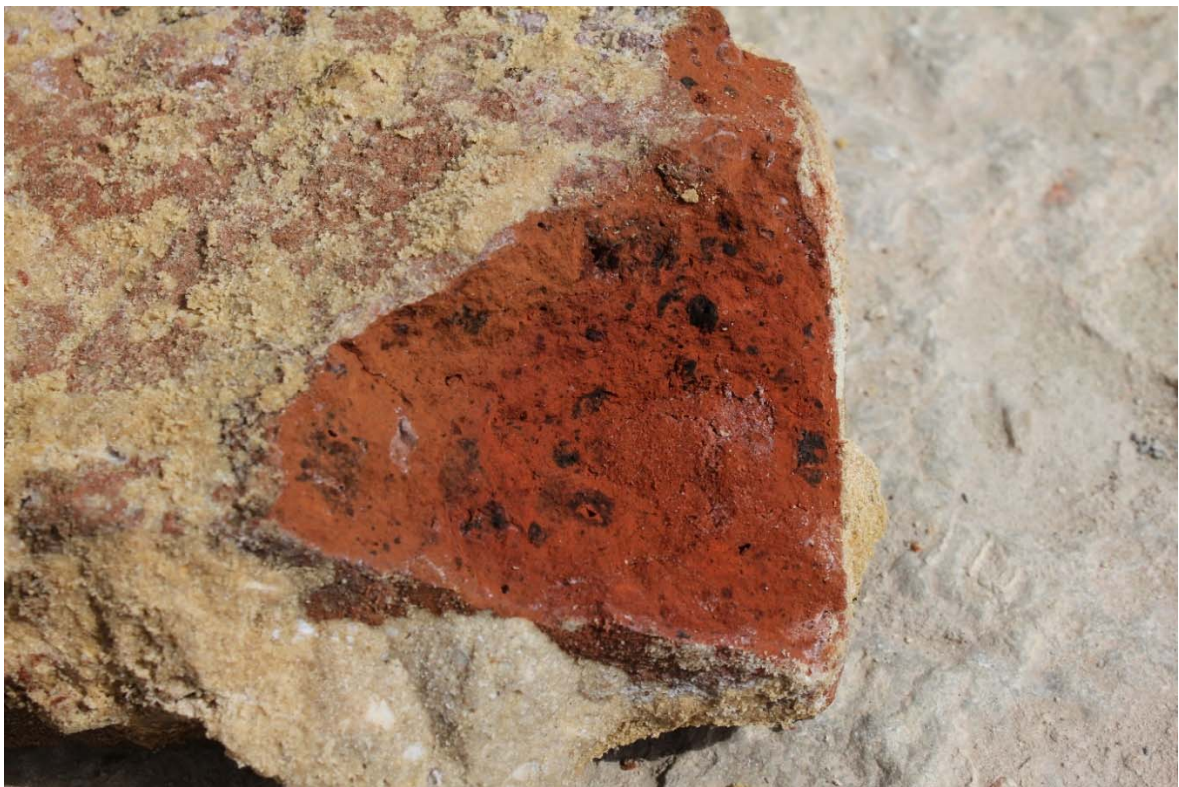
Fig. 4 : matrice hétérogène des briques de la fourrure. Photo : A. Baudry, 23 mai 2024. © urban.brussels-ULiège.