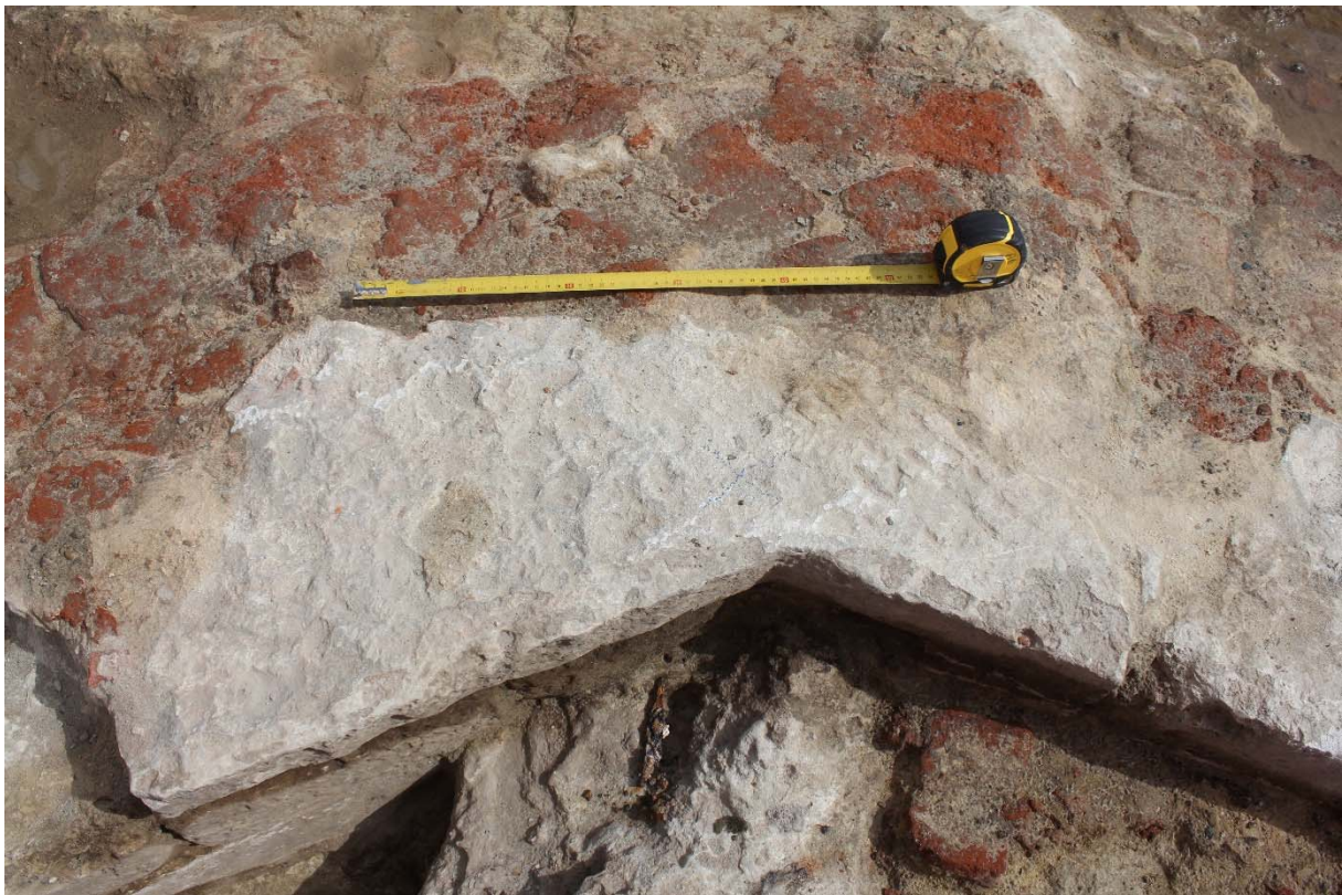
Fig. 14 : une des pierres d'angle de la tourelle sud-ouest, avec des traces de pointe en taille éclatée et brochée. Photo : A. Baudry, 23 mai 2024. © urban.brussels-ULiège.