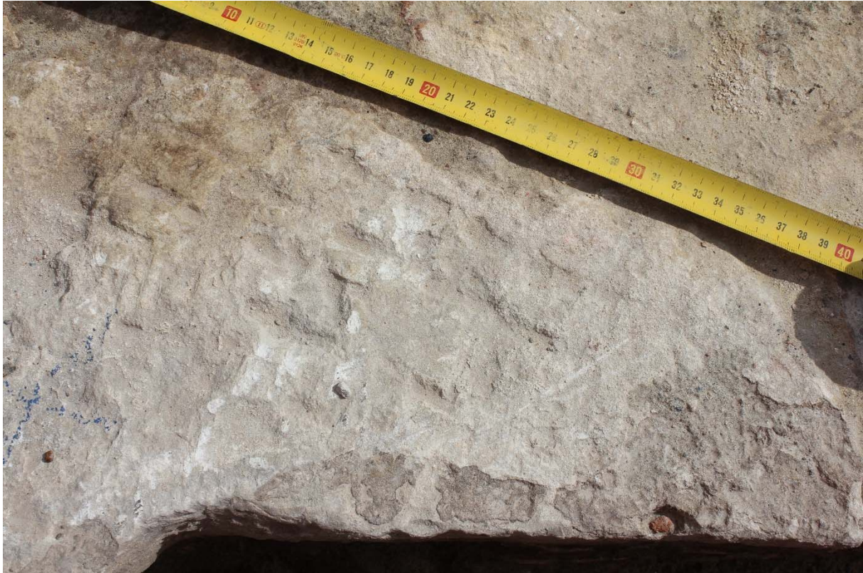
Fig. 13 : traces supposées de pointe brochée sur la face d'attente d'un bloc. Photo : A. Baudry, 23 mai 2024. © urban.brussels-ULiège.