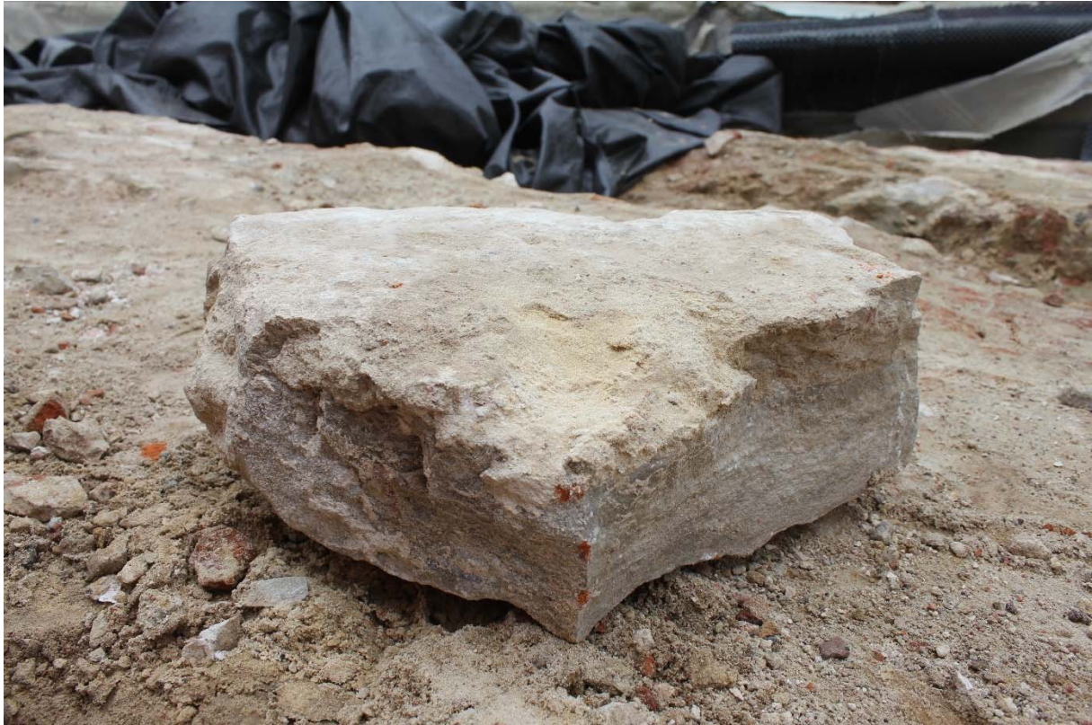
Fig. 11 : queue brute d'un bloc délogé de son assise. Photo : A. Baudry, 23 mai 2024. © urban.brussels-ULiège.