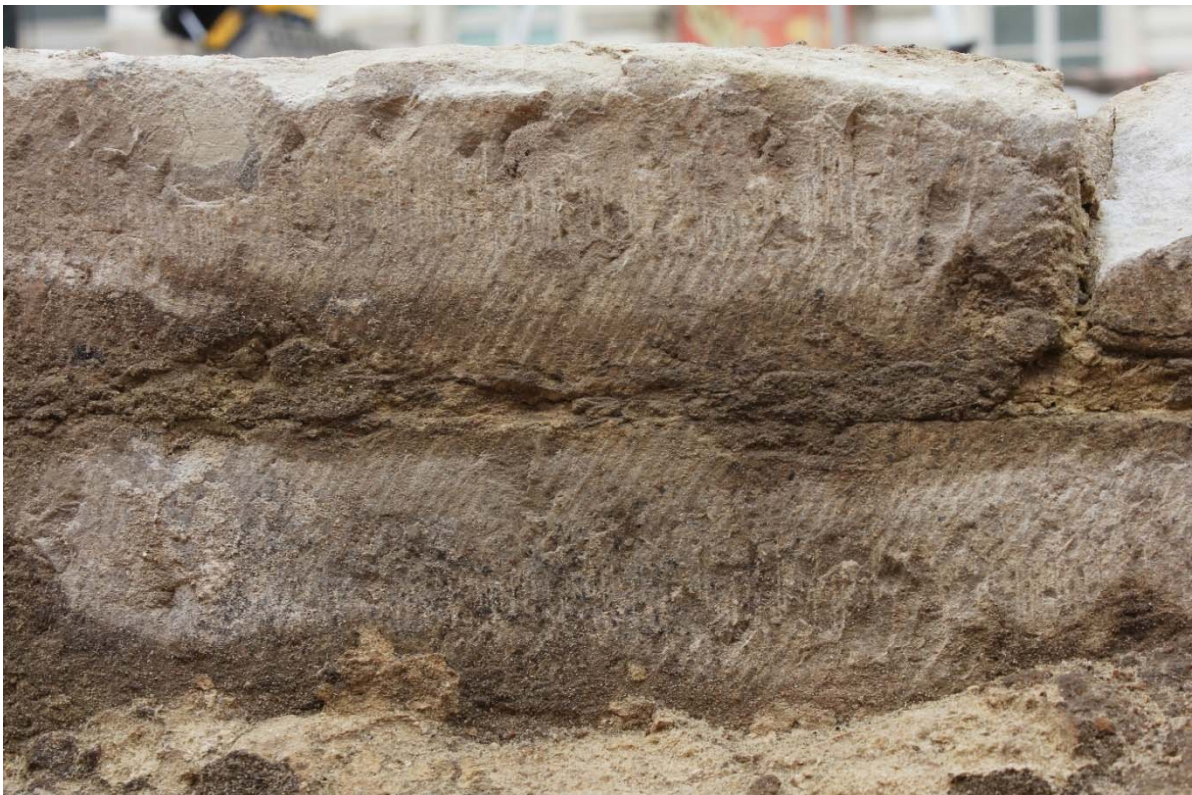
Fig. 6 : parements taillés au tranchant droit (marteau taillant ou charrue), de manière perpendiculaire aux arêtes longues, avec ciselure, large et irrégulière, taillée au ciseau oblique. Photo : A. Baudry, 23 mai 2024. © urban.brussels-ULiège.