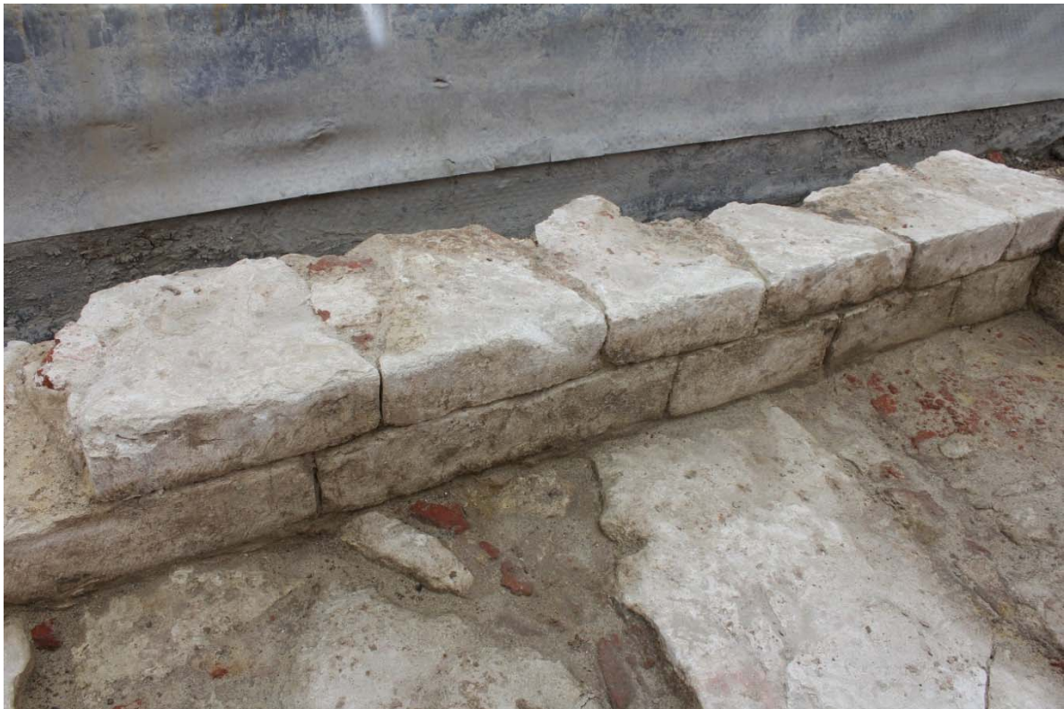
Fig. 10 : vue des parements de la maçonnerie précédente. Photo : A. Baudry, 23 mai 2024. © urban.brussels-ULiège.