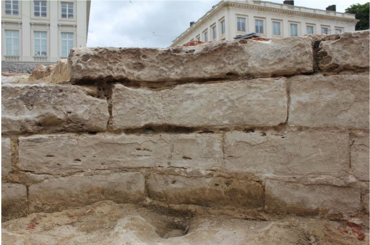
Fig. 3 : parements de l'Aula Magna, exemple d'altération (desquamation ?) à la connexion entre le mur-pignon sud et la tourelle octogonale sud-ouest. Photo : A. Baudry, 23 mai 2024. © urban.brussels-ULiège.