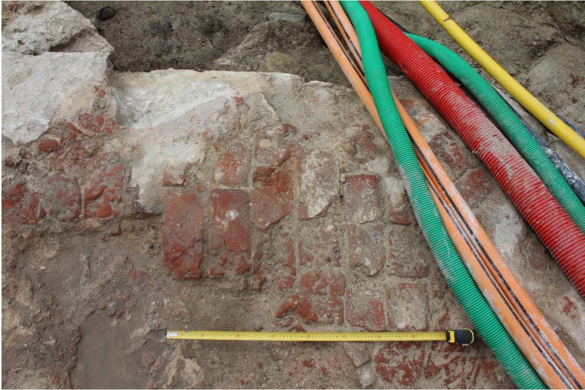
Fig. 5 : disposition des briques dans la fourrure de la tour sud-ouest. Photo : A. Baudry, 23 mai 2024. © urban.brussels-ULiège.