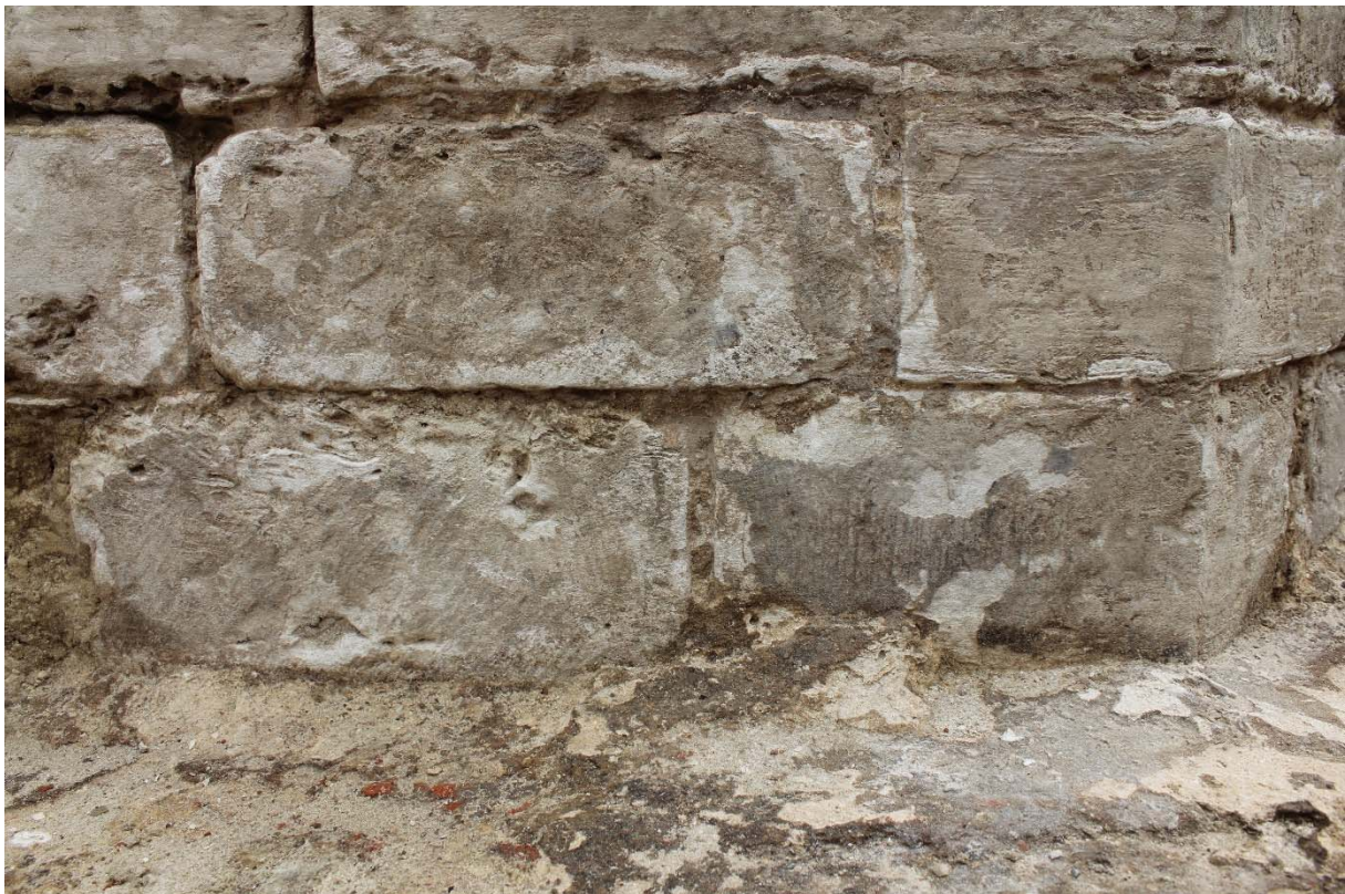
Fig. 8 : cohabitation des deux techniques de taille dans la même maçonnerie (ici, le mur-pignon sud de l'Aula Magna). Photo : A. Baudry, 23 mai 2024. © urban.brussels-ULiège.