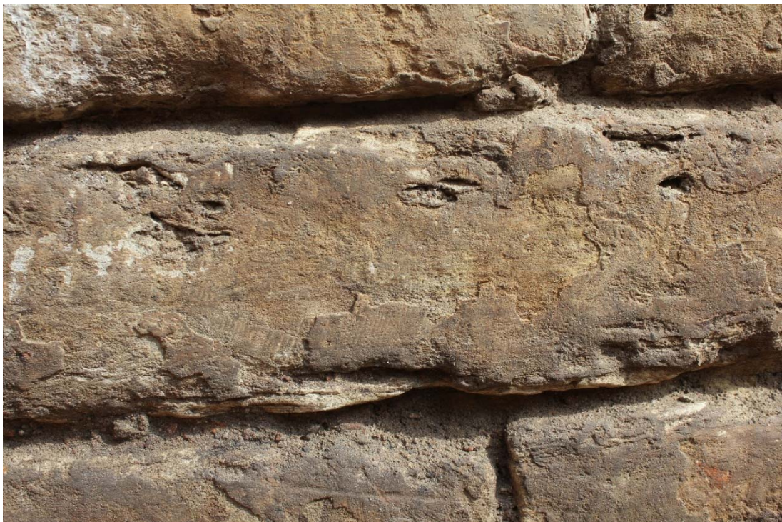
Fig. 2 : parement de l'Aula Magna, exemple d'altération du parement (desquamation ?). On aperçoit encore timidement des traces d'outil sur les parties mieux préservées (tranchant droit, taille oblique).