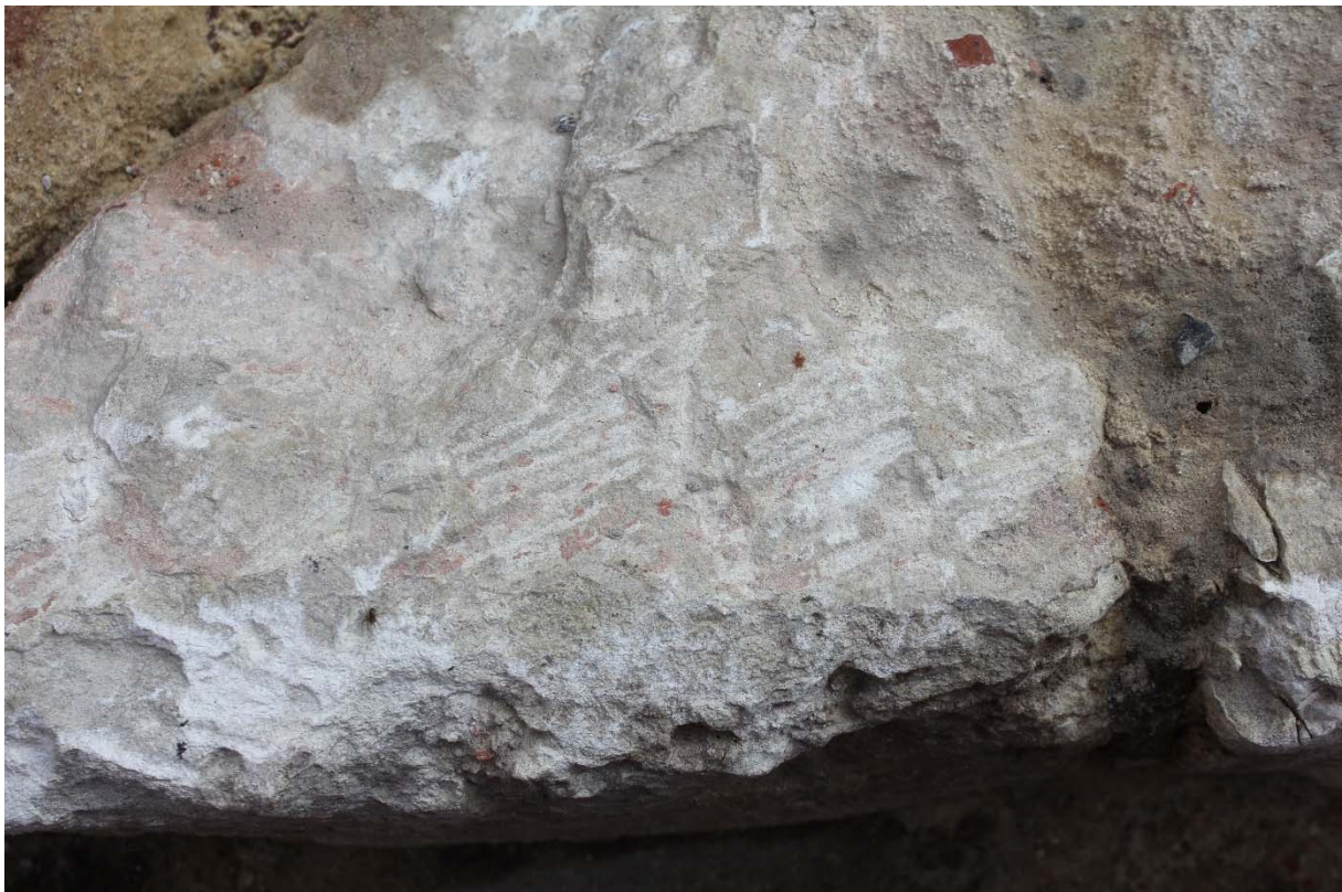
Fig. 12 : tranchant droit étroit (polka ?) sur la face d'attente d'un bloc. Photo : A. Baudry, 23 mai 2024. © urban.brussels-ULiège.