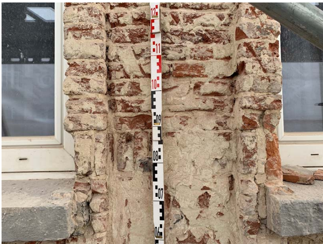
Fig. 5 : abaissement des appuis des fenêtres du deuxième étage US12 et ravalement US13 d'un bandeau (briques sur chant). Photo : S. Modrie, 2022 (BR639_20220923_086_SMo). © urban.brussels-ULiège.