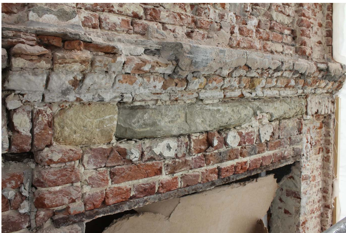
Fig. 4 : abaissement du linteau de la fenêtre n°6 au deuxième étage, US8 .