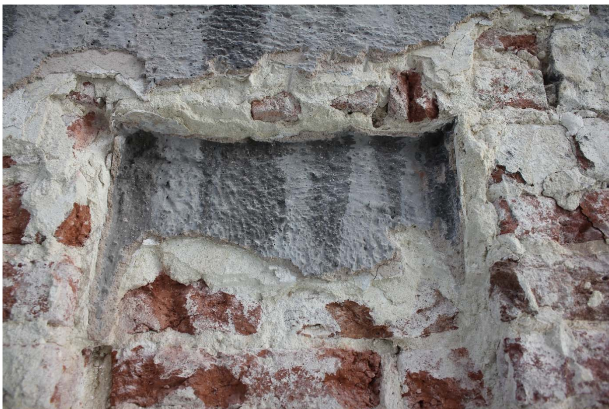
Fig. 17 : enduit cimenté US33 recouvrant la façade avant l'intervention archéologique.