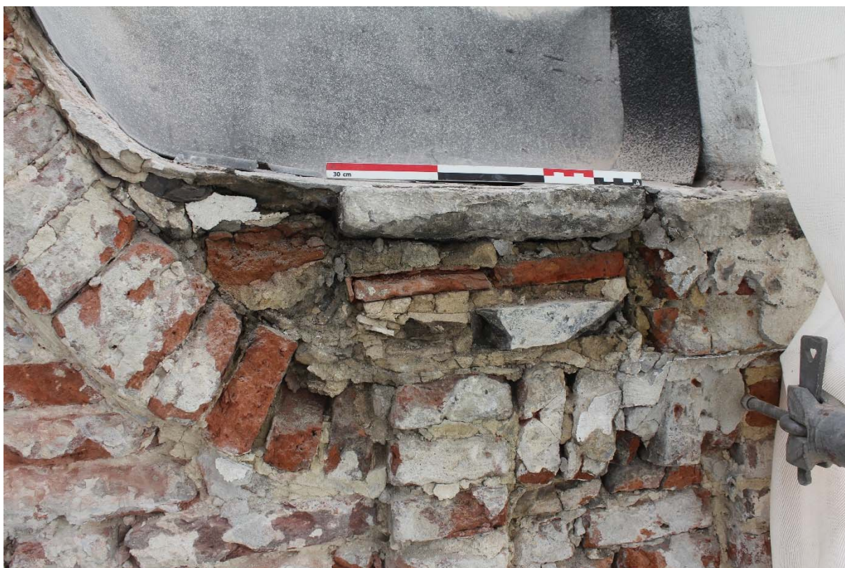
Fig. 13 : rehaussement du chéneau de droite US14 sur l'aileron correspondant.