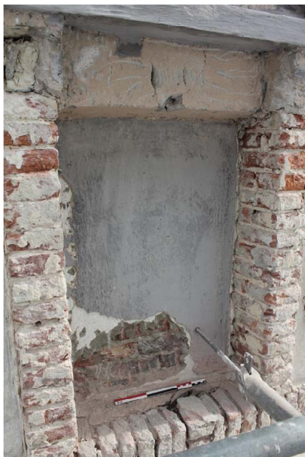
Fig. 10 : comblement US15 de la fenêtre n°10 du pignon et réfection en béton de son linteau US16 .