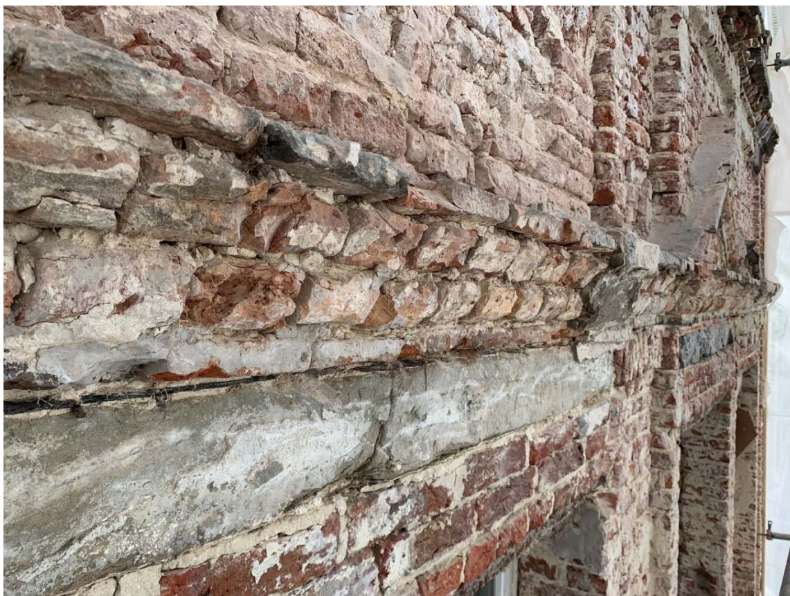
Fig. 26 : corniche du deuxième étage servant de base au fronton (à droite).