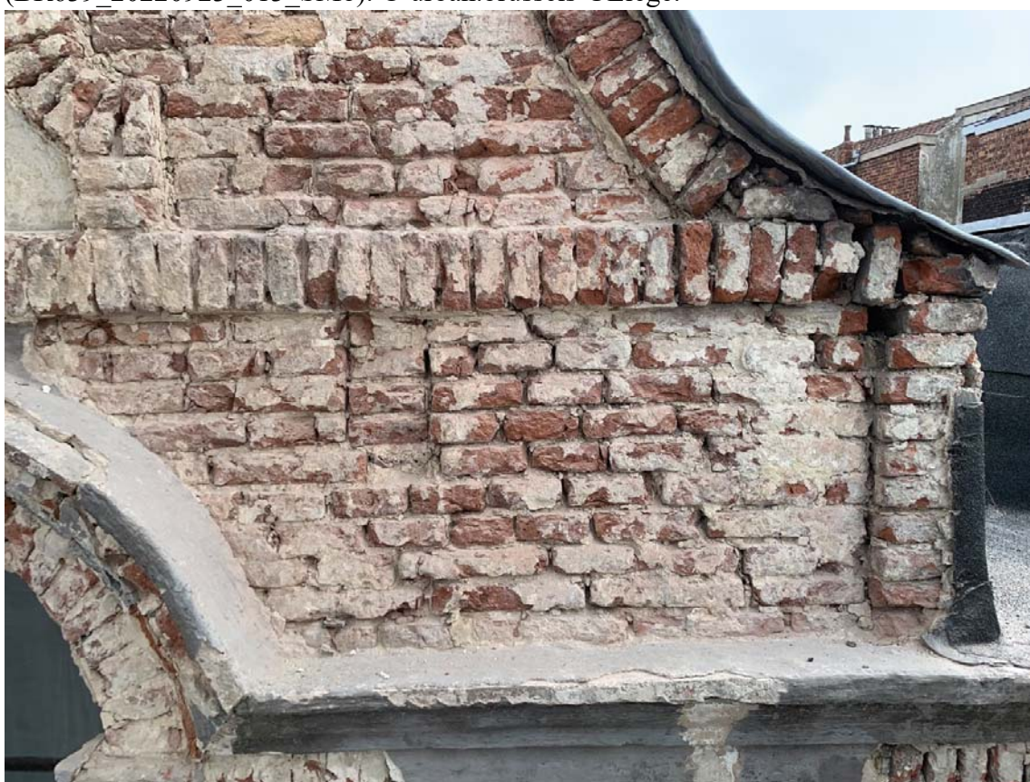
Fig. 22 : bandeau ravalé US13 dans le pignon.