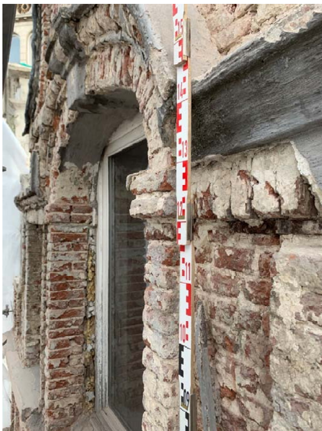
Fig. 3 : la fenêtre axiale du pignon, avec impostes en briques préservées. Photo : S. Modrie, 2022 (BR639_20220923_041_SMo). © urban.brussels-ULiège.