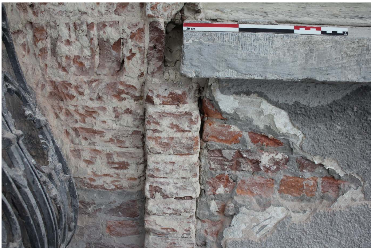
Fig. 9 : allège (mur-sous-appui) cimentée US17 de la baie n°3 du premier étage.