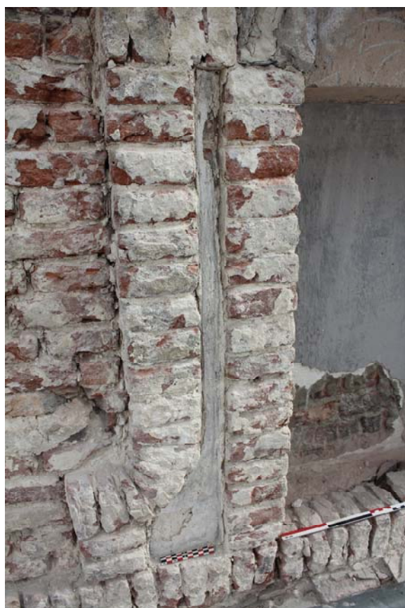
Fig. 16 : enduit blanc US31 dans l'aileron gauche de la fenêtre n°10, recouvrant l'enduit rouge à fausses briques. Photo : A. Baudry, 2022 (BR639_20220923_203_ABaudry). © urban.brussels-ULiège.