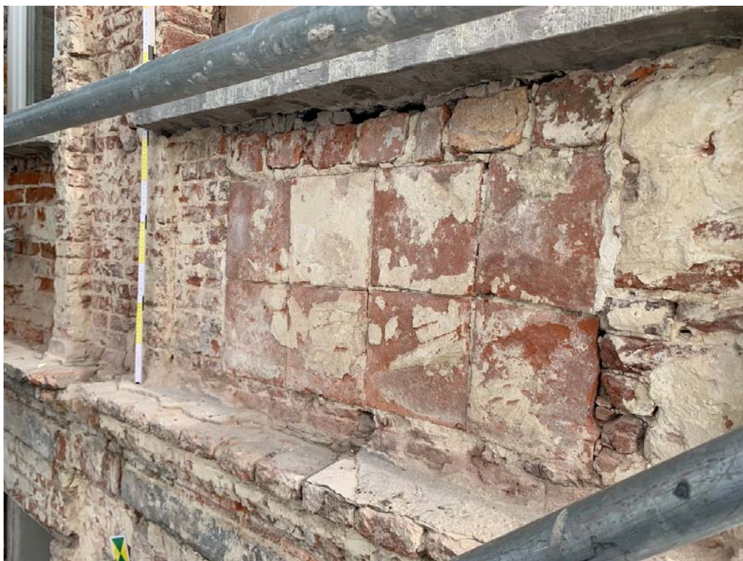
Fig. 6 : comblement US18 de l'allège (mur-sous-appui) de la fenêtre n°6 du deuxième étage.