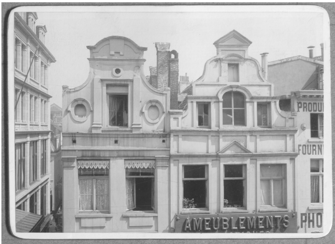
Fig. 19 : la façade du n°84 (à droite) photographiée en 1905-1907.