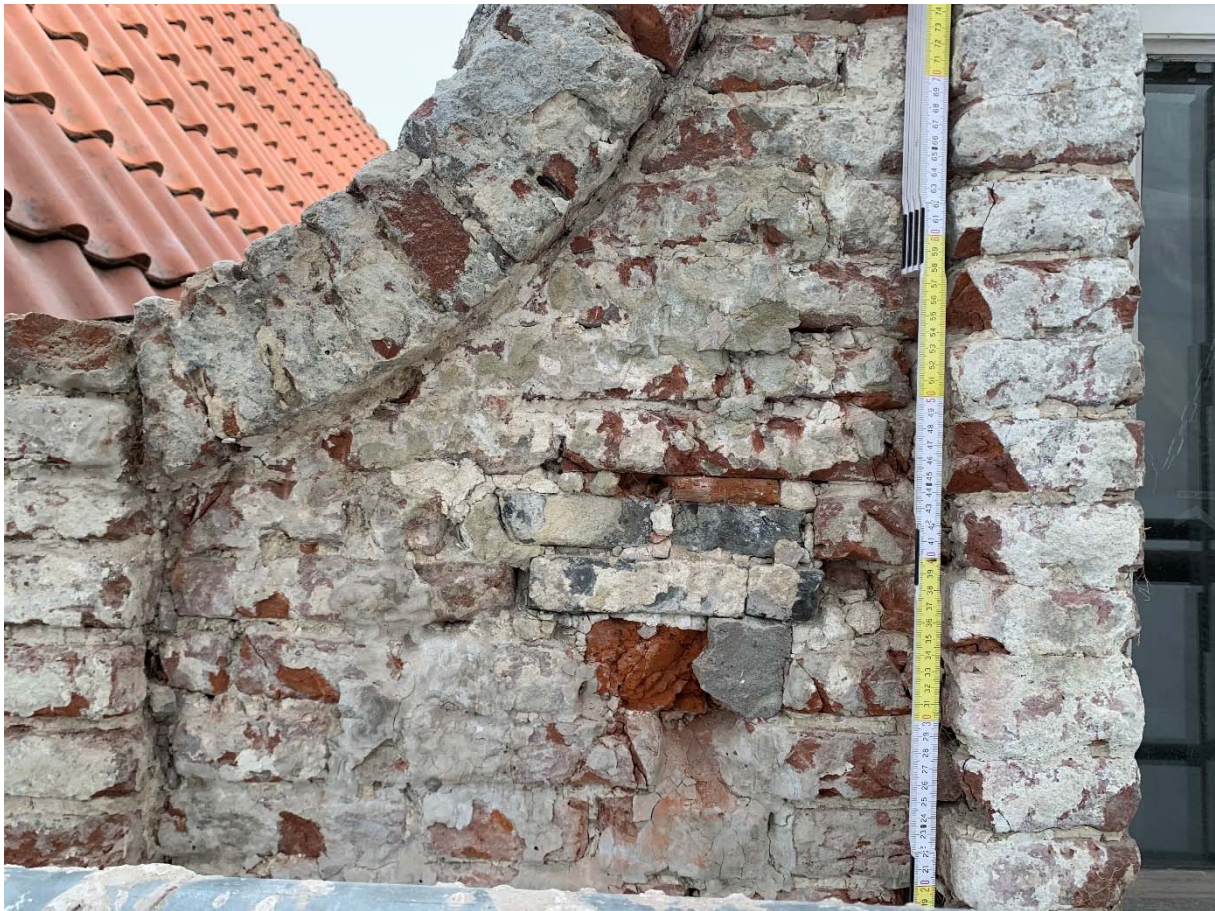
Fig. 11 : petite cavité US22 (trou de boulin ?) obturée dans l'aileron gauche du pignon.