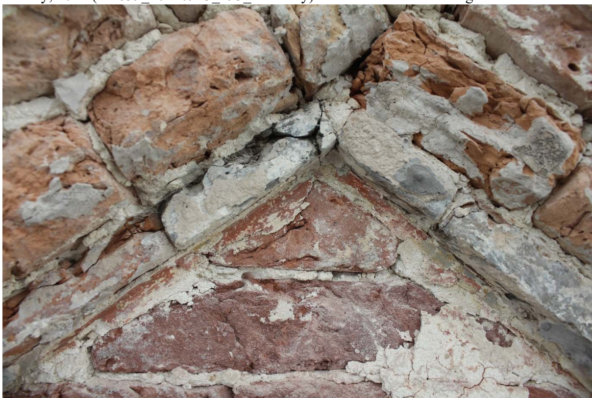
Fig. 14 : enduit rouge primitif US35 dans le fronton du deuxième étage.