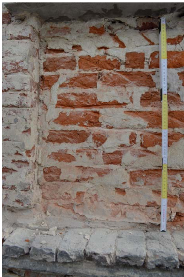
Fig. 8 : comblement US19 de l'allège (mur-sous-appui) de la fenêtre n°5 du deuxième étage. Photo : S. Modrie, 2022 (BR639_20220923_020_SMo). © urban.brussels-ULiège.