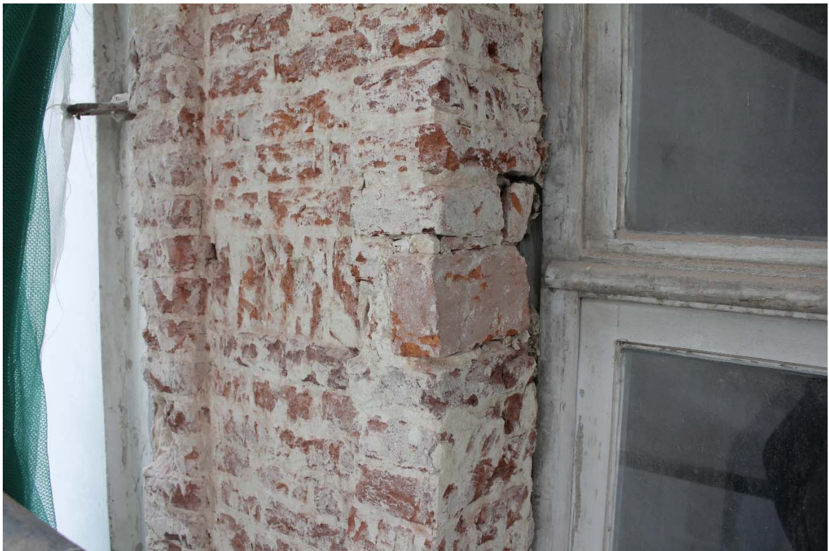
Fig. 2 : premier étage, calage gauche de la fenêtre n°1, bandeau ravalé US13 se prolongeant à droite en imposte ou traverse elle aussi ravalée/supprimée (briques sur chant), US6.