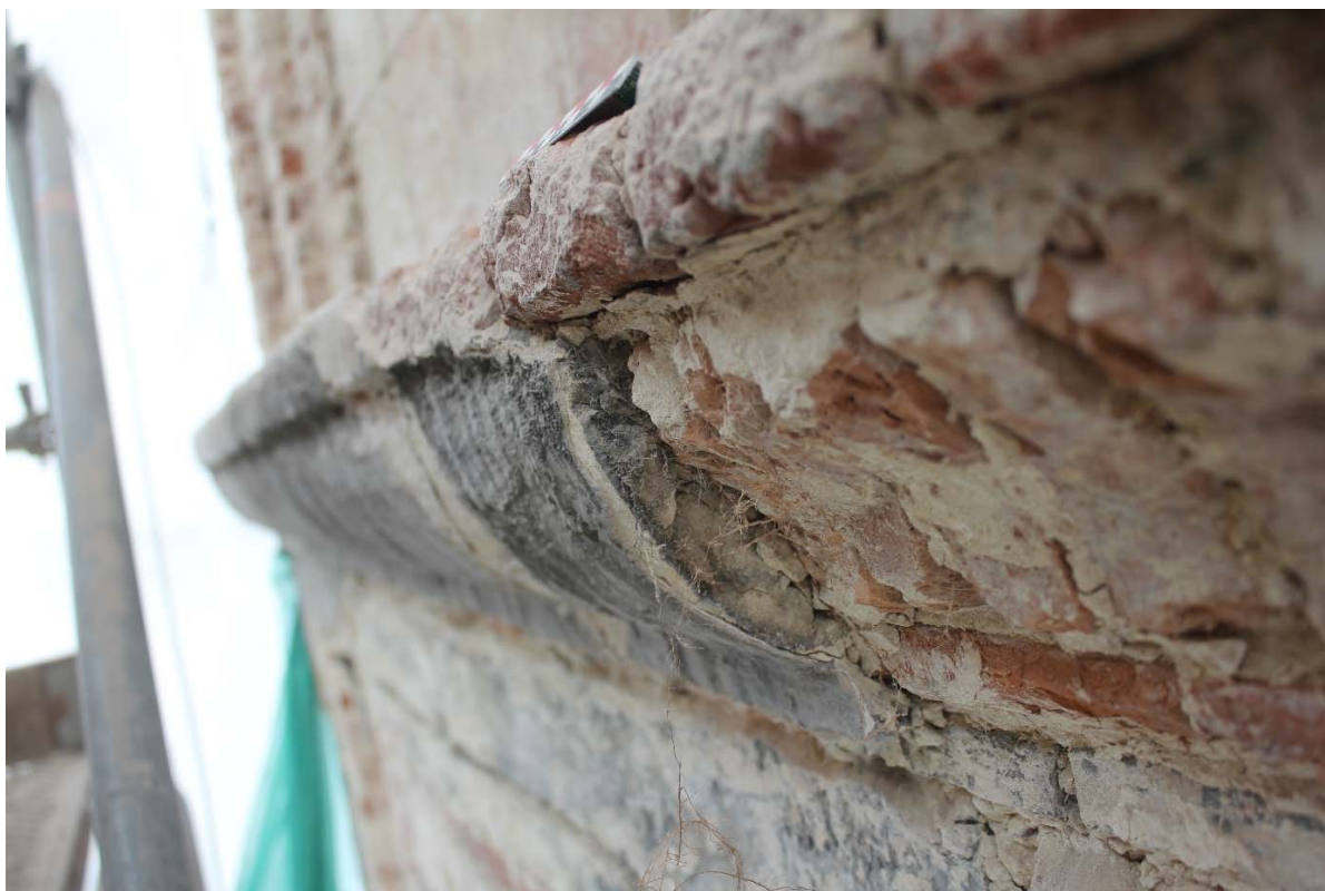
Fig. 23 : corniche du premier étage.