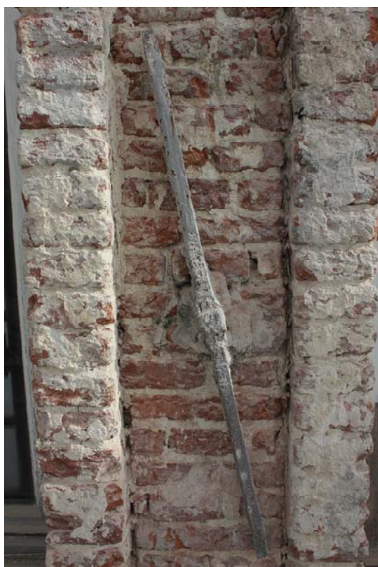
Fig. 18 : ancre US10 rajoutée dans le trumeau des fenêtres n°7-8.