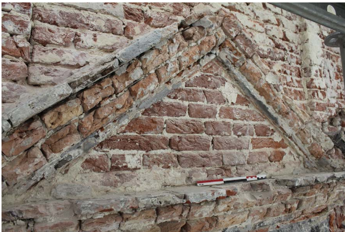
Fig. 25 : fronton triangulaire du deuxième étage. Photo : A. Baudry, 2022 (BR639_20220923_169_ABaudry). © urban.brussels-ULiège.