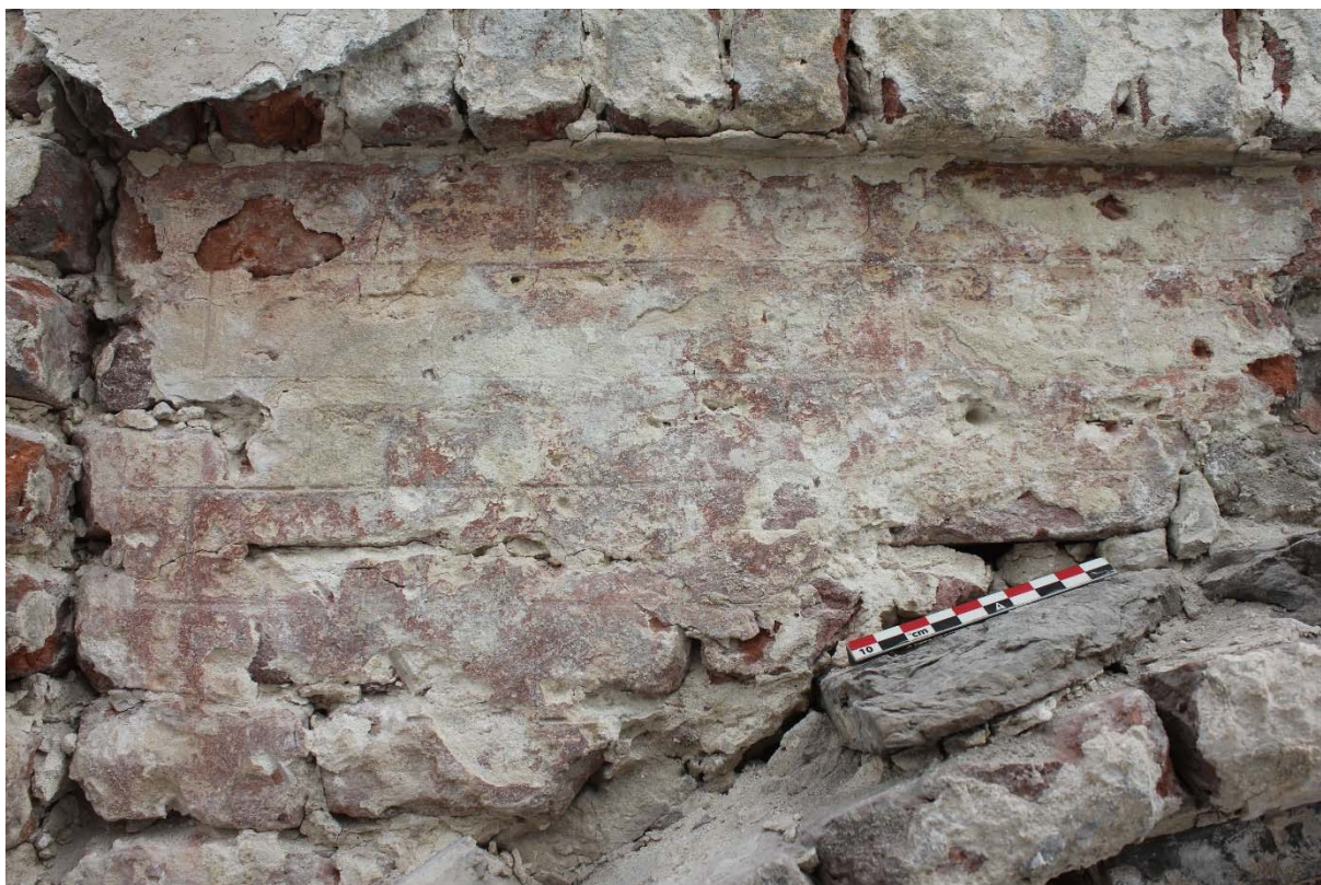
Fig. 15 : enduit de fausses briques US35 dans la partie sommitale de la façade. Photo : A. Baudry, 2022 (BR639_20220923_195_ABaudry). © urban.brussels-ULiège.