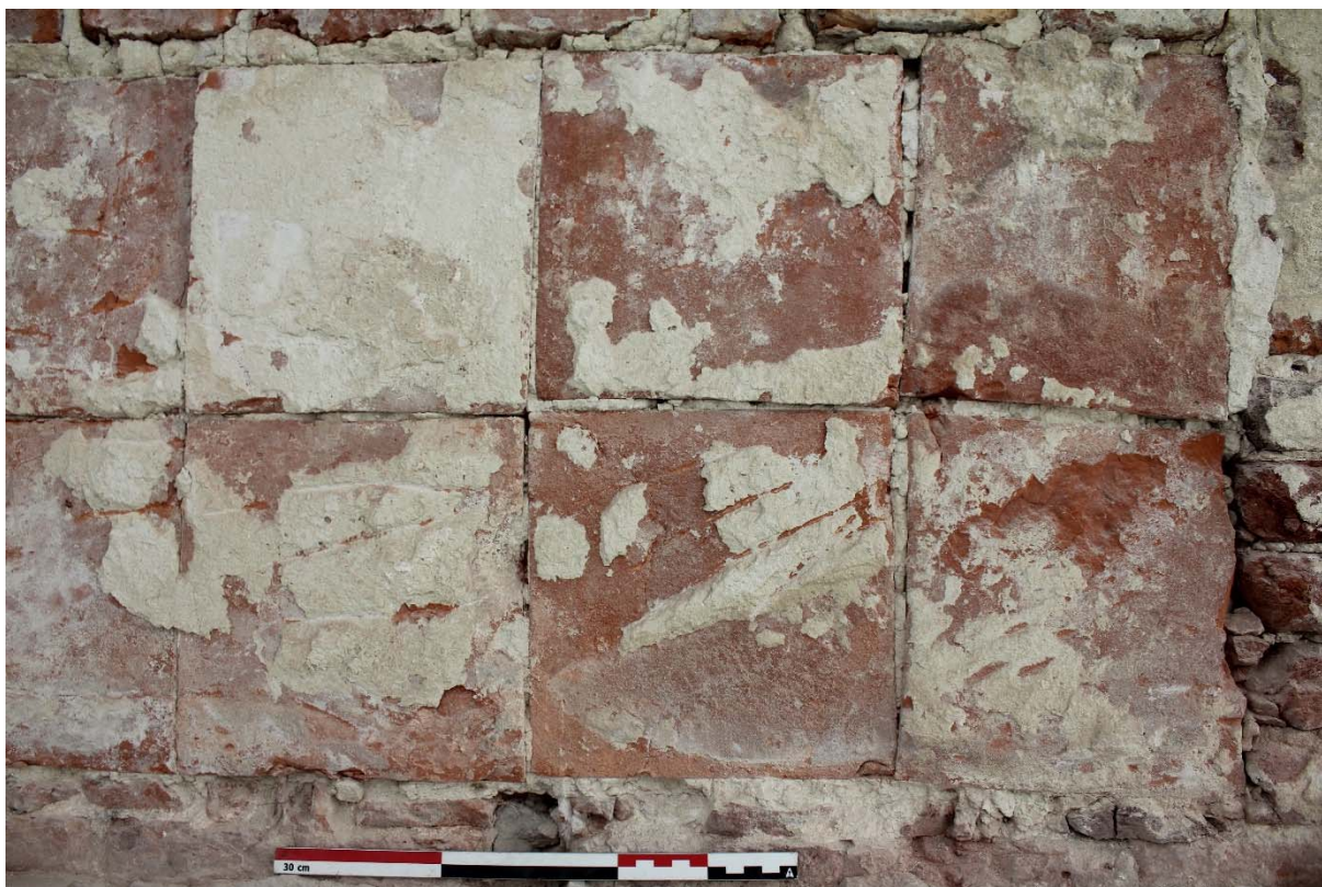
Fig. 7 : comblement US18 des allèges des baies latérales du deuxième étage. Photo : A. Baudry, 2022 (BR639_20220923_153_ABaudry). © urban.brussels-ULiège.