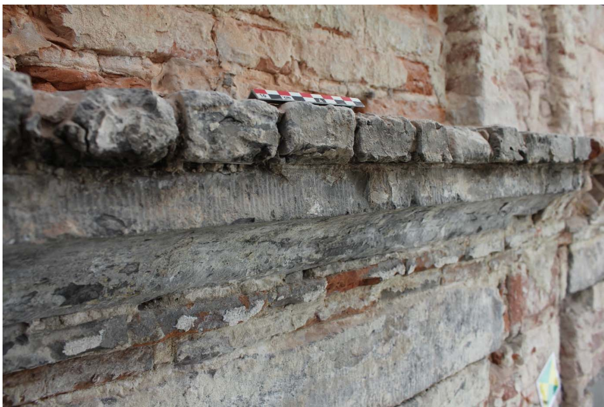
Fig. 24 : corniche du premier étage, partie centrale, pierre bleue moulurée en cavet.