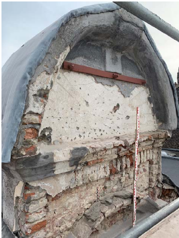
Fig. 12 : fronton sommital US22 de facture grossière en matériaux à joints cimentés. Photo : S. Modrie, 2022 (BR639_20220923_028_SMo). © urban.brussels-ULiège.