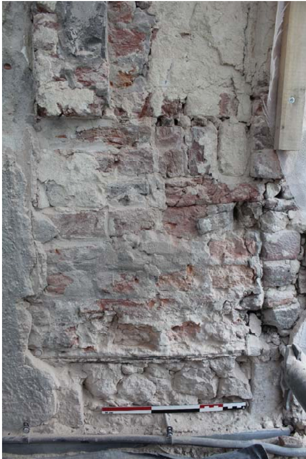
Fig. 1 : poutre métallique en I de la devanture commerciale US2, sous les murs-sous-appuis des fenêtres du premier étage.