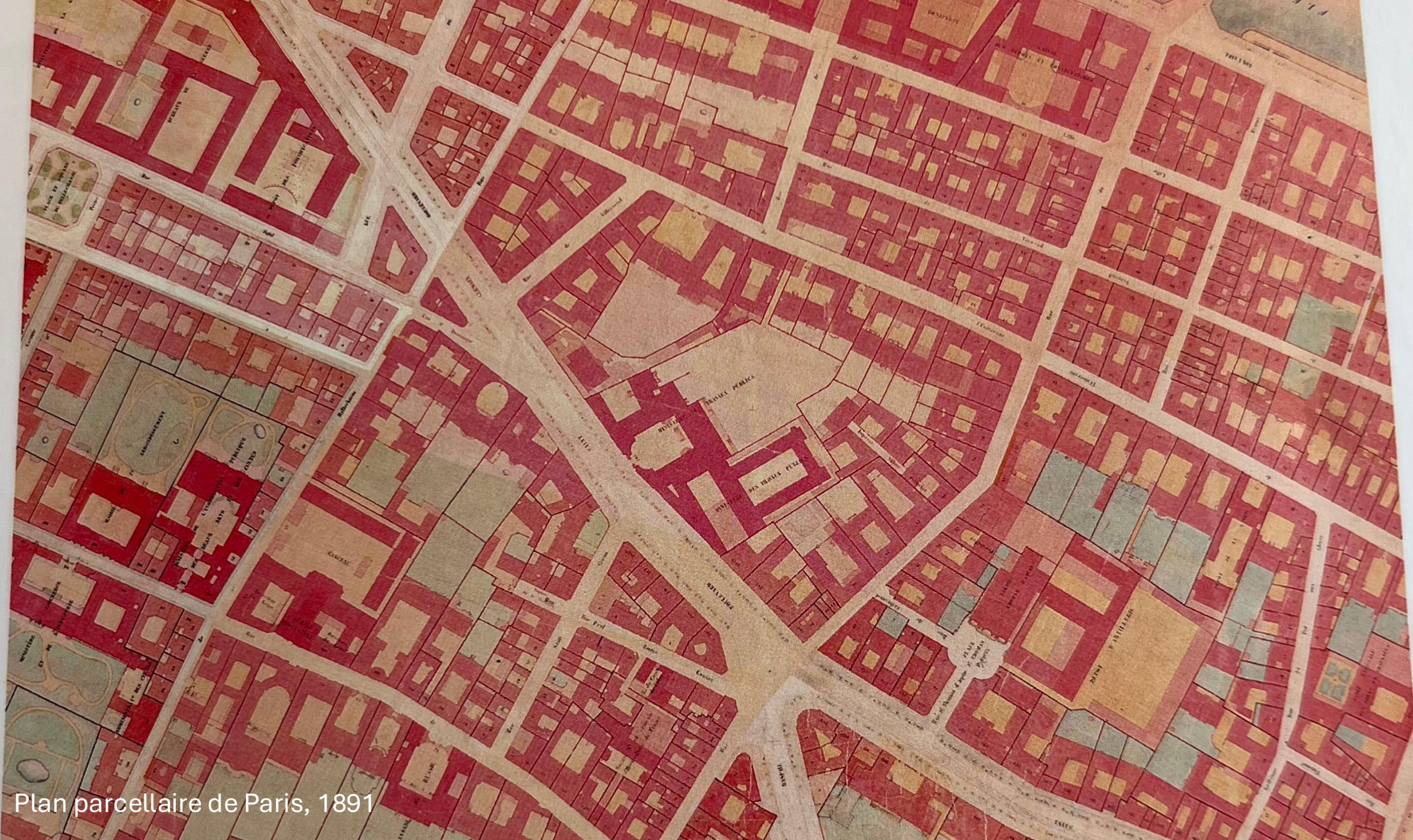
Plan parcellaire de Paris, 1891