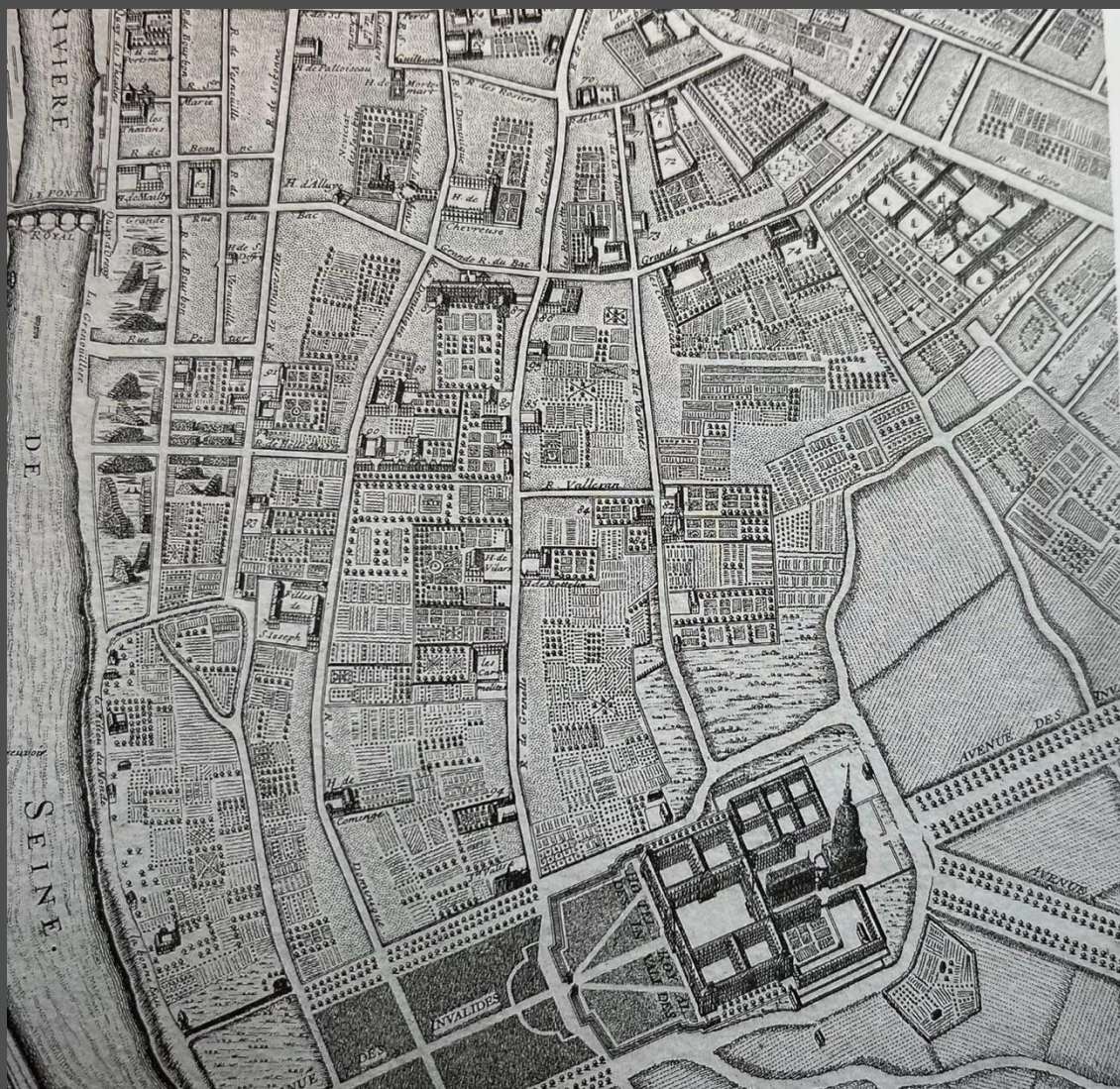
Plan Jaillot 1713, hôtel des invalides et premiers hôtels particuliers