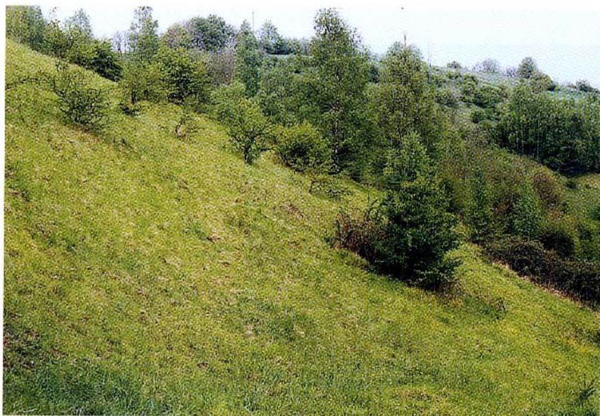
FIG. 3. — La pelouse calcaire du Trî Mottet (Photo : Ph. MAIRESSE)