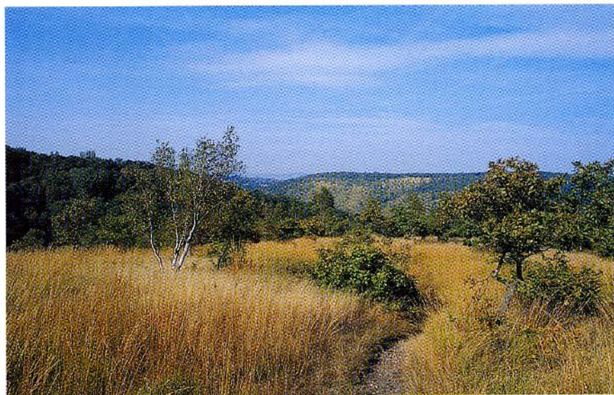
FIG. 5. — La «savane» du Bois les Dames à Chaudfontaine (Photo : Ph. GOFFART, octobre 1997)