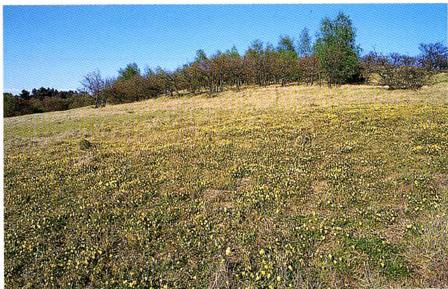
FIG. 4. — Pelouse à Viola calaminaria et Agrostis capillaris à Prayon