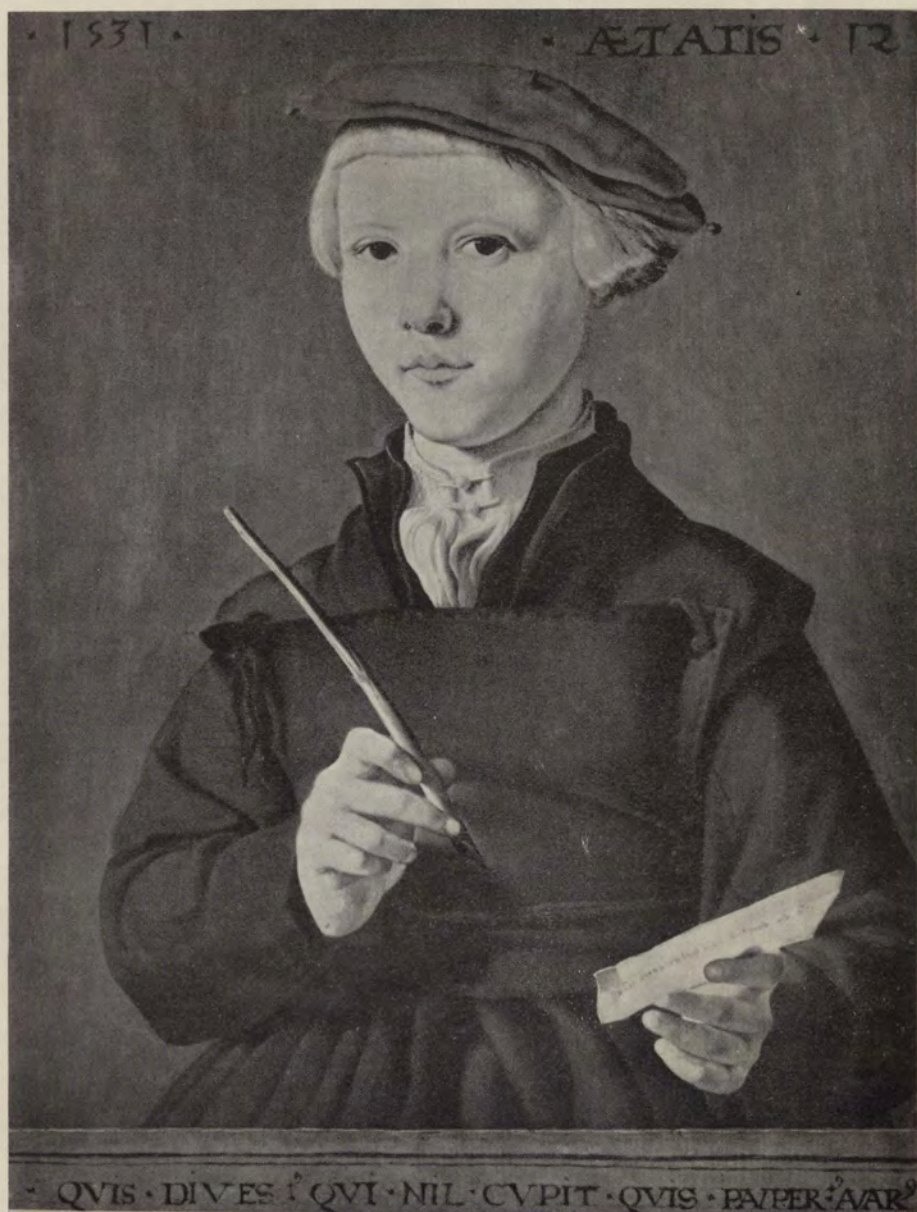
PORTRAIT D'UN ÉCOLIER par Jean Van Scorel

(Musée Boymans-van Beuningen, Rotterdam)