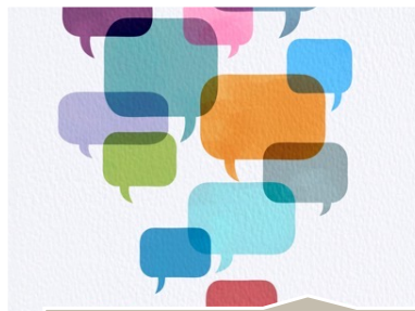
Tour de rôle