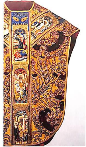
La chasuble de David de Bourgogne.