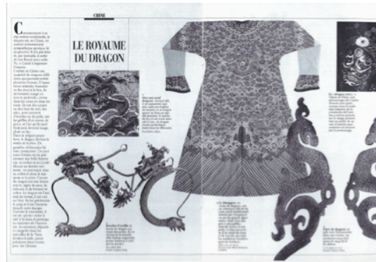
Première de couverture du livre et extrait d'un texte informatif utilisé lors du dernier atelier

Ces cercles de lecture sont l'aboutissement d'un travail plus large. En effet, durant le premier et le deuxième trimestres, nous avons réalisé un travail en amont de ces ateliers afin de faire découvrir aux élèves une approche du texte selon les différentes stratégies de lecture. Ainsi, sur le principe des classes parallèles, nous avons subdivisé trois classes en cinq sous-groupes, mené chacun par un enseignant. À cette occasion, les