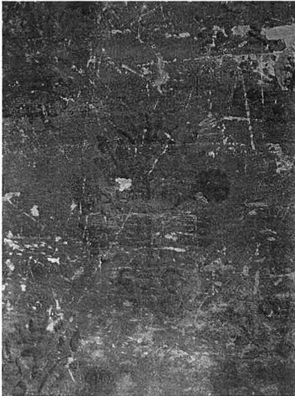
Fig. 4 : Vue d'un motif floral d'une peinture murale décorant le grand salon situé au premier étage.

par L.-B. Dewez. Elle devait atteindre une superficie avoisinant les 94m 2 ce qui laisse supposer une fonction d'apparat.