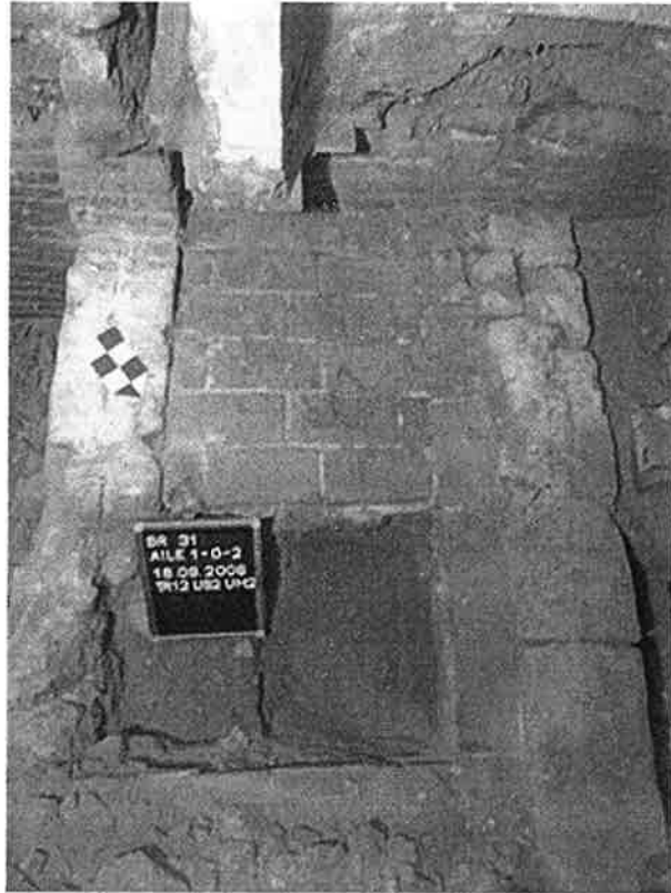
Fig. 2 : Vue de l'ancienne habitation datée du XV e siècle.

L'aspect actuel du bâti de l'hôtel est le fruit de nombreuses transformations effectuées au cours des siècles. La plus importante, hormis la rénovation en cours, fut la démolition en 1956 de la partie nord de l'ensemble, appelé «hôtel Merode-Deinze» (fig.2). Cette appellation découle de la division de la propriété en 1848 en deux entités distinctes nommées «grand hôtel» et «petit hôtel». Cette disparition altéra profondément la compréhension architecturale et archéologique que nous avons du bâtiment pour les xvi e , xvii e et xviii e siècles.