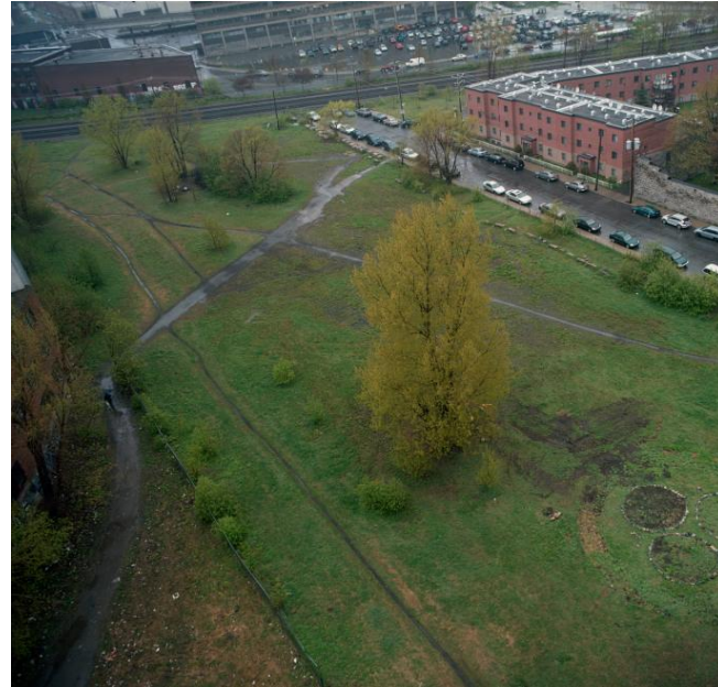
Champ des Possible, Montréal