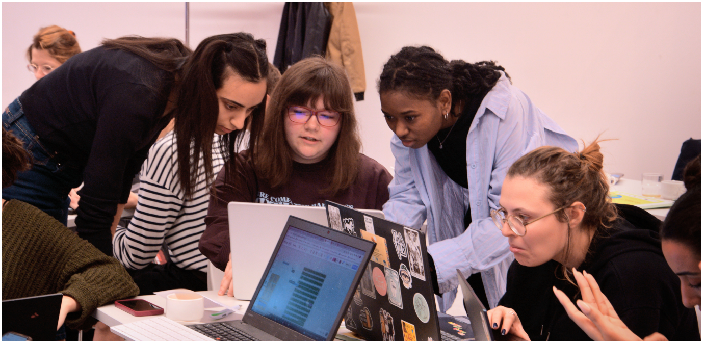
Seminaire interculturels Connexion-s en Belgique, 2023

Une production du projet Connexion-s financé par l'Union européenne. Ce projet interculturel, qui a débuté en mai 2022, est soutenu par l'organisation française Engagé-e-s & Déterminé-e-s, aux côtés de trois organisations internationales partenaires : Eclasio (Belgique), le Tunisian Forum for Youth Empowerment (Tunisie) ainsi que Coalition SEGA (Macédoine du Nord).