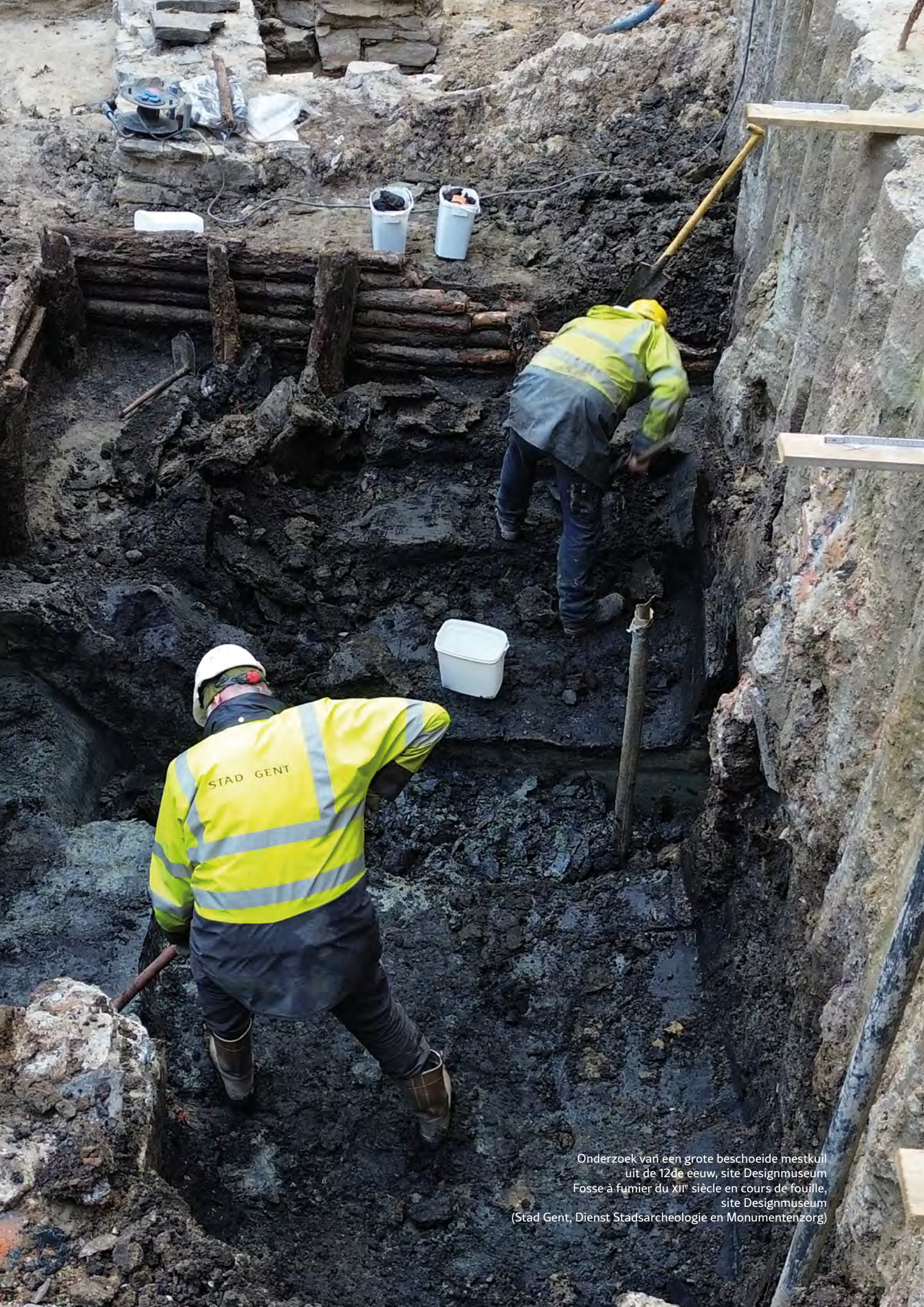
Onderzoek van een grote beschoeide mestkuil uit de 12de eeuw, site Designmuseum Fosse à fumier du XII e siècle en cours de fouille, site Designmuseum (Stad Gent, Dienst Stadsarcheologie en Monumentenzorg)