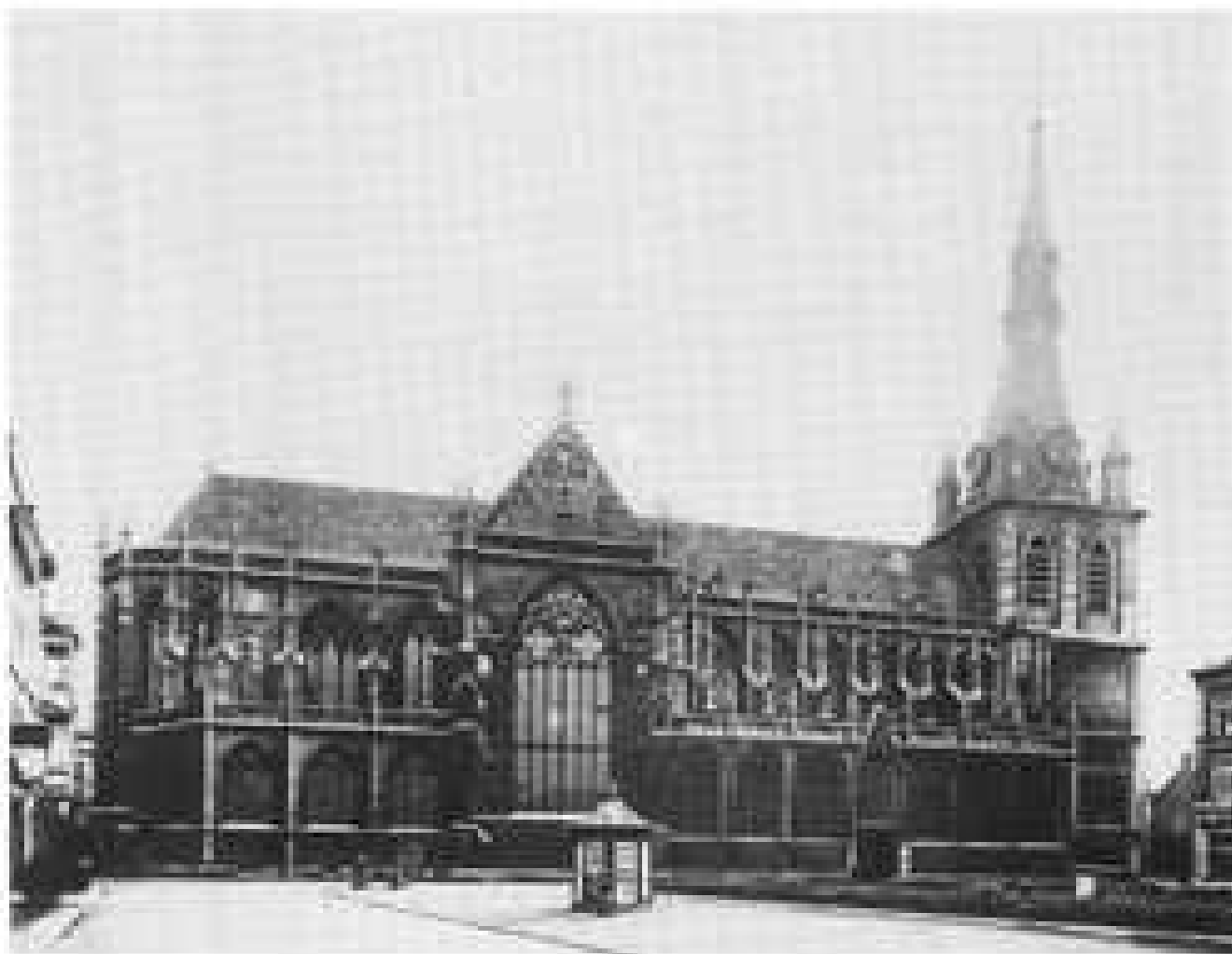
1. La face nord de la cathédrale Saint-Paul à Liège. Photographie prise en 1914-1918.