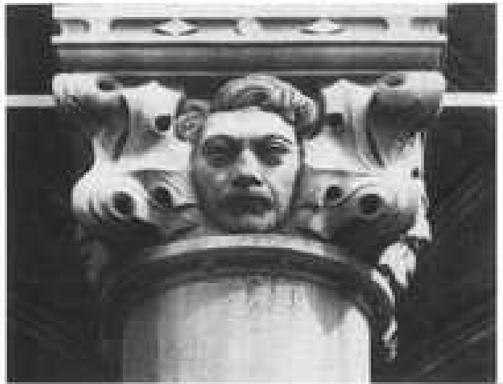
5. L'hôtel du Gouvernement provincial à Liège. Photographie prise avant 1914.