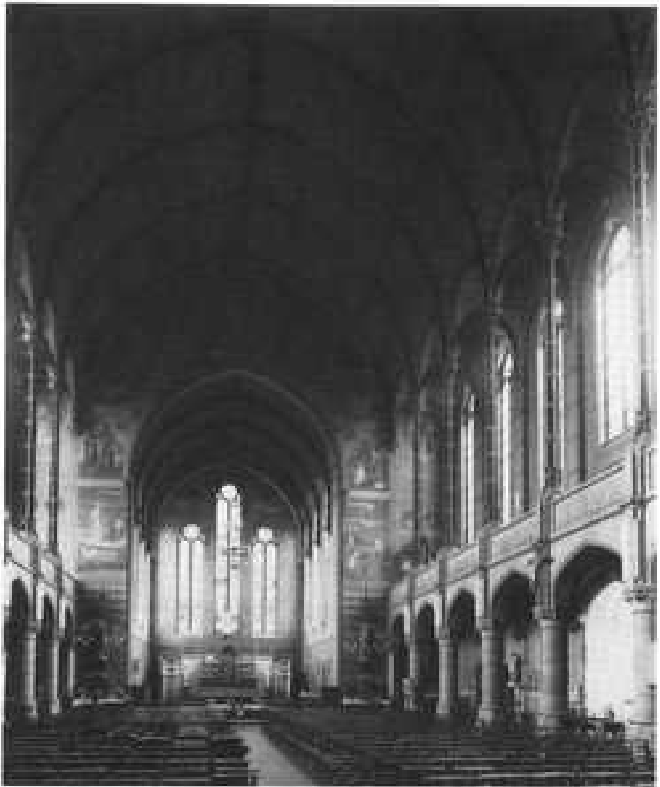
9. L'église Saint-François de Sales à Liège, vue intérieure vers le chœur. Photographie prise en 1959.