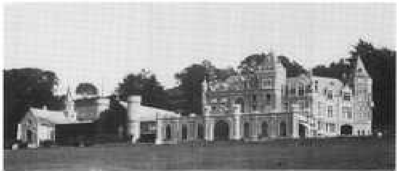
2. Le château des Mazures. Lithographie tirée de E. DE DAMSEAUX, La Belgique pittoresque. Les châteaux , Mons, 4 e année, 1875, 3 e livraison : Bibliothèque de la Ville de Liège « Les Chiroux ».