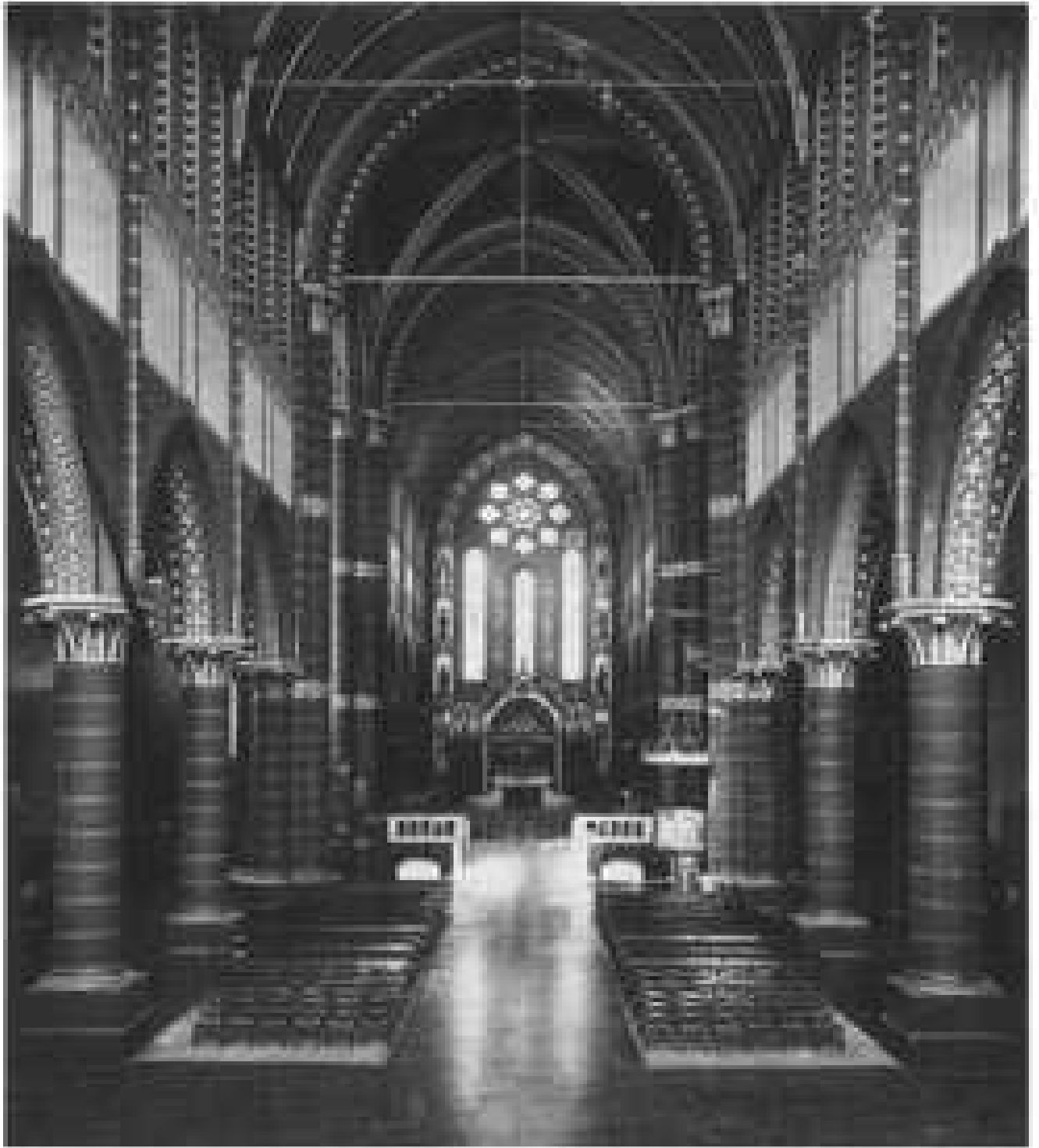
8. L'église abbatiale de Maredsous, vue intérieure vers le chœur. Photographie prise en 1910.