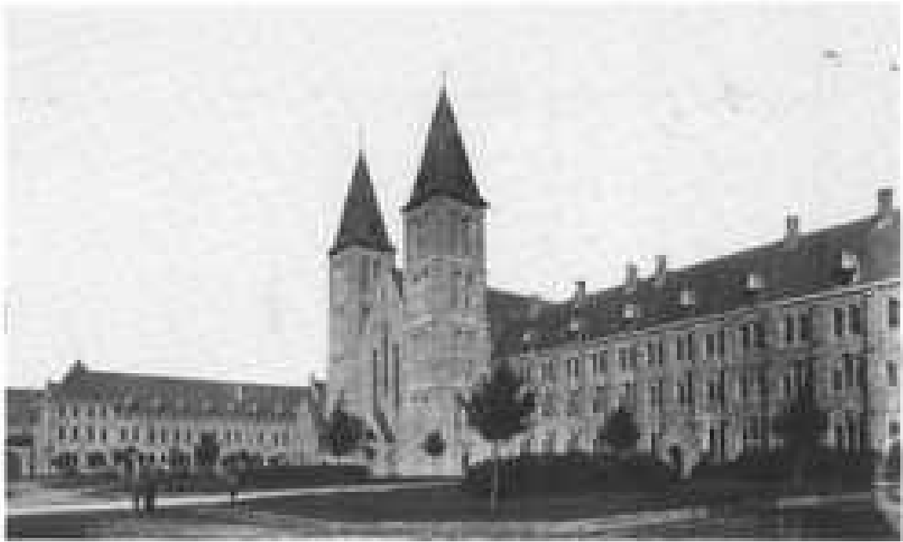
7. L'abbaye de Maredsous. Photographie prise en 1903. Copyright ACI. Bruxelles.