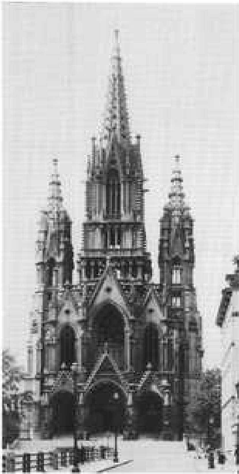
4. L'église Notre-Dame à Laeken. Photographie prise en 1942.