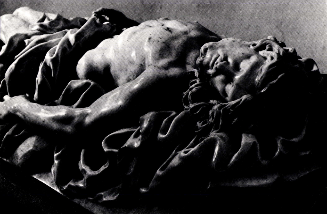
CHRIST AU TOMBEAU PAR JEAN DEL COUR. Marbre blanc légèrement veiné de gris, 1696. Détail. Liège, cathédrale Saint-Paul.