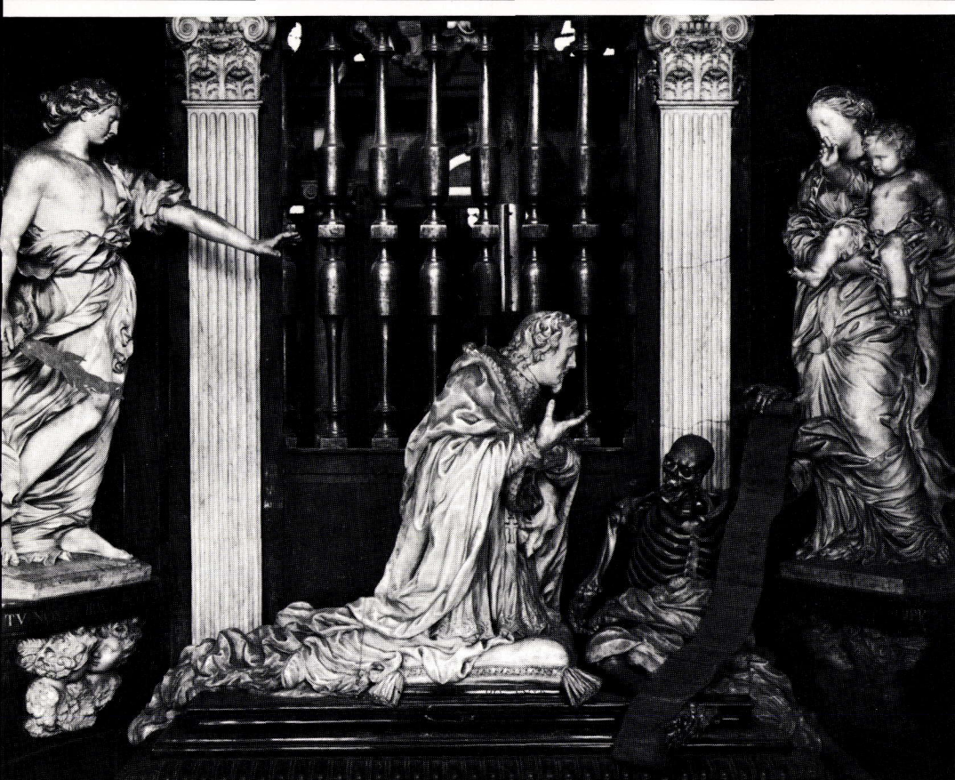
MONUMENT FUNÉRAIRE D'EUGÈNE-ALBERT D'ALLAMONT, EVÊQUE DE GAND, MORT EN 1673, PAR JEAN DEL COUR. Marbre blanc, marbre noir et bronze doré. Gand, cathédrale Saint-Bavon.

— et le bas-relief du Baptême du Christ ornant la porte est mal venu.