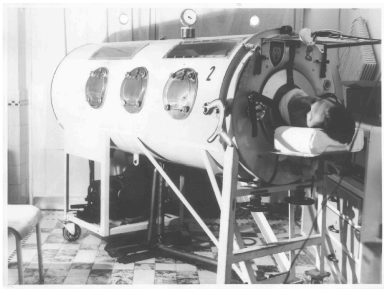
Figura 1. Fotografía de un pulmón de acero encontrado entre los planos arquitectónicos del proyecto Droixhe.

Entre ellos, destacan objetos que facilitan las tareas domésticas, como las ‘cajas de provisiones’ 32 . Luego vino el descubrimiento de una foto de un ‘pulmón de acero’ y de planos de ‘viviendas adaptadas’, que revelaban la existencia un equipamiento singular añadido al plan inicial de Droixhe: un centro médico-familiar para alojar a las familias de los enfermos de polio 33 . Estos hallazgos son los que me han encaminado hacia el tema de mi tesis, cuestionando el lugar que tuvo en su día el care en el grand ensemble de Droixhe.