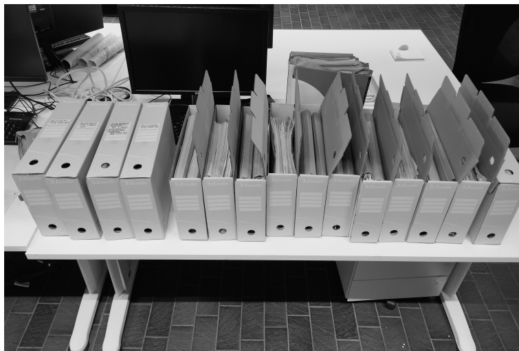
Figura 3. Inventario, clasificación y análisis de los archivos del centro médico-familiar tras la donación de la asbl Revivre chez soi.