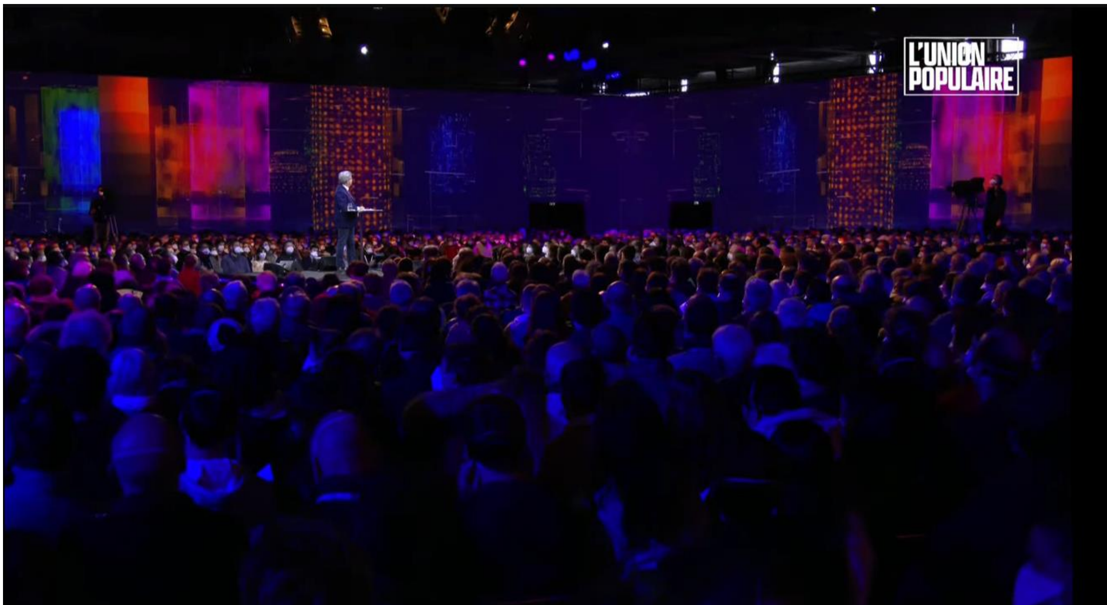
Mélenchon, Jean-Luc, 2022. Meeting immersive de Jean-Luc Mélenchon à Nantes, 16 janvier 2022, sur YouTube.