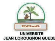
Illustration de couverture