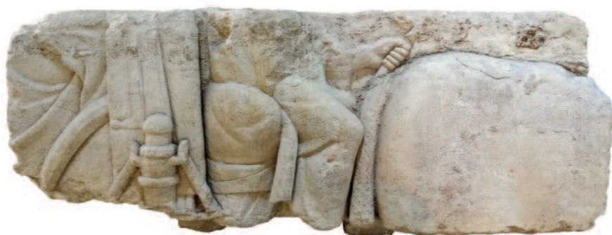
Fig. 9 Bloc sculpté en grès, Arlon, dernier quart du 2 e s. apr. J.-C. Arlon, Tour romaine Neptune, inv. MAA-GR/S-00408.

maintient la caisse d'un char sur lequel ont pris place au moins deux personnages. Ce monument est l'une des sources mobilisées par Chr. W. Röring pour reconstituer au Römisch-Germanisches Museum de Cologne une voiture de voyage équipée d'un tel système de suspension (fig. 10) 94 . Cette reconstitution a été réalisée à partir des pièces métalliques appartenant à un char à quatre roues mis au jour dans la vallée du Vardar, au nord de Thessalonique 95 . Parmi elles, quatre douilles 96 , ornées d'une figurine à l'effigie d'une Victoire ailée et munies de deux anses fermées, ont été remontées au-dessus des roues pour servir de gaines de courroies de suspension du véhicule.