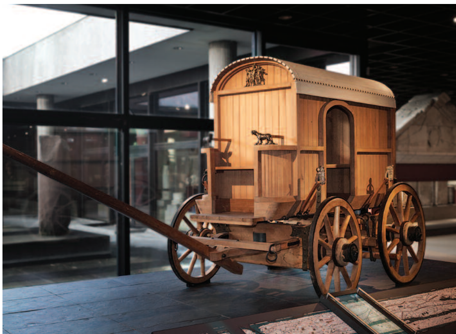
Fig. 10. Reconstitution du char de voyage de la vallée du Vardar, début du 3 e s. apr. J.-C. Römisch-Germanisches Museum Köln, inv. 44, 9-102.

offrait plus de confort aux passagers, facilitait le travail de l'attelage et maintenait le char en bon état. Seules les voitures les plus luxueuses en étaient toutefois pourvues. La présence de cet appareil reflète la richesse et donc le prestige de son propriétaire. Les pièces qui le composent n'ont donc pas qu'une valeur fonctionnelle, d'où le riche décor que présentent ces gaines de courroies en bronze.