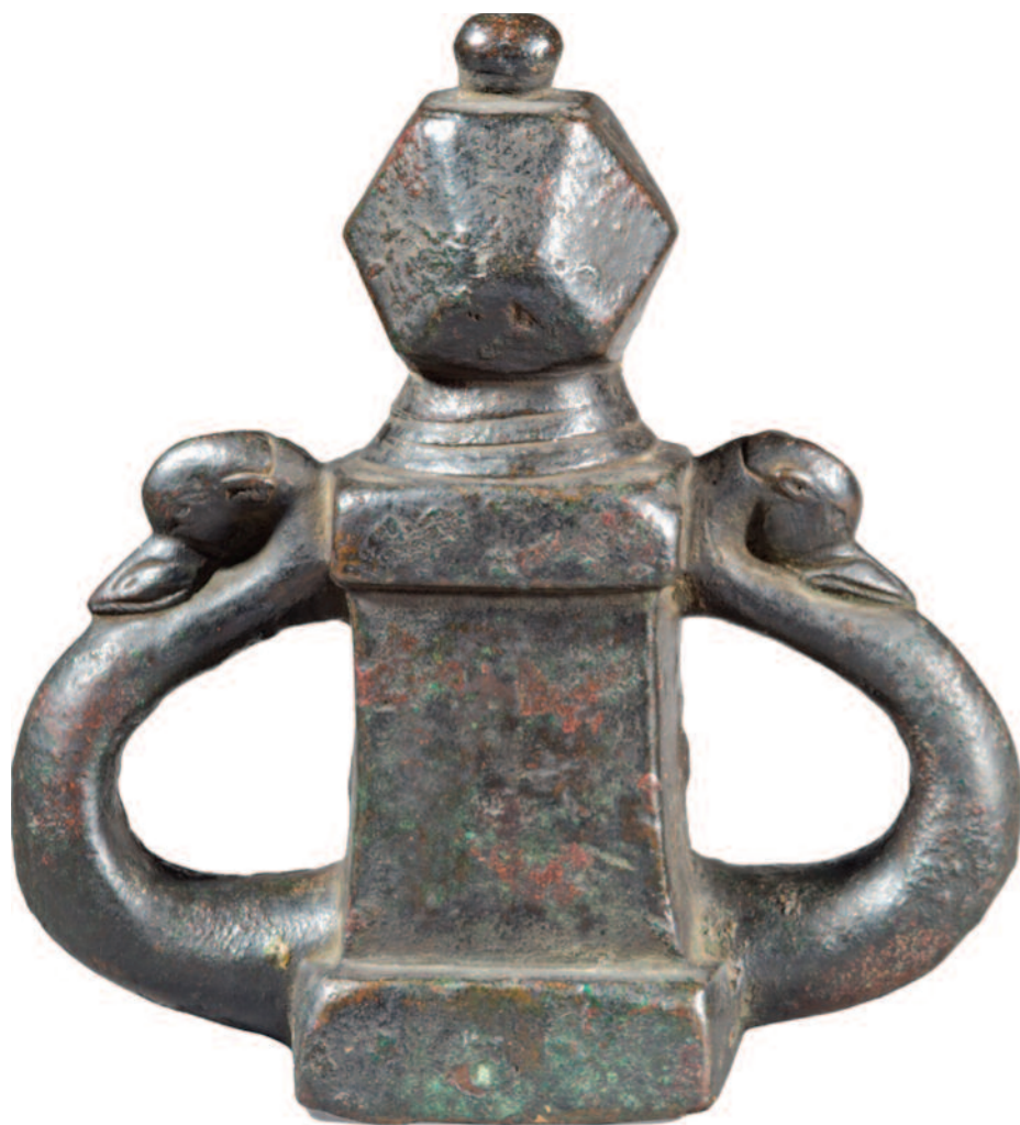
Fig. 1b. « Verso » de l'objet en bronze du 4 e s. apr. J.-C. Bibliothèque nationale de France – Département des monnaies, médailles et antiques, inv. bronze.1885.