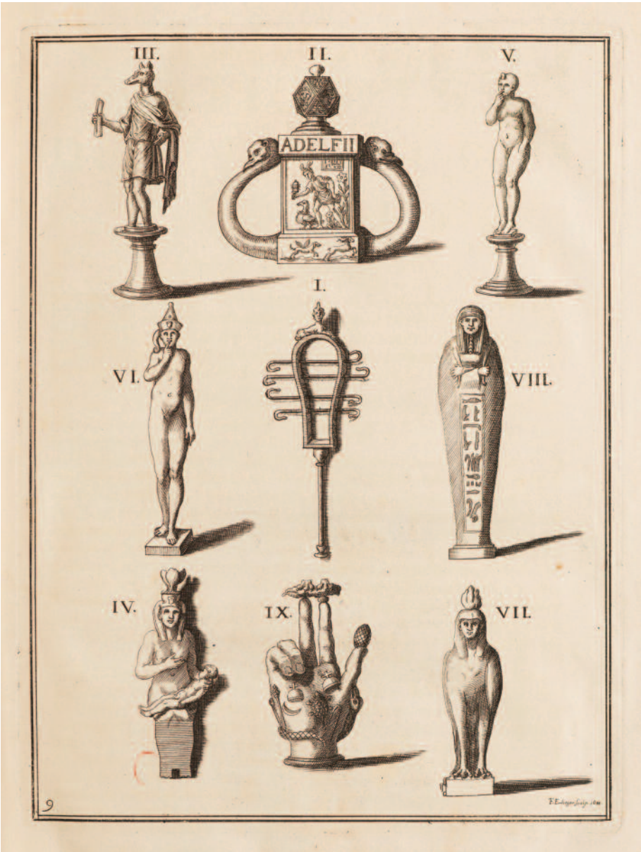
Fig. 5 Planche 9 de Claude DU MOLINET, Le cabinet de la Bibliothèque de Sainte Geneviève , Paris, 1692.