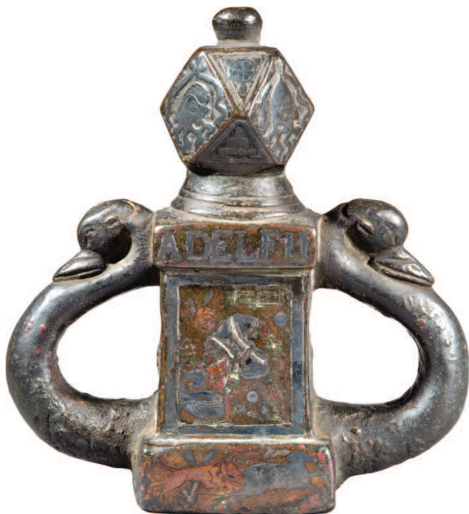
Fig. 1a. « Recto » de l'objet en bronze du 4 e s. apr. J.-C. Bibliothèque nationale de France – Département des monnaies, médailles et antiques, inv. bronze.1885.