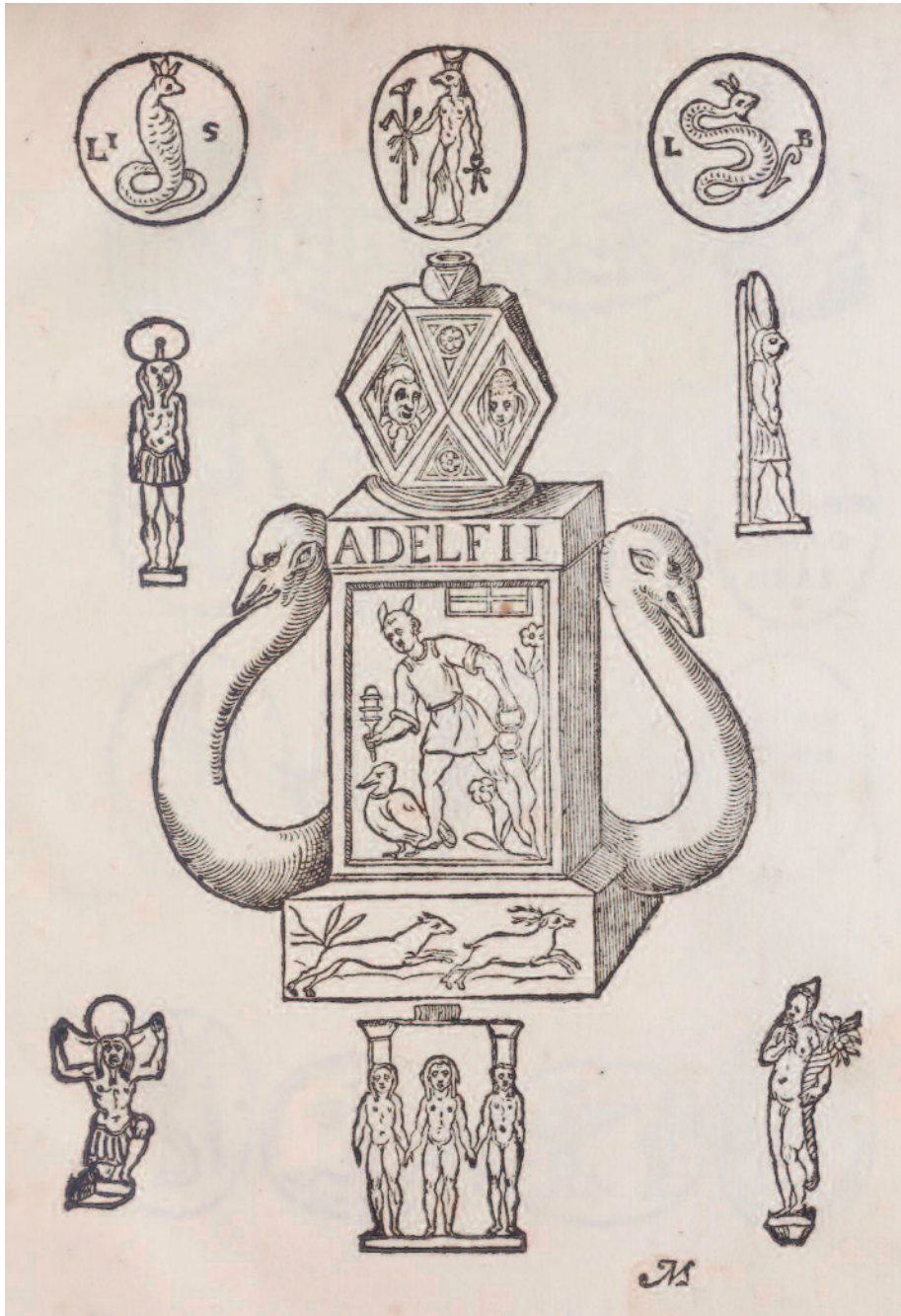
Fig. 2. Planche 2 de Lorenzo PIGNORIA, Vetustissimae tabulae aeneae sacris Aegyptiorum simulachris caelatae accurata explicatio , Venetia, 1605.