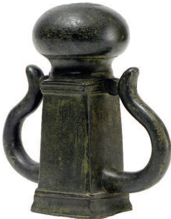
Fig. 8 Objet en bronze, Nimy-Maisières, fin du 2 e – 3 e s. apr. J.-C. Musée royal de Mariemont, inv. B.72.

logue des antiquités de la collection Warocqué 76 . Il y voyait alors une pièce fixée à l'extrémité du timon à travers les anses de laquelle on passait les courroies du joug.