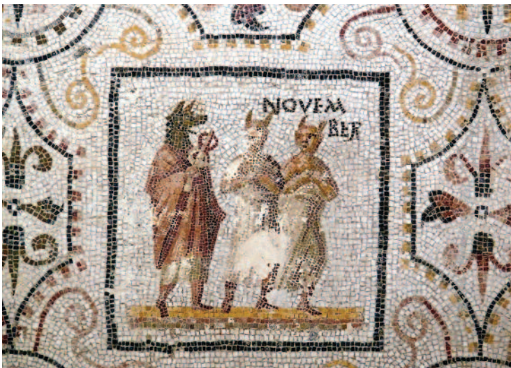
Fig. 7. Tableau du mois de novembre sur la mosaïque « au calendrier », maison romaine à Thysdrus (El Djem), début du 3 e s. apr. J.-C.

« ptérophores » 51 par les commentateurs modernes – sont en tout cas bien attestés hors d'Égypte en contexte isiaque. Les célèbres fresques peintes après 62 apr. J.-C. dans le péristyle du sanctuaire d'Isis de Pompéi intègrent ainsi un officiant au crâne rasé et emplumé, vêtu d'une longue tunique blanche, tenant un volumen ouvert dans les mains 52 . Telle est également l'attitude adoptée par l'un des processionnaires isiaques sculptés sur un bas-relief en marbre supposé provenir de Rome et dater de la fin du règne d'Hadrien 53 . Deux « ptérophores », vêtus de blanc, les épaules dénudées, apparaissent à côté d'un acteur de culte plus sombre, tenant un caducée et portant un masque d'Anubis, dans l'un des tableaux (fig. 7) qui ornent une mosaïque datée du début du 3 e siècle et mise