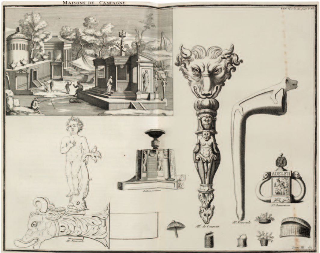
Fig. 6 Planche 65 de Bernard de MONTFAUCON, L'Antiquité expliquée et représentée en figures , vol. III.1, Paris, 1719.

comme égyptien, Montfaucon considérant que la figure tenant un sistre « ressemble à un Mercure » 39 .