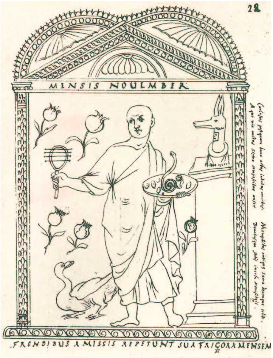
Fig. 4 Feuille reproduisant la vignette du mois de novembre d'après le Chronographe de 354 , 1620. Biblioteca Apostolica Vaticana, Barberini Latinus 2154, fol. 22.