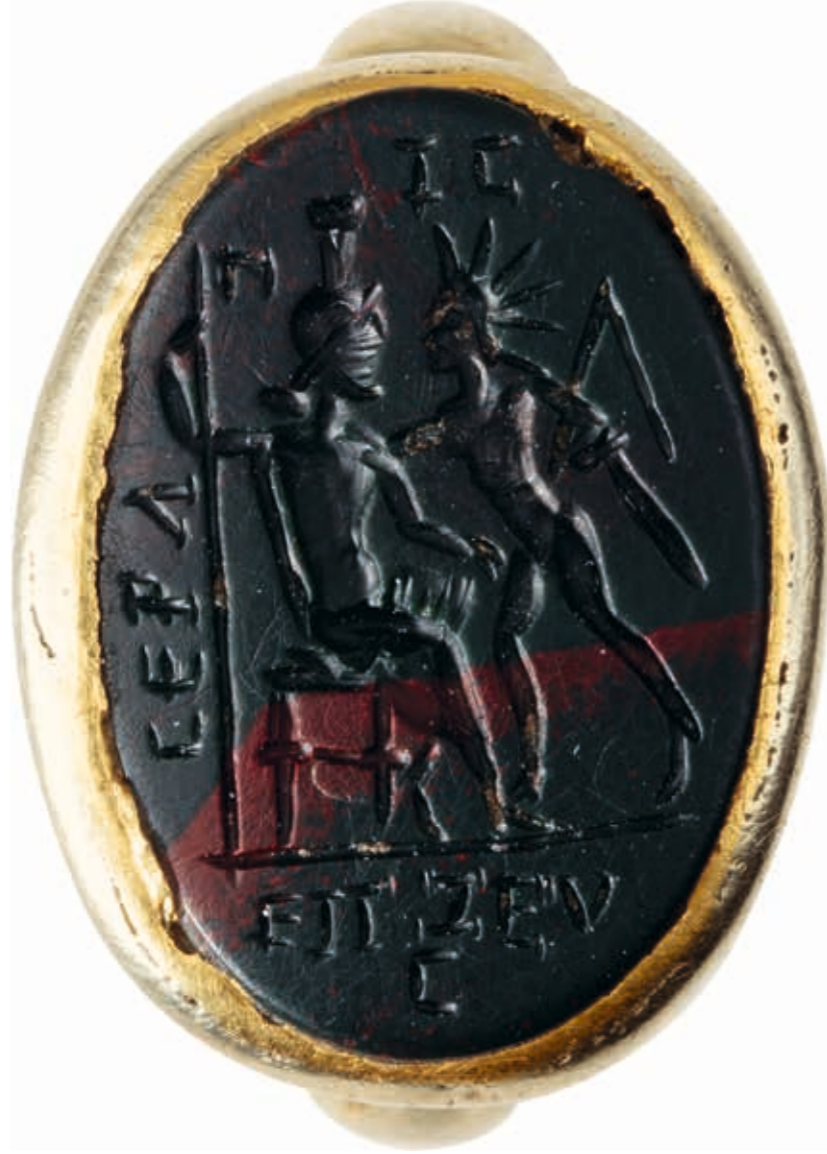
Ring met Helios en Sarapis, 3e eeuw n.C. Morlanwelz, Musée royal de Mariemont

Links zit de beschermgod van de stad Alexandrië, Sarapis, op een troon. Rechts staat Helios, de Zon, in de gedaante van een baardloze jongeman met op zijn hoofd een kroon met zes stralen. Dit tafereel wordt vaak de 'zoen van de zon' genoemd en symboliseert een ritueel waarmee men het standbeeld van de god nieuw leven wilde inblazen door het met de Zon te verenigen.