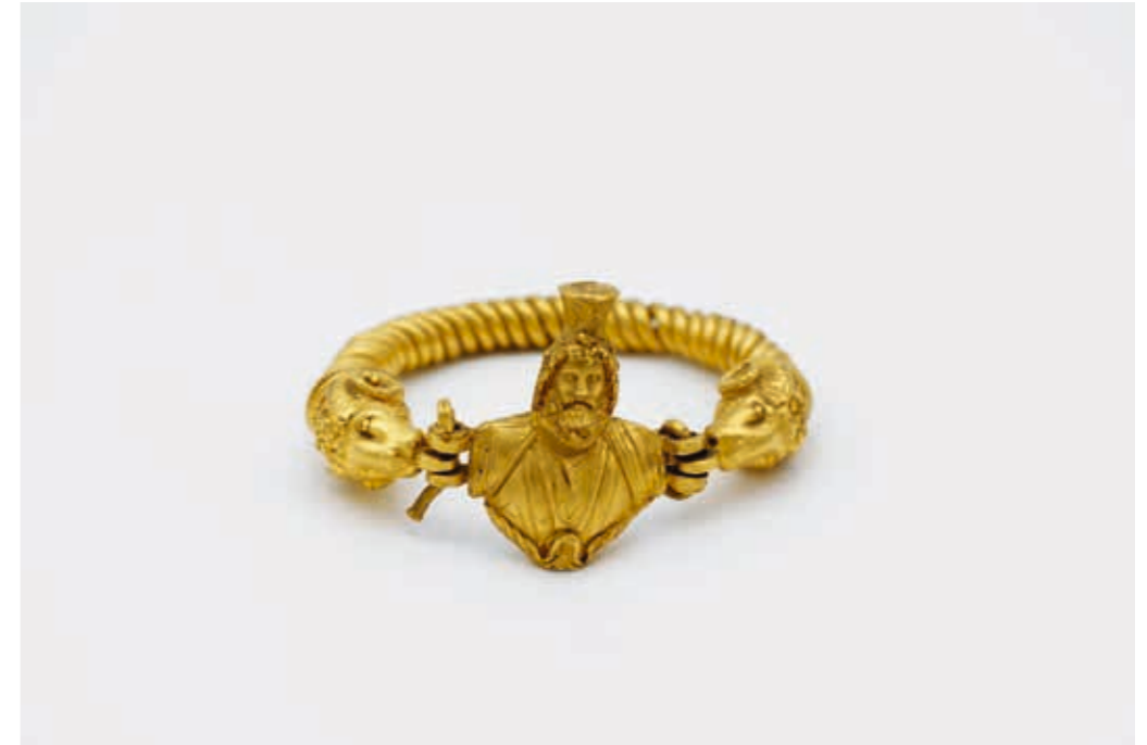
Armband met buste van een godheid in een tempel, 30 v.C.–395 n.C. Athene, Nationaal Archeologisch Museum