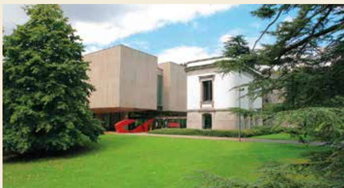
L'entrée du Musée royal de Mariemont : le bâtiment de Roger Bastin et le mémorial du château Warocqué.

Au cœur d'un ancien domaine royal, fondé au milieu du XVI e siècle et classé comme site exceptionnel de Wallonie, le Musée royal de Mariemont veille à la gestion, à l'étude et à la valorisation du patrimoine légué en 1917 à l'État belge par un homme d'affaires fortuné, Raoul Warocqué. Abritant l'une des plus importantes collections publiques belges, estimée à quelque 100 000 biens culturels mobiliers, il est aujourd'hui le seul établissement scientifique et muséal directement géré par la Fédération Wallonie-Bruxelles. Son exposition permanente est riche et diversifiée, mêlant les témoignages de l'histoire régionale et nationale aux trésors des plus grandes civilisations du monde. Les antiquités méditerranéennes en constituent l'un des ensembles majeurs que l'on doit, en grande partie, aux conseils experts d'un des amis proches de Warocqué, l'historien belge des religions Franz Cumont. L'exposition est l'occasion de mettre à l'honneur cet éminent savant qui, en raison de ses travaux pionniers sur le sujet, se faisait même parfois surnommer « Mithra ».