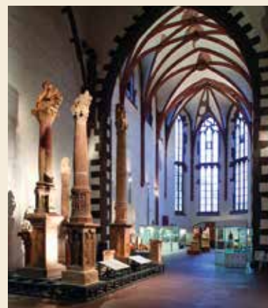
Les antiquités romaines de l'Archäologisches Museum Frankfurt.

L'Archäologisches Museum Frankfurt préserve, étudie et valorise l'histoire de la ville de Francfort et redonne vie à l'Antiquité classique et à l'Orient ancien. Les salles aménagées dans l'église médiévale de l'ancien monastère des Carmélites proposent un voyage depuis les premières traces d'occupation humaine jusqu'aux monastères de la fin du Moyen Âge. On y observe aussi les trouvailles archéologiques des tumulus des âges du Bronze et du Fer de la forêt urbaine de Francfort ainsi que celles de la cité romaine de Nida – où l'on a mis au jour pas moins de quatre sanctuaires de Mithra d'importance suprarégionale. Le complexe archéologique du « Kaiserpfalz Franconofurd » offre, en outre, un aperçu de 2000 ans d'histoire de la ville. Les collections d'antiquités classiques et orientales présentent des monuments d'Asie Mineure, de Grèce, d'Italie et d'Afrique du Nord. L'accent est mis sur les Étrusques, les Latins et les autres peuples de l'Italie préromaine ainsi que sur les arts de l'Iran ancien.