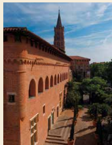
La façade méridionale du musée Saint-Raymond.

Les mondes méditerranéens anciens constituent un domaine d'exploration privilégié dans le parcours permanent et la programmation d'expositions temporaires, d'où l'attention particulière portée à ce projet européen dédié au culte romain de Mithra qui a laissé de nombreux témoignages dans le sud-ouest de la Gaule.