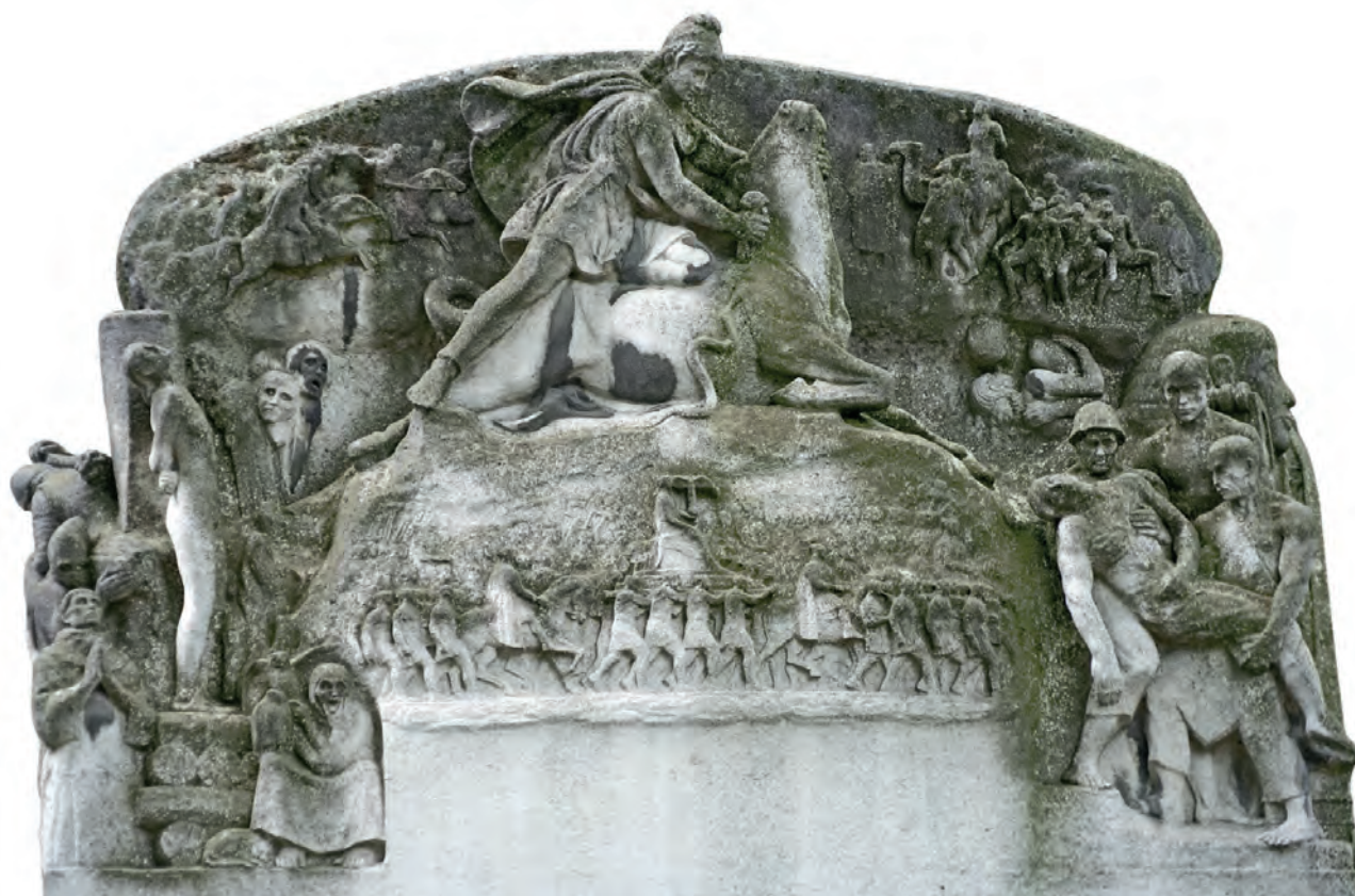
Fig. 2 Monument commémoratif de Paul Adam par Paul Landowski, Paris – Palais de Chaillot, 1931.

Cette idée d'une force fécondante se retrouve dans un grand dessin du plasticien niçois Ernest Pignon-Ernest (Cat. I.10), au titre évocateur : « Picasso/Mithra féconde la terre avec le sang du taureau ». Présenté en Arles en 1992, il figurait alors sur un anneau de Möbius de 2 m sur 10. Sur cette composition, l'artiste espagnol est figuré nu, égorgeant d'une lame tenue dans sa main droite, à la manière de Mithra, un bovidé gigantesque qu'il chevauche et dont