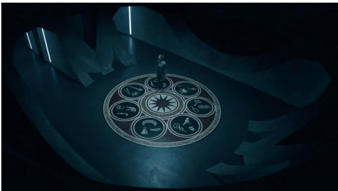
Fig. 8 L'androïde Mère au centre de symboles mithriaques dans l'épisode 5 de la série Raised by Wolves créée par Aaron Guzikowski, 2020.

En septembre 2020, Mithra se retrouve au cœur d'une nouvelle série télévisée américaine de science-fiction post-apocalyptique Raised by Wolves (Cat. I.12), qui est diffusée sur le service de vidéo à la demande «HBO Max». Créée par Aaron Guzikowski, avec Ridley Scott comme producteur exécutif, la série plonge le spectateur au XXII e siècle dans un futur dystopique. La Terre a été ravagée par une guerre religieuse sans précédent ayant opposé les athées aux membres de l'église des mithriaques ( Mithraic ), qui vénèrent le dieu Sol. Les athées envoient deux androïdes, Mère et Père, sur une exoplanète, Kepler-22b, avec 12 embryons pour reconstruire une civilisation dépourvue de religion. Réfugiés dans une arche spatiale, les Mithraic survivants se dirigent, eux aussi, vers la même planète pour fonder une colonie et perpétuer leurs croyances. Pour donner naissance à leurs Mithraic , les concepteurs de la série ont mêlé les références religieuses, combinant symboliques mithriaques (fig. 8) et chrétiennes 35 . Les Mithraic se réclament ainsi d'un « Livre des écritures », pratiquent la communion, et leurs soldats dévots – tel Marcus interprété par Travis Fimmel – portent une tenue blanche marquée du soleil rouge de Mithra.