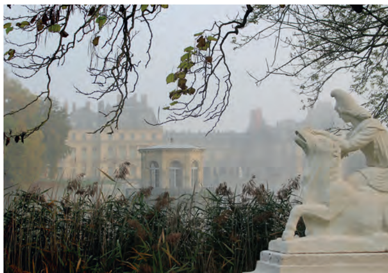
Fig. 1 Statue de Mithra tauroctone face à l'Étang des Carpes dans le parc de Fontainebleau.