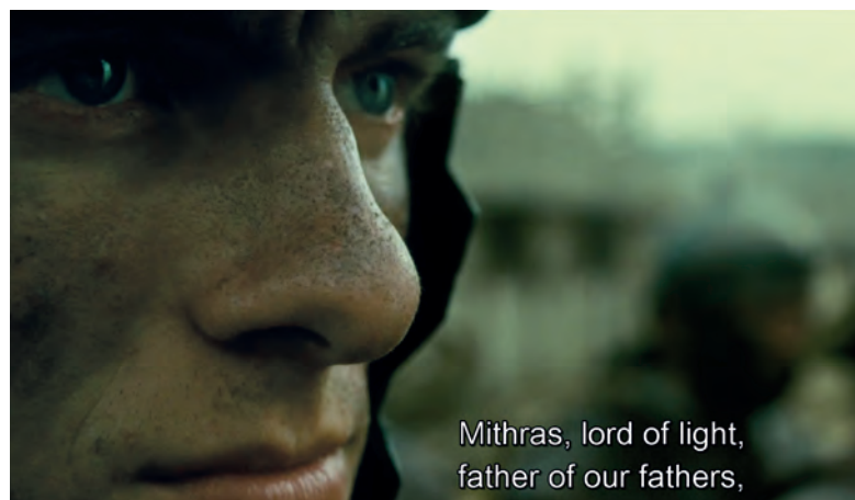
Fig. 6 Prière à Mithra avant la bataille dans le film The Eagle réalisé par Kevin Macdonald, 2011.