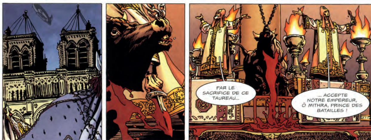
Fig. 5 Duval, Pécau, Gess et Thorn, Jour J. Vive L'Empereur . 2 décembre 1925, 2011, pl. 45, cases 1 à 3.