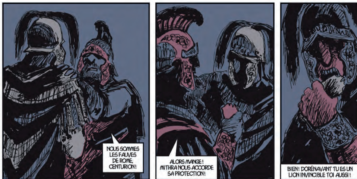
Fig. 4 Thierry Lamy et Christian Léger, Labiénus , 2004, tome 1, pl. 10, cases 1 à 3.