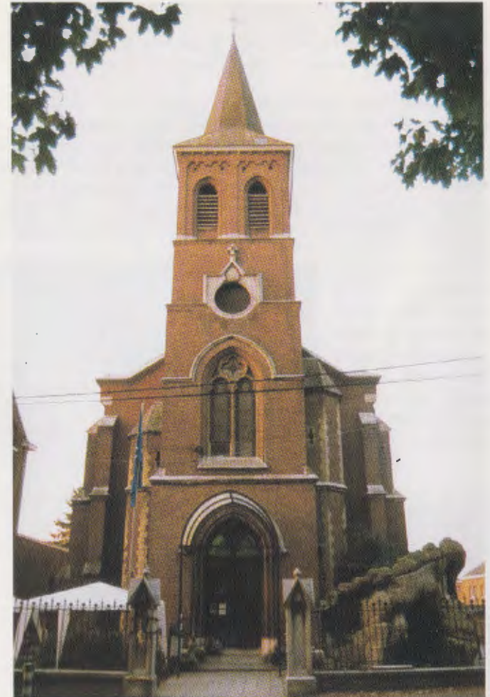
VOROUX-GOREUX EGLISE SAINT-LAMBERT JOURNÉE DU PATRIMOINE SEPTEMBRE 1999