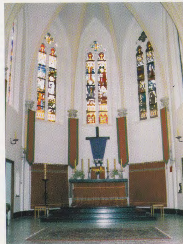
Dimanche des Rameaux 2001

(Au bas du document et d'une autre écriture)